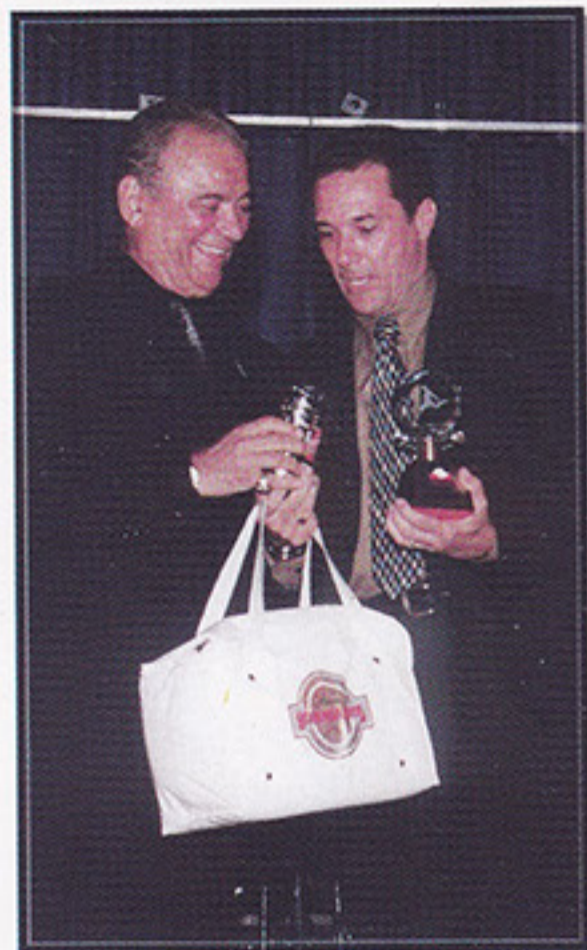
Olten homenageia Luxemburgo

oportunidade, Luxemburgo estará a poucos dias do início da principal competição que o futebol brasileiro vai disputar nesse ano, a Copa América 99. E como o Brasil conquistou o título da última edição desta Copa que foi disputada na Bolívia, a expectativa é a de que, com Luxemburgo no seu comando, o Brasil chegue ao bicampeonato, em junho, no Paraguai. Competência e experiência para tanto é o que não lhe faltam.