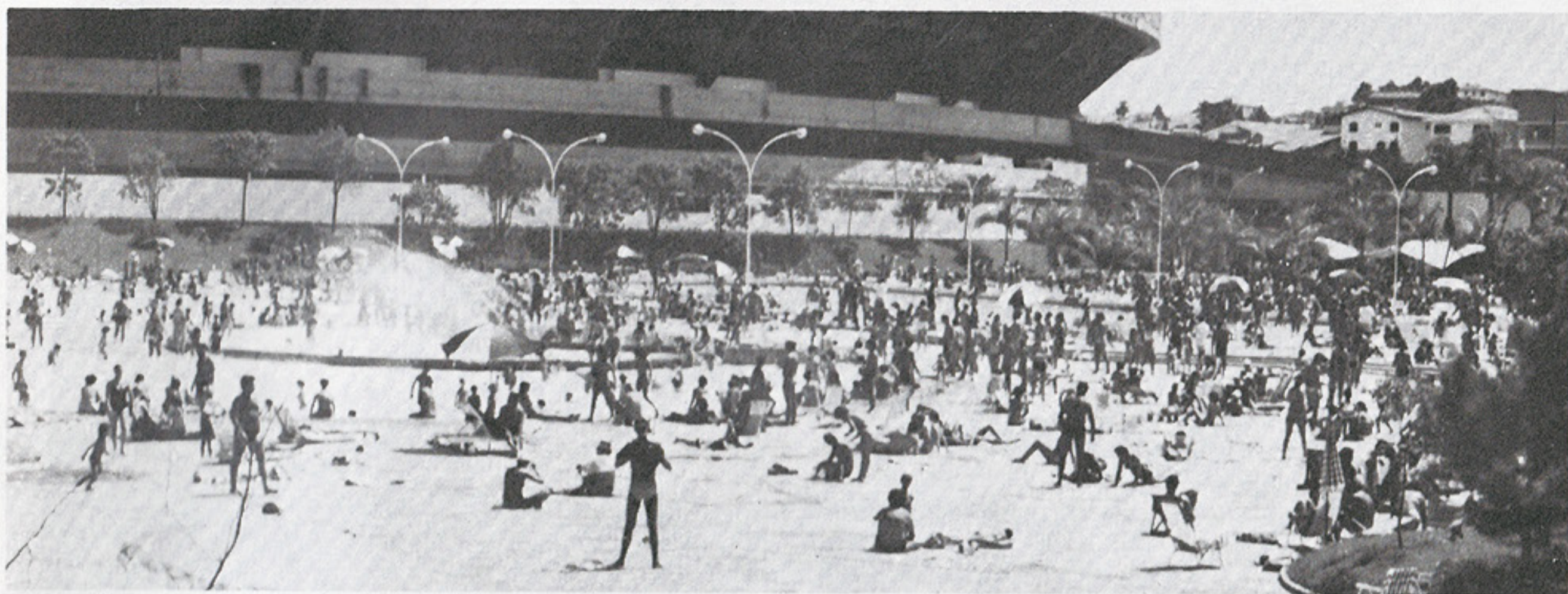
Piscinas lotadas: um excelente verão que também exige certos cuidados

O mês de janeiro foi sensacional e fevereiro não fica atrás: há muito tempo a cidade de São Paulo não tinha um verão tão alegre e agradável quanto o deste começo de 1984, em que as piscinas do Tricolor surgem como excelente opção para quem gosta de curtir o sol. As piscinas do Morumbi têm ficado repletas de adultos e crianças, principalmente aos sábados e domingos, mas, mesmo durante a semana, os associados vêm participando das alegres manhãs e tardes de verão. O tempo ajuda: ao contrário do que aconteceu em 83, quase não tem chovido e, com isso, surge o aproveitamento em horário integral.