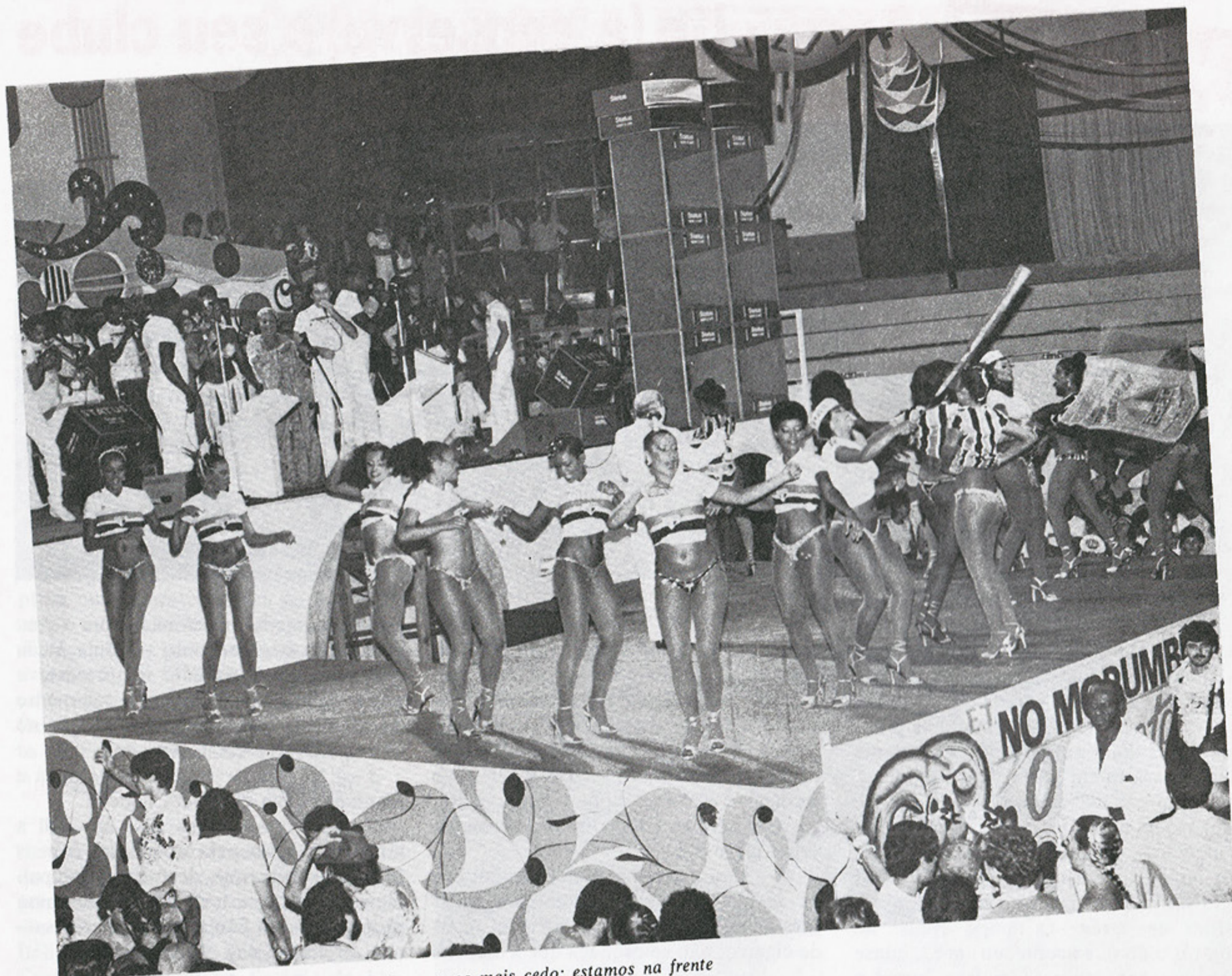
Entenda por que o carnaval do São Paulo começa mais cedo: estamos na frente