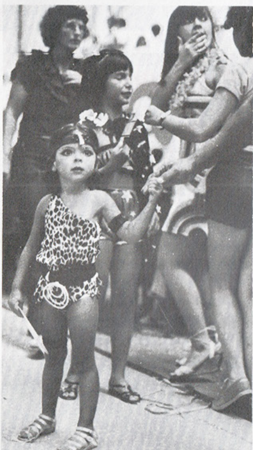
As crianças também têm vez, com as matinês

Em meados de fevereiro, o ginásio do São Paulo já estava quase pronto para receber os foliões: uma decoração maravilhosa, camarotes,