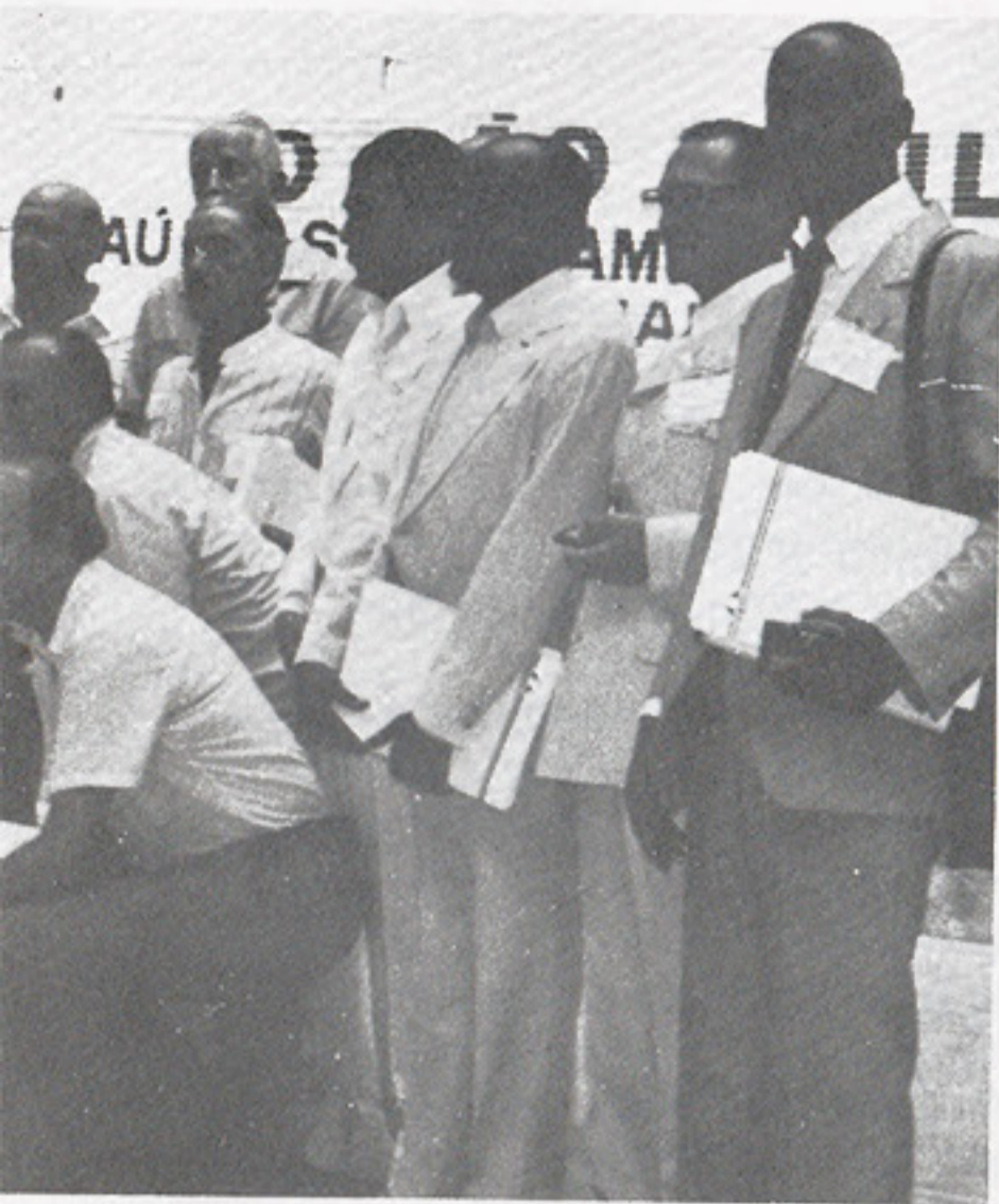
izados, logo após as homenagens.