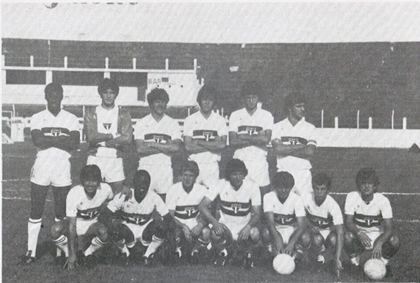
A equipe de juniores do São Paulo FC. jogou na Índia, fez vários passeios maravilhosos e retornou invicta.