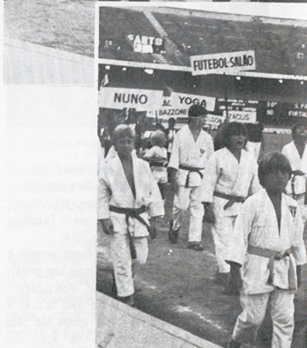
O garboso desfile dos meninos do Judô.