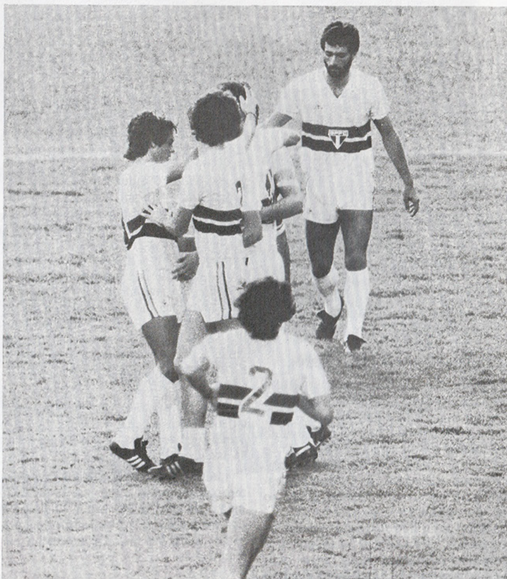
Alegria do time e da torcida.

Mas não faz mal. O próprio espetáculo não foi dos melhores. Os italianos vieram ao Brasil para um passeio e o São Paulo, com os seus compromissos seguidos no campeonato nacional, também não poderia apresentar um futebol de primeira linha. Mas valeu a pena. No primeiro tempo o jogo esteve muito lento de parte a parte. Os visitantes estavam com receio e ficaram aguardando a iniciativa do adversário. Da mesma forma, os são-paulinos aguardaram as ordens dos comandados do Falcão. E assim, nada houve de futebol.