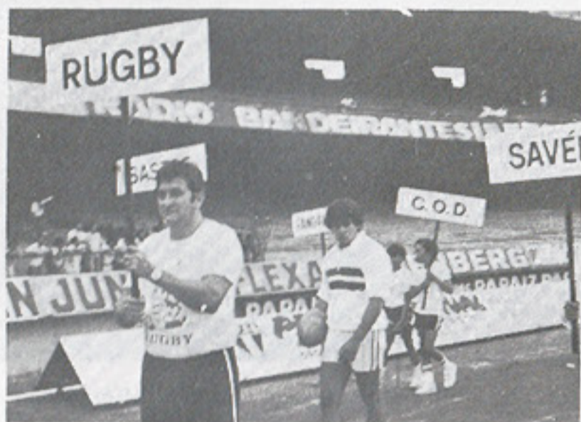
A seção de Rugby (à frente o seu técnico), também presente aos festejos

O São Paulo foi campeão paulista de 1943 tanto na categoria profissional como na de aspirantes e todos eles foram homenageados pela atual diretoria são paulina, quarenta anos depois. Alguns dos campeões do passado, por não se encontrarem na capital, não puderam comparecer e