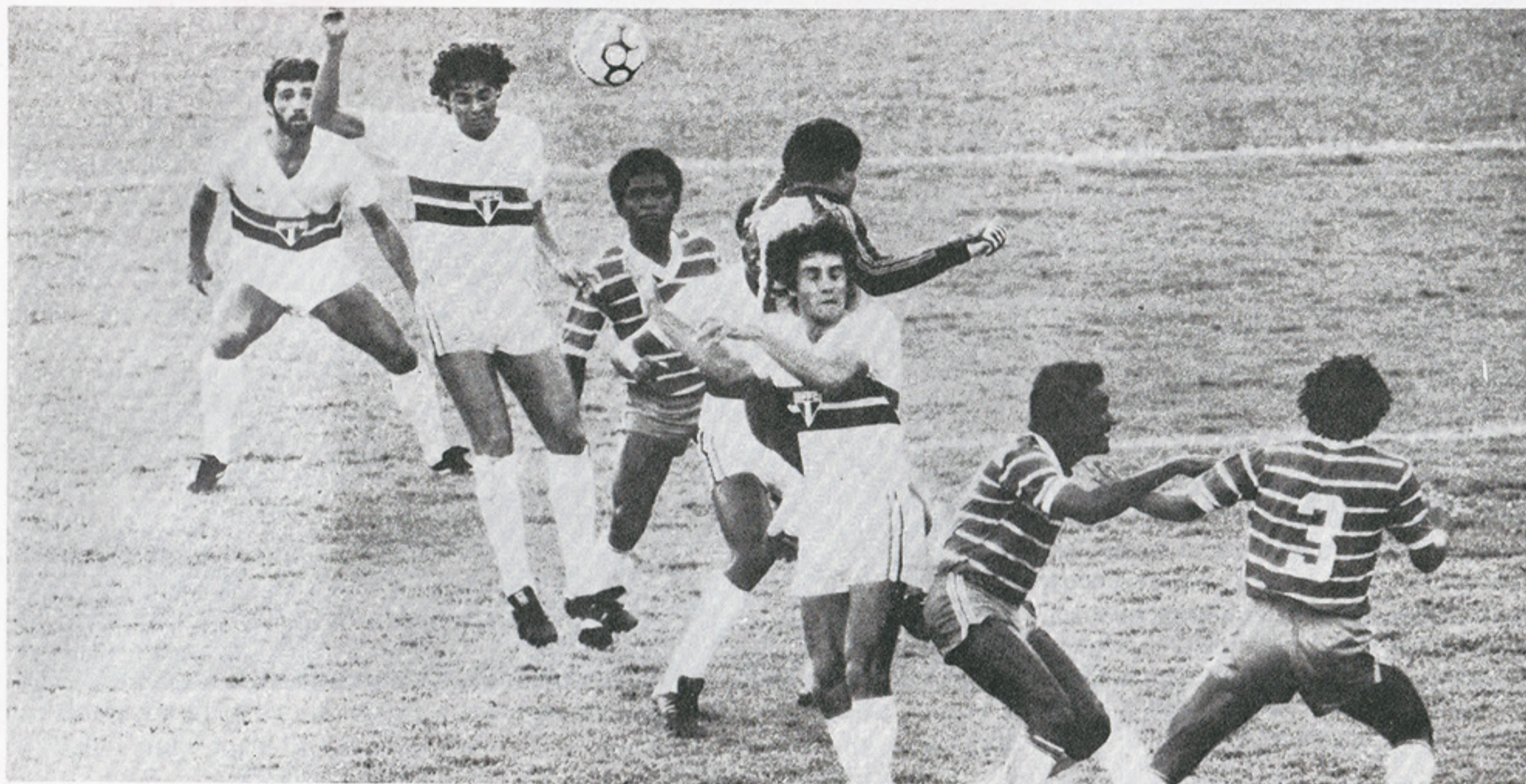
Contra o Fortaleza, uma sensacional goleada na tarde de festa do Morumbi

Praticamente classificado para a segunda fase do Campeonato Brasileiro já ao terminar, invicto, o primeiro turno da primeira fase, o time de futebol do São Paulo deu logo uma demonstração de que está novamente entre os favoritos ao título. Já na estréia, o Tricolor não teve dúvidas: derrotou o Vasco da Gama em pleno Maracanã, compensando muitas frustrações deste futebol paulista de campeonatos tão longos. Em seguida, conseguiu a goleada diante do Fortaleza, infelizmente acompanhada por público pequeno, que, pelo menos, teve a oportunidade de não só ver uma grande exibição do Tricolor como também de aplaudir as grandes jogadas do reforço Pianelli e viver a simpática nostalgia da homenagem aos campeões de 1943.