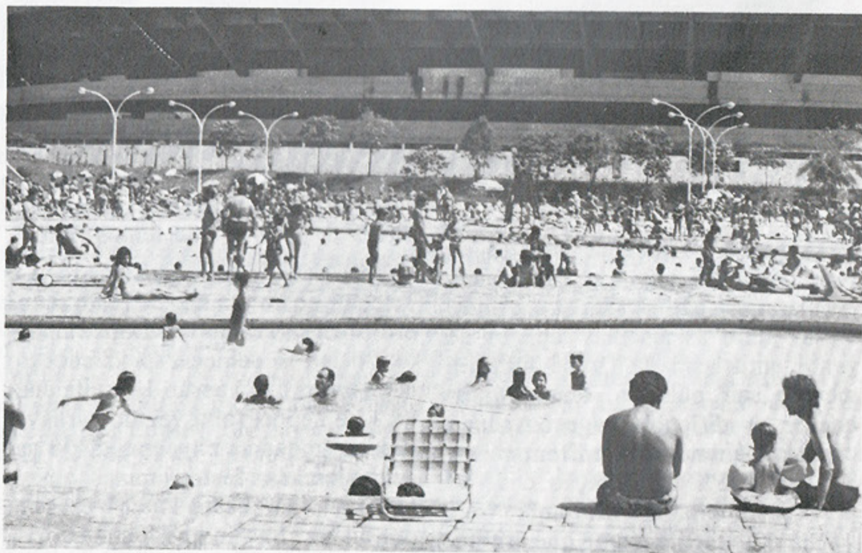
As piscinas com muita gente, curtindo o excelente verão

naval sendo planejado com organização e amor, os esportes amadores voltando às atividades, o time de futebol profissional conseguindo vitórias importantes, homenageando os heróis de 43, trazendo o Roma para um amistoso histórico. Um ano que começa, um excelente início com belas imagens do São Paulo.