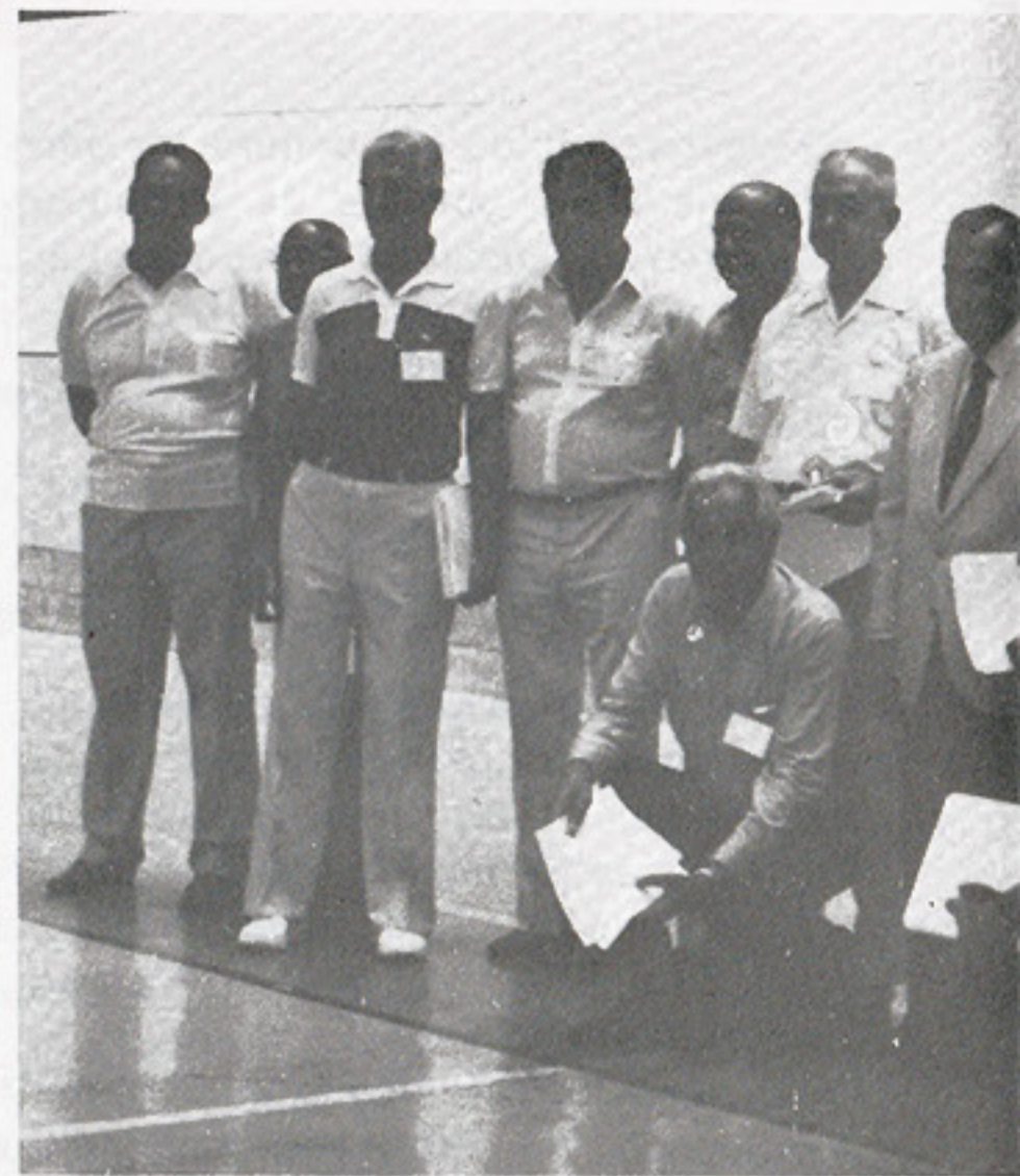
Ainda no Ginásio poliesportivo, os campeões de 43 confrate