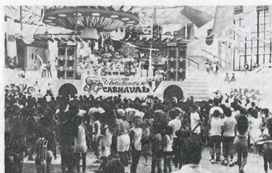
A decoração está pronta, vai ser um sucesso, mais uma vez

Outra vez as Mulatas no carnaval tricolor Pág. 15