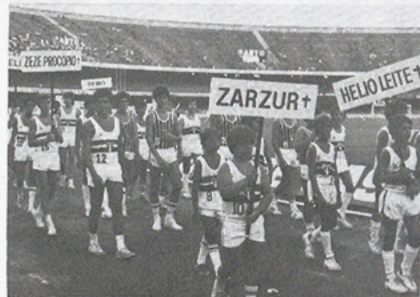
As plaquetas dos campeões de 43 carregadas pelos jovens são-paulinos de hoje

E, em virtude do excelente verão que estamos atravessando, o comparecimento às dependências esportivas do clube foi dos maiores e