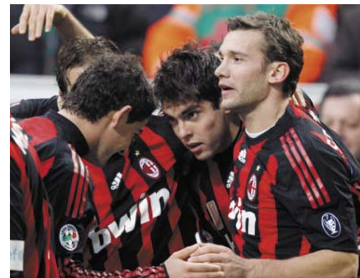
Kaká comemora o gol. Milan ainda está na briga, mas a Inter sobra no Italiano

Kaká e Amauri garantem vitória de suas equipes na rodada