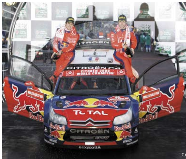
Sebastien Loeb comemora ao lado do companheiro Daniel Elena

Já sem a presença da Honda, começam hoje os testes coletivos da Fórmula 1, em Jerez de la Frontera, na Espanha, para a próxima temporada. A Williams será a única a entrar na pista hoje. Ferrari, McLaren, BMW, Renault e Toro Rosso iniciam amanhã as atividades, que vão até quinta-feira. Apesar de as equipes darem sequência aos trabalhos, a preocupação com o fechamento de mais escuderias na categoria persiste. A Federação Internacional (FIA) e Associação de times de F-1 (FOTA), estudam agora renegociar os valores dos direitos de transmissão da TVs e aumentar o repasse dessa verba para as escuderias para diminuir os efeitos da crise mundial.