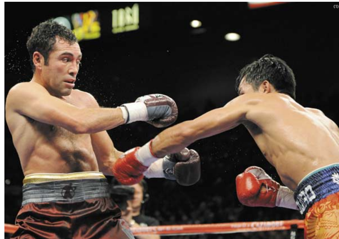
De La Hoya recua após levar soco, cena comum diante de Pacquiao, que ao final da luta disse: "Você ainda é meu ídolo"

que fez sua primeira luta como meio-médio (até 66,678 kg), "Eu percebi logo de cara que iria vencer. Controlei o combate, acertei todas e ele não encaixava nenhum soco", disse Pacquiao, que subiu duas categorias após ser campeão mundial dos leves. Após oito assaltos de puro domínio de Pacquiao, De La Hoya, que já tinha o olho esquerdo praticamente fechado e não conseguia mais se livrar das cordas, decidiu abandonar o combate. "Meu coração diz que devo continuar lutando, e eu quero continuar. Porém, fisicamente,