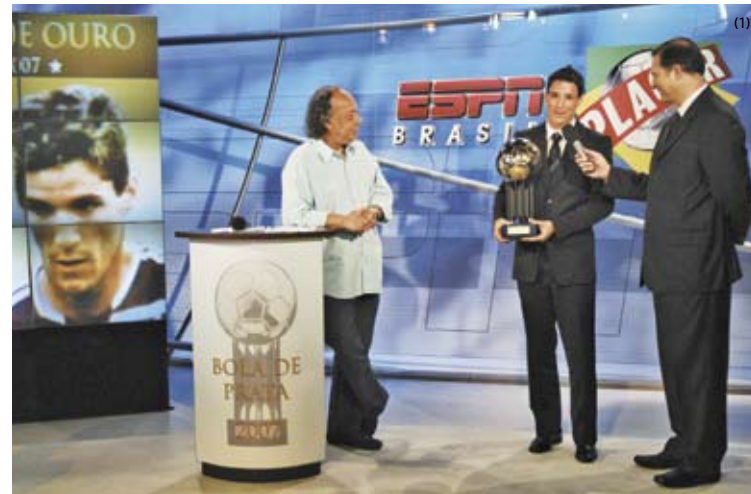
Thiago Neves recebe a Bola de Ouro em 2007. Hoje é no Museu do Futebol