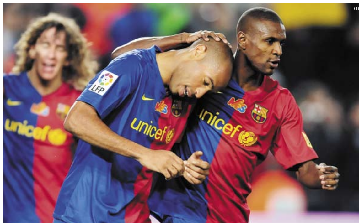
Sábado foi dia de Henry em Barcelona. Ontem, não foi o do Real Madrid. Semana que vem, na Catalunha, será o de quem?

Grandes da Espanha vivem situações opostas uma semana antes de mais um superclássico