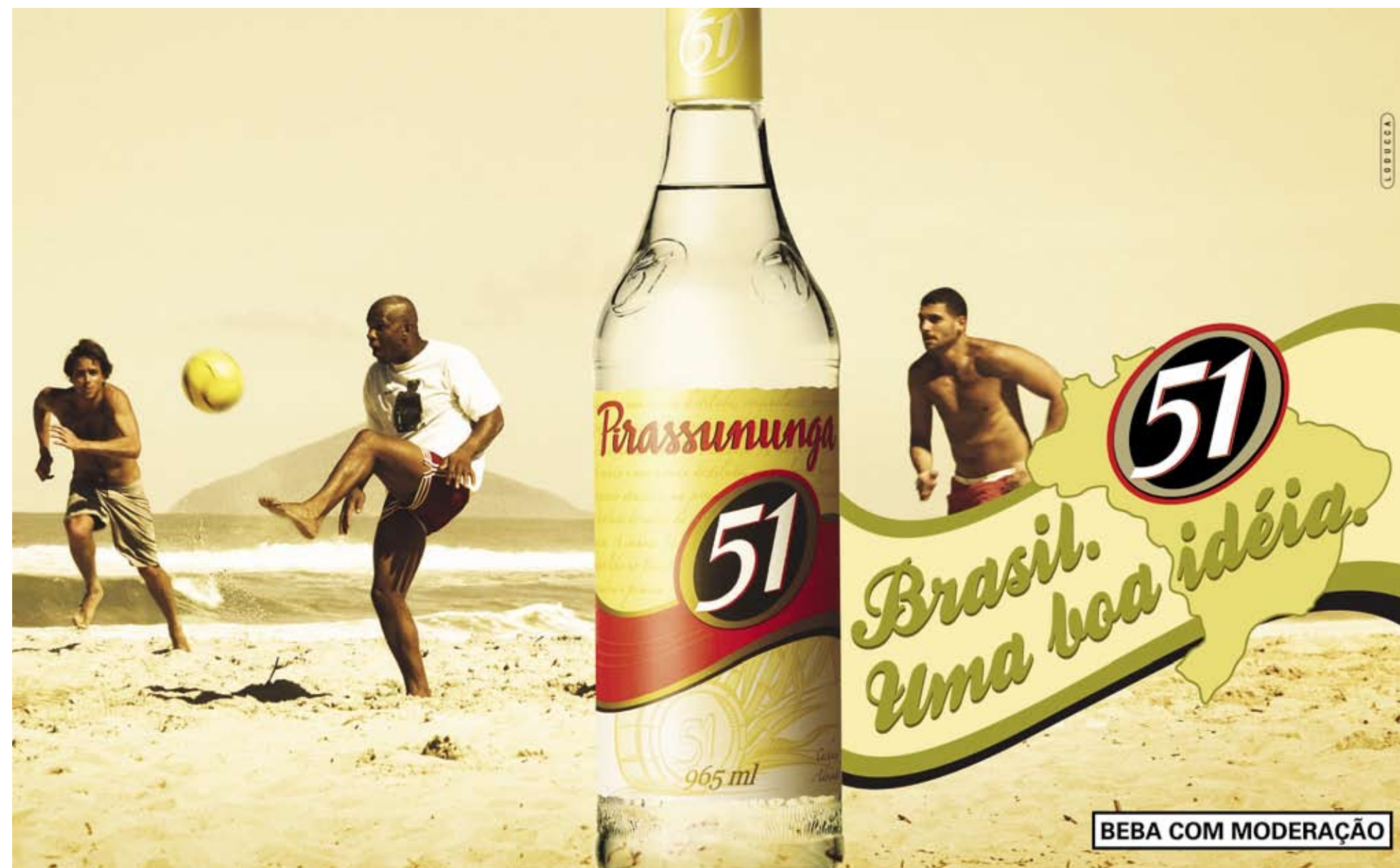
(1) FOTO VÍPCOMM (2) FOTO ALEXANDRE BATTIBUGLI