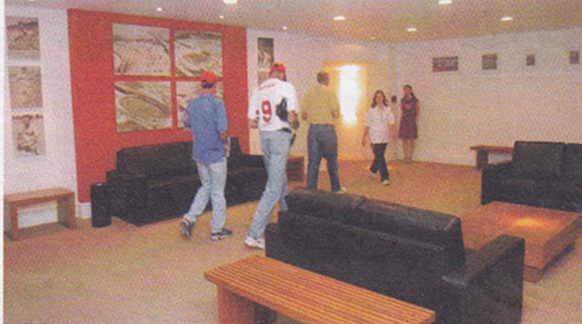
Morumbi Premium Club: cadeiras especiais numeradas