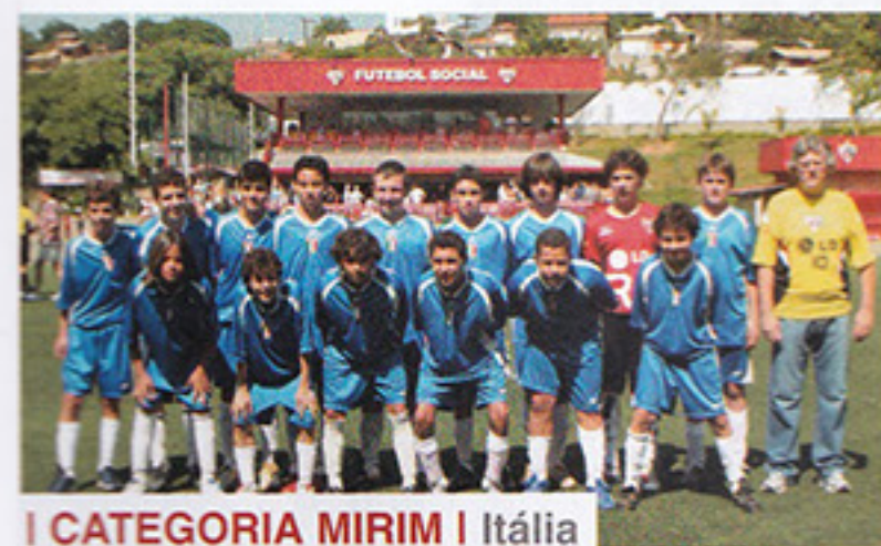
I CATEGORIA MIRIM | Itália