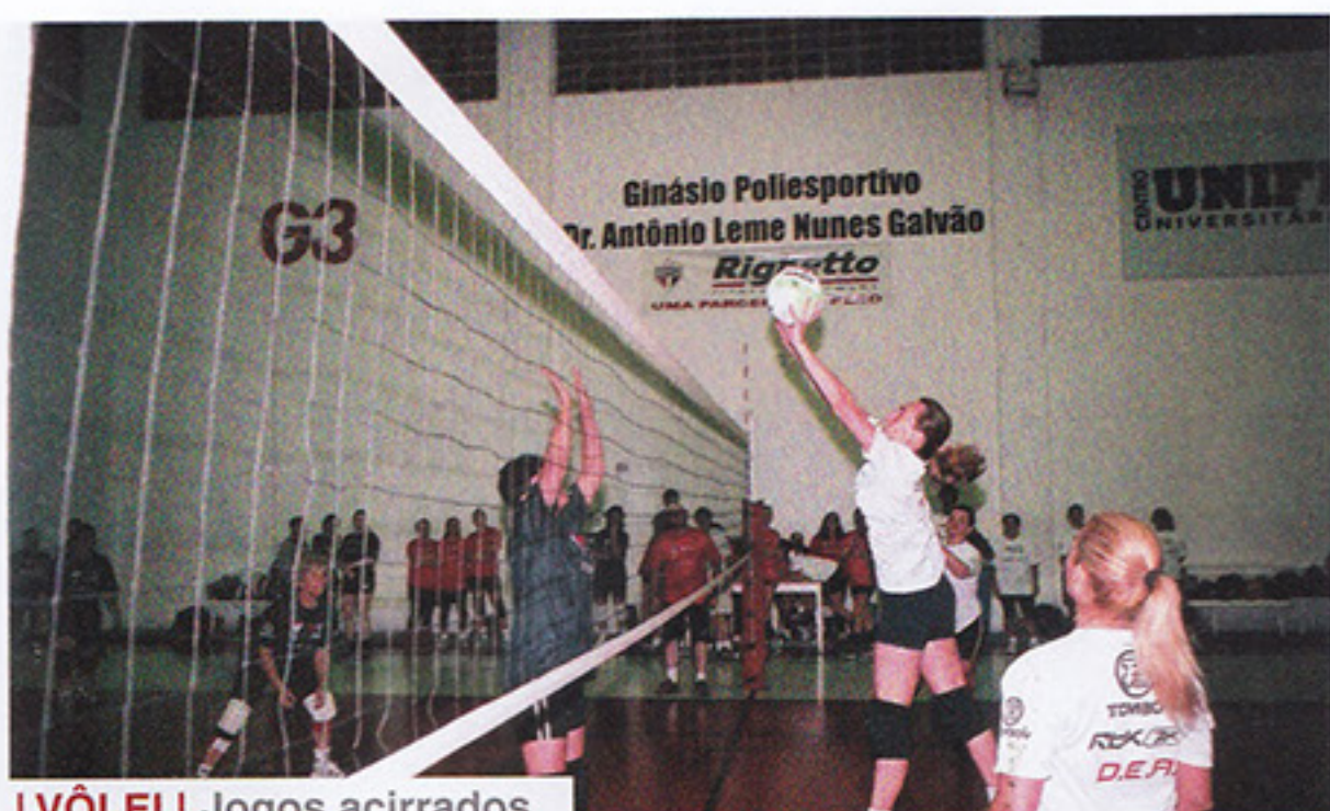
I VÔLEI | Jogos acirrados