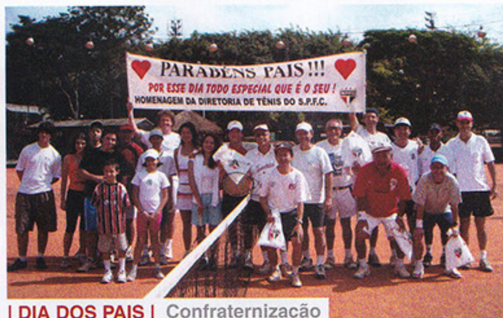
I DIA DOS PAIS I Confraternização

Pais e filhos participaram de um torneio especial no dia 12 de agosto em homenagem ao Dia dos Pais nas quadras de tênis do clube. Antes do início das partidas, o pessoal curtiu um café da manhã divertido. Em seguida os tenistas entraram em quadra para os jogos em duplas. Na final, todos receberam brindes pela participação.