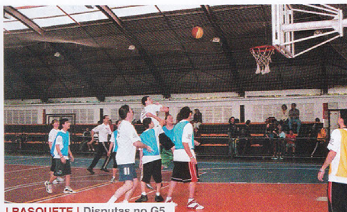
I BASQUETE | Disputas no G5