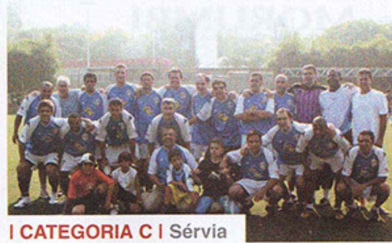
I CATEGORIA C | Sérvia