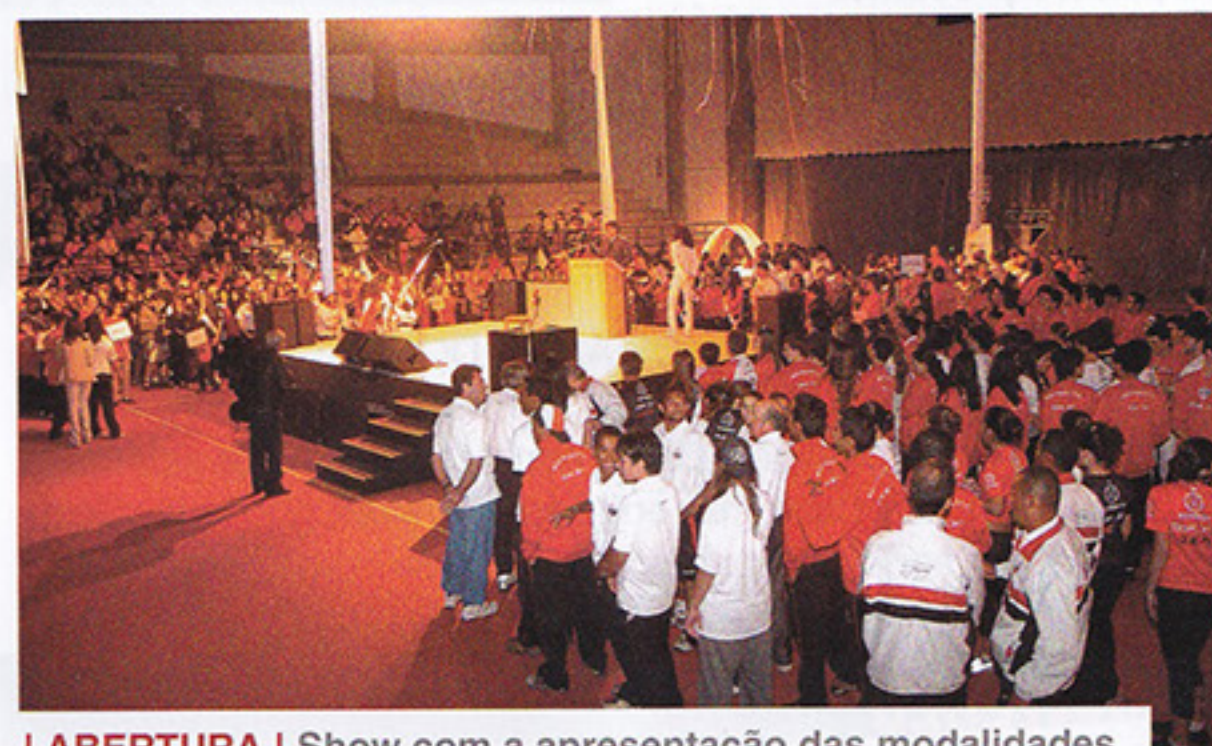
I ABERTURA | Show com a apresentação das modalidades