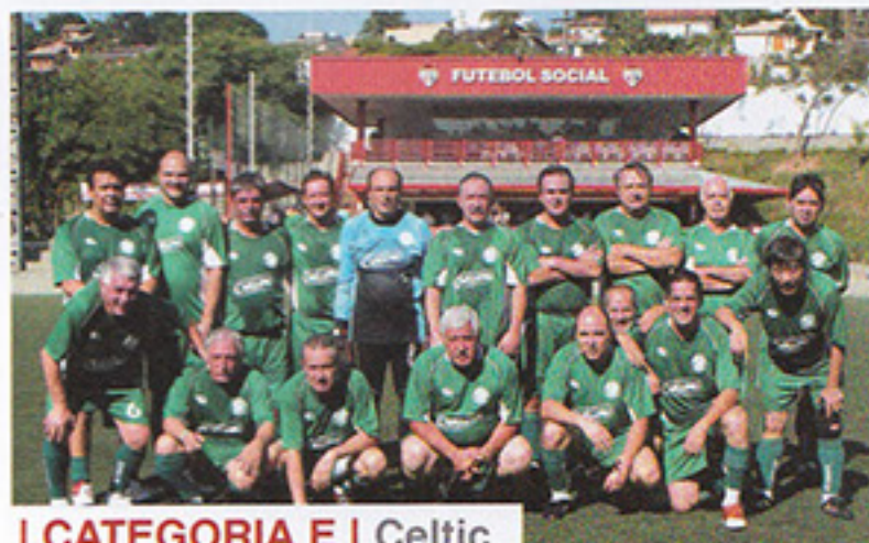
I CATEGORIA E | Celtic