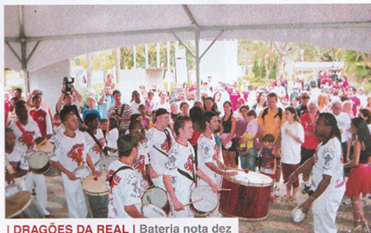
I DRAGÕES DA REAL | Bateria nota dez