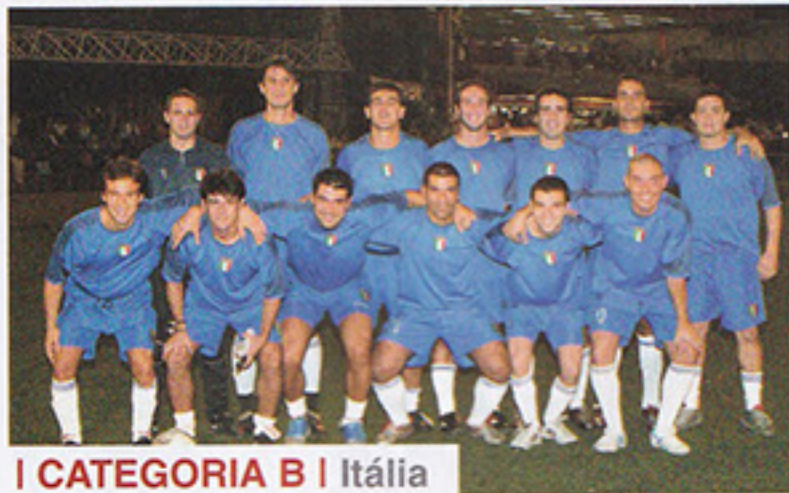
I CATEGORIA B | Itália