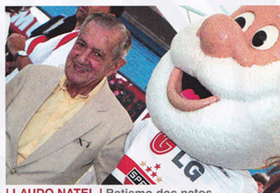
LAUDO NATEL | Batismo dos netos

O São Paulo Futebol Clube realizou nos dias 16 e 17 de dezembro, no Estádio do Morumbi, as duas últimas cerimônias do 'Batismo Tricolor' do ano de 2006. No dia 16 foram batizados 123 torcedores são-paulinos e, no dia 17, foi a vez de 65 associados do clube e diretores receberem o certificado de são-paulinidade das mãos do Santo Paulo, além de um DVD da solenidade, uma camisa oficial do projeto e um pequeno vaso com a grama do Estádio do Morumbi. Para 2007, já existem cerca de 2000 torcedores agendados para os meses de janeiro, fevereiro e março. Os interessados poderão se inscrever através do site www.saopaulofc.net .