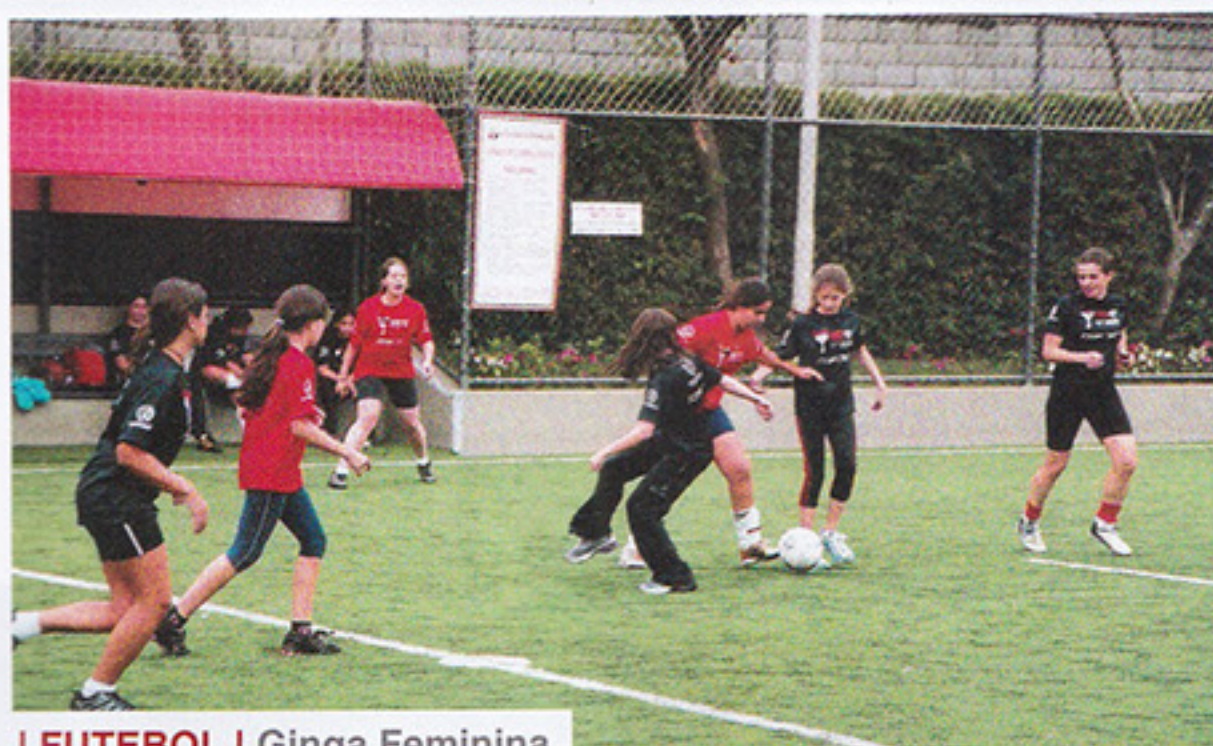
I FUTEBOL | Ginga Feminina