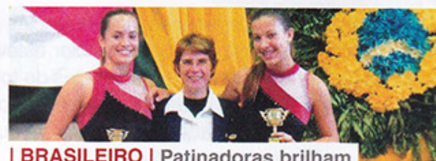
| BRASILEIRO | Patinadoras brilham