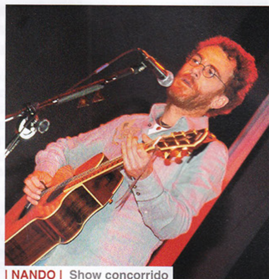
I NANDO I Show concorrido

No período de 29 de setembro a 07 de outubro, o São Paulo realizou a XXIV Olimpíada Vermelho, Branco e Preto tendo como tema "Olimpíada da Integração do DEA".