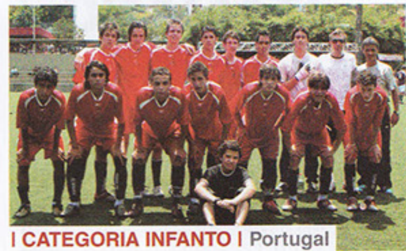
I CATEGORIA INFANTO | Portugal