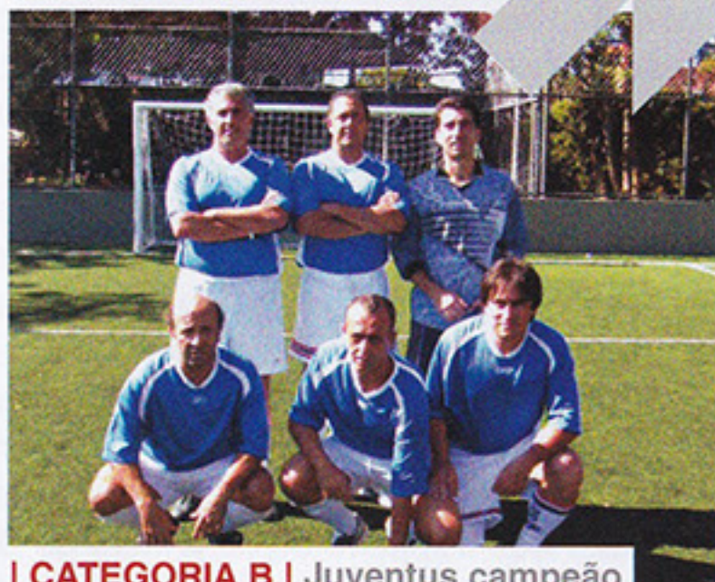
I CATEGORIA B | Juventus campeão