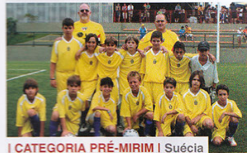
I CATEGORIA PRÉ-MIRIM | Suécia

No sábado, dia 16 de dezembro, os campos de futebol da área social receberam os finalistas do Campeonato Interno para os duelos decisivos que definiram os campeões de cada categoria. Confira as equipes que levantaram o troféu.