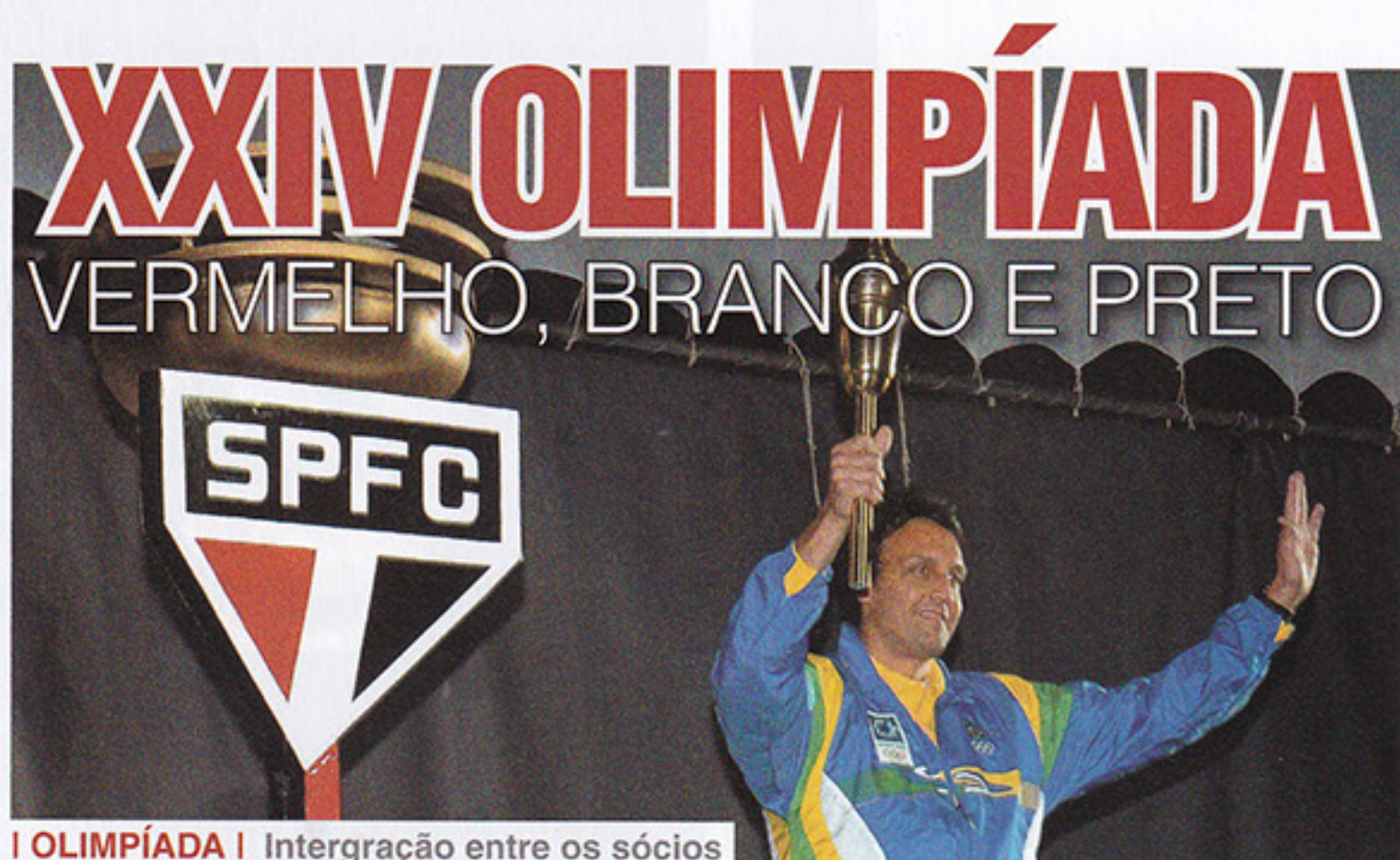
I OLIMPÍADA I Interação entre os sócios