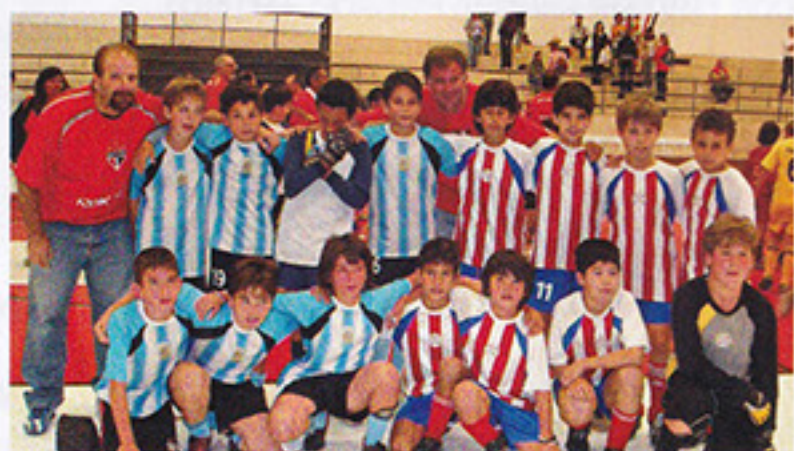
I PRÉ-MIRIM | Paraguai

guai (Pré-Mirim) e México (Mirim). A Mamadeira também finalizou a sua participação no campeonato. Como o objetivo da categoria é propiciar a diversão todos os participantes receberam medalhas.