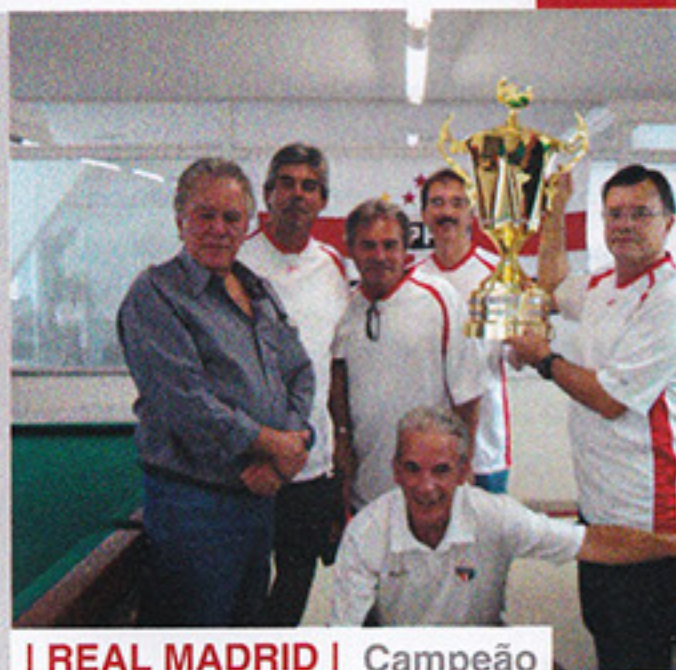
| REAL MADRID | Campeão