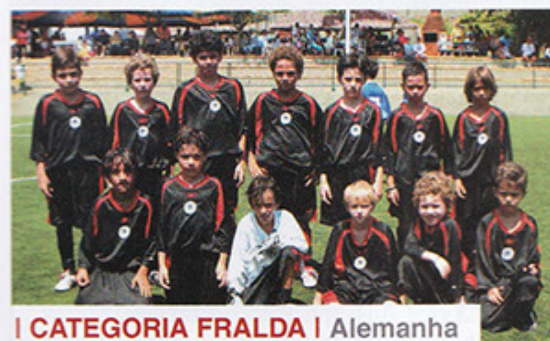
I CATEGORIA FRALDA | Alemanha