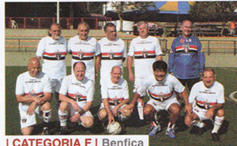
I CATEGORIA F | Benfica