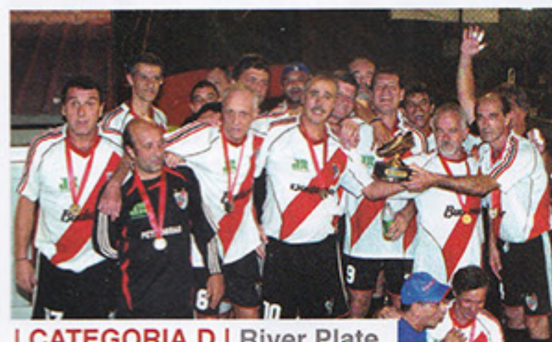
I CATEGORIA D | River Plate