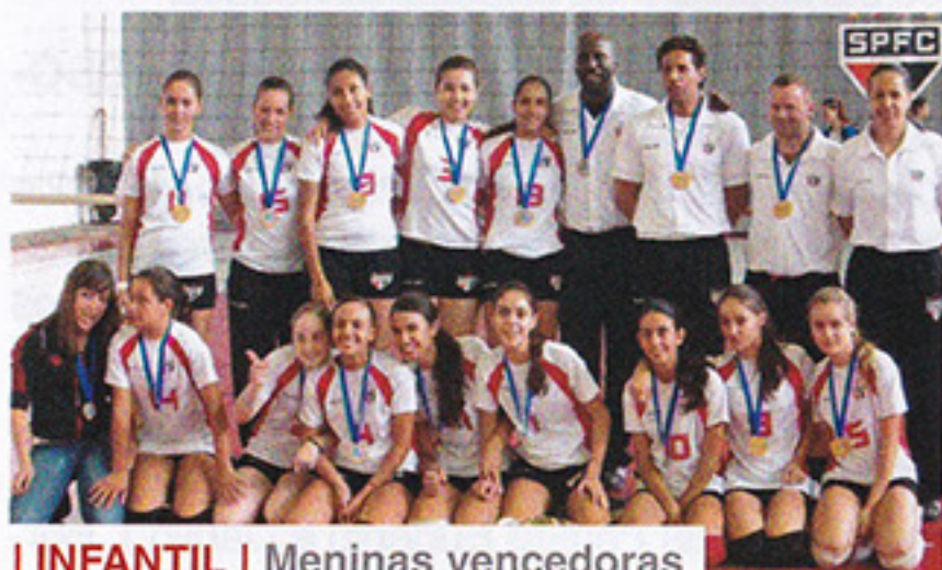
I INFANTIL | Meninas vencedoras

Venha fazer parte das equipes Máster Feminino (acima de 30 anos), Inscrições abertas na Central de Atendimento Único.