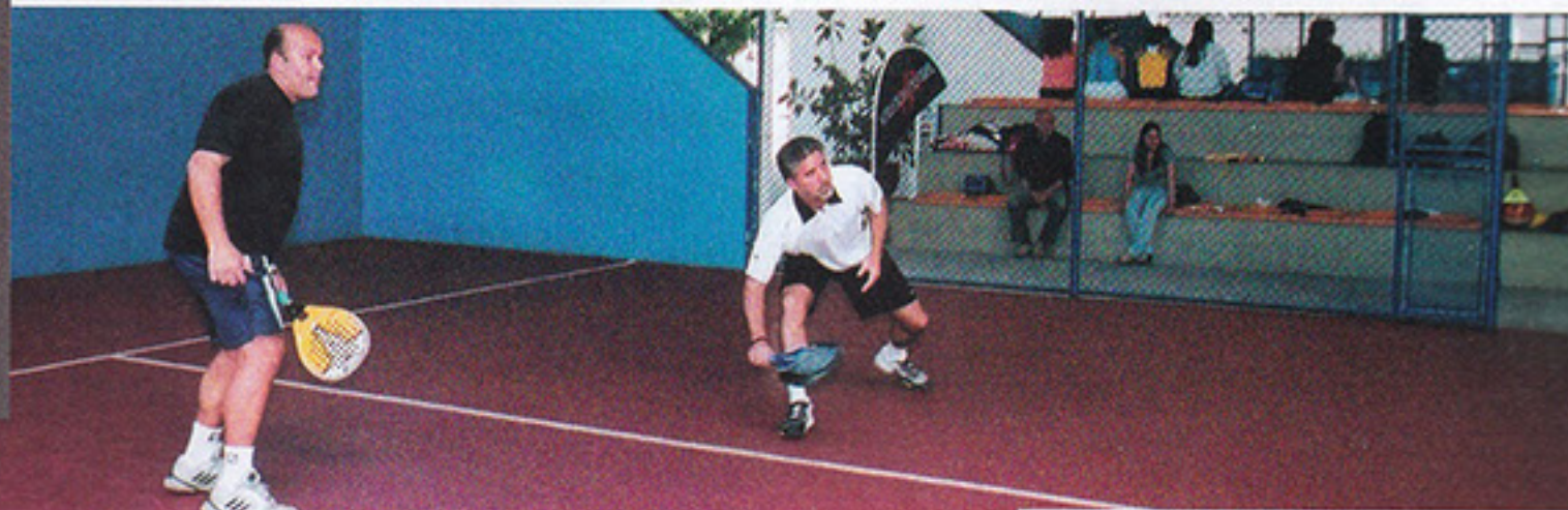
| PÁDEL | Jogos dinâmicos

As quadras de pádel da área social do São Paulo Futebol Clube sediaram pela primeira vez, entre os dias 07 e 10 de setembro, o Campeonato Brasileiro da modalidade. O Tricolor é o único clube na cidade de São Paulo que possui quadras cobertas de pádel, sendo que as outras opções para os praticantes são as academias particulares, que também fizeram parte das etapas do Brasileiro.