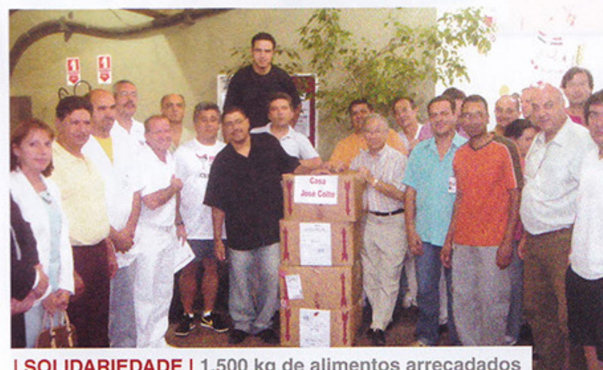
I SOLIDARIEDADE | 1.500 kg de alimentos arrecadados