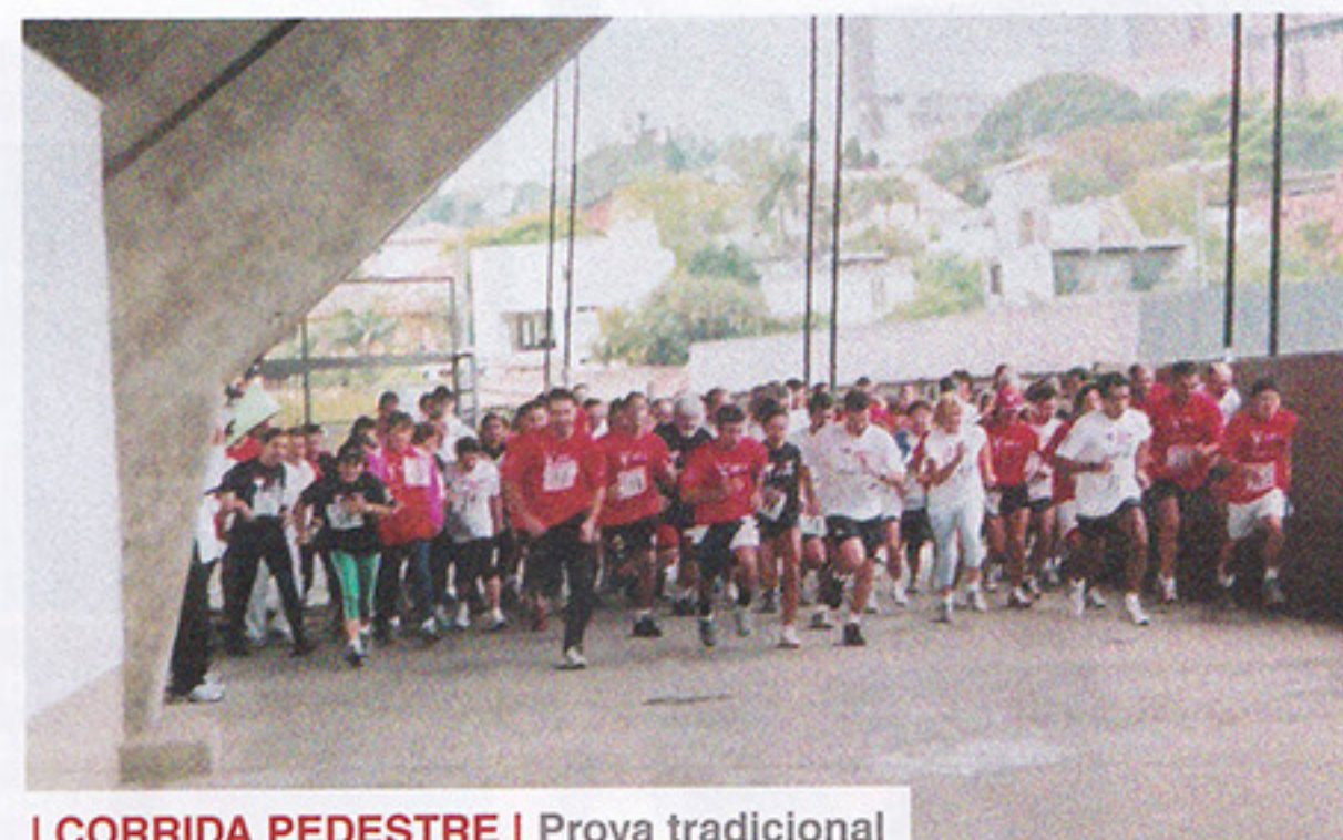
I CORRIDA PEDESTRE | Prova tradicional