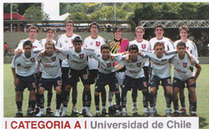
I CATEGORIA A | Universidad de Chile