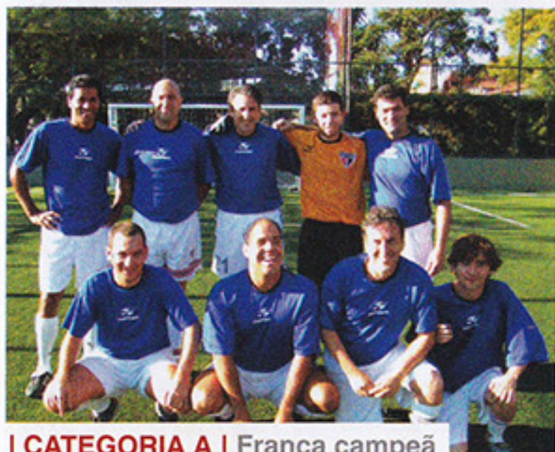
I CATEGORIA A | França campeã