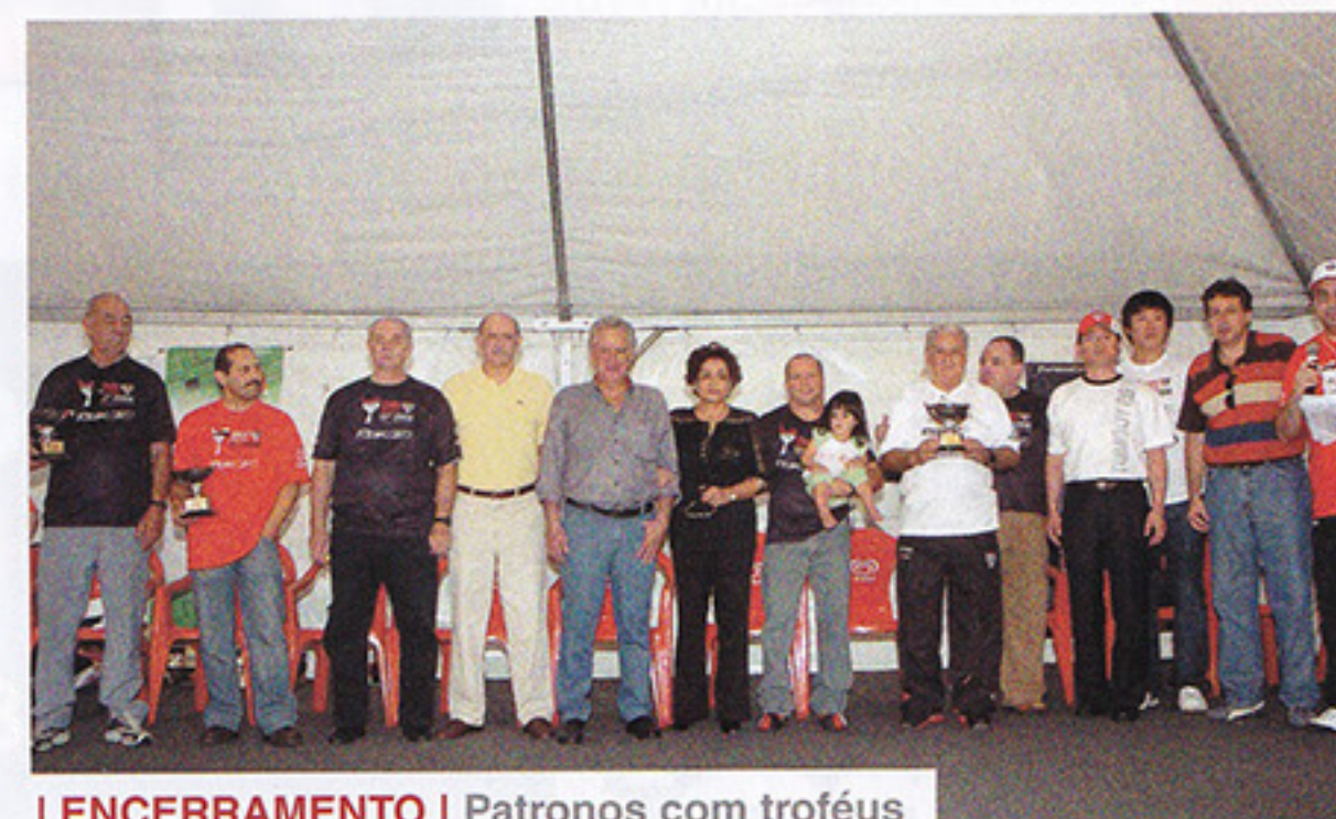
I ENCERRAMENTO | Patronos com troféus