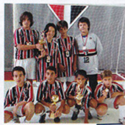
I MIRIM | México

A decisão do interno menores aconteceu no mês de novembro e teve como campeões o Para-