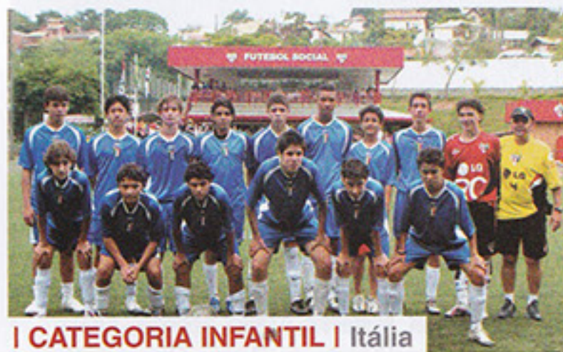
I CATEGORIA INFANTIL | Itália