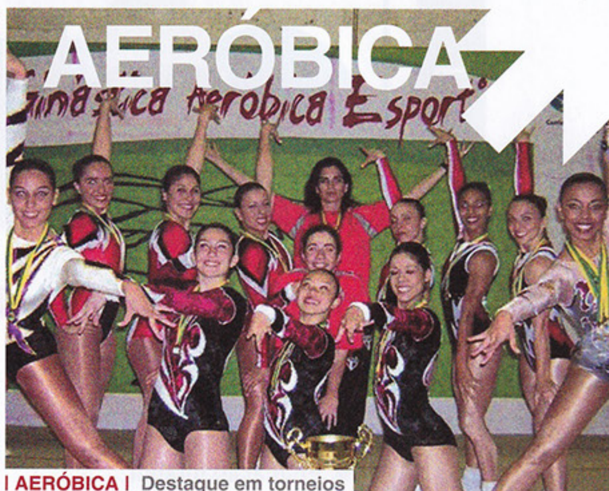
AERÓBICA | Destaque em torneios