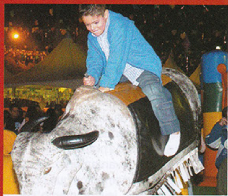
BRINCADEIRAS | Diversão para todos

Além dos shows, a festa ofereceu barracas de alimentação, bebidas e brincadeiras. A tradicional queima de fogos encerrou a festividade junina do tricolor.