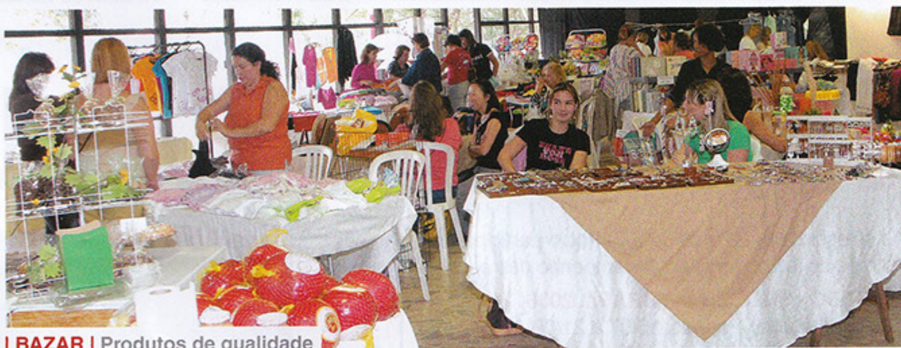
| BAZAR | Produtos de qualidade

Dias 7 e 8 de outubro, das 10 às 18 horas, acontecerá o Bazar da Primavera, no Mezanino Social, com entrada franca para sócios e convidados. No local, poderão ser encontradas bijuterias, moda feminina/infantil/masculina, artesanatos em madeira, biscoit, velas, sabonetes, chocolates e muito mais. Os expositores interessados em participar poderão se inscrever no DASP através dos telefones 3749-8208/8209.