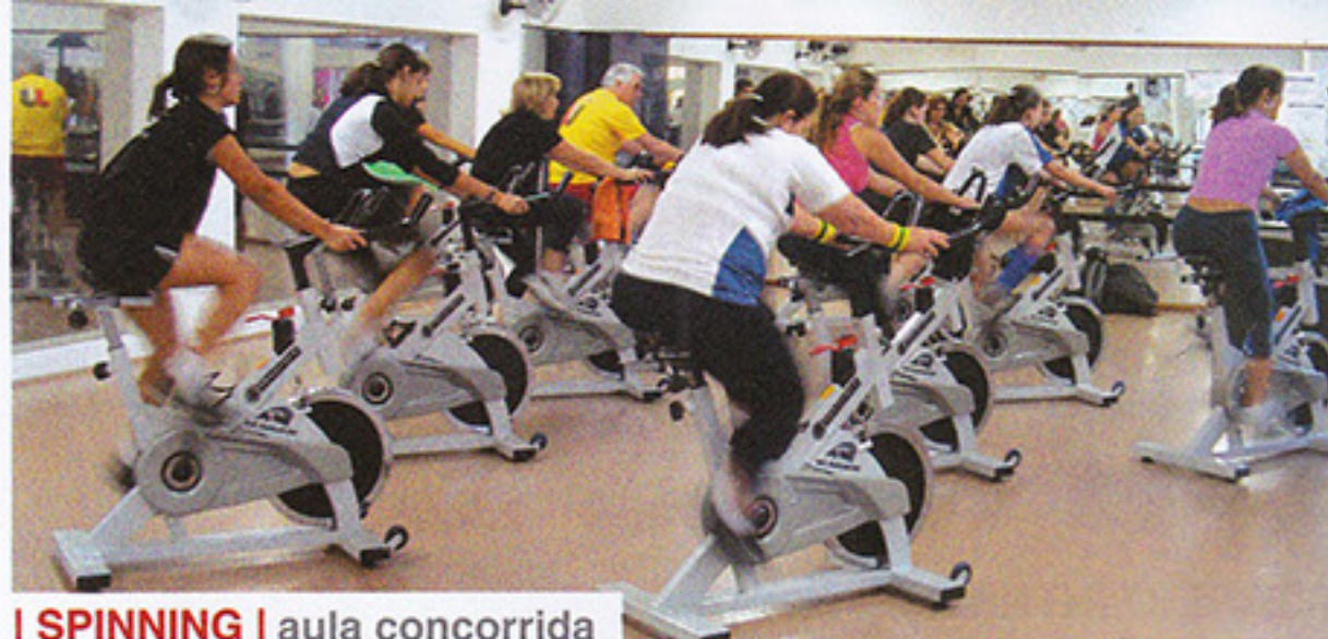
I SPINNING | aula concorrida

No mês de agosto inicia o Campeonato Interno de Futebol Society para as categorias adulto, feminino e menores. Os jogos acontecerão às terças-feiras, sábados e domingos. Informações na Central de Atendimento.