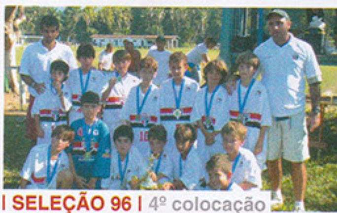
I SELEÇÃO 96 | 4º colocação