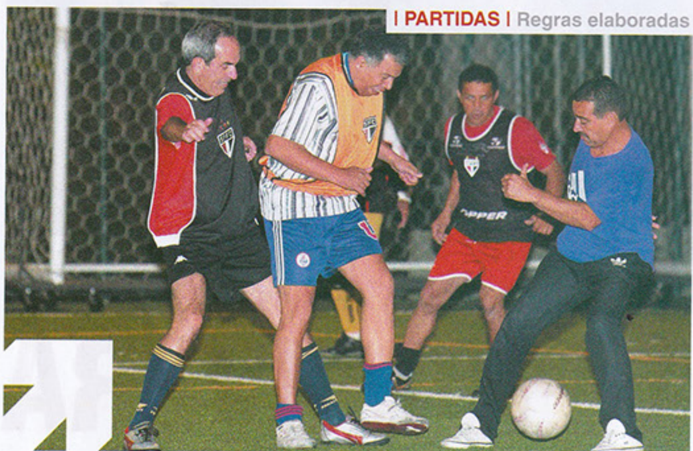
I PARTIDAS | Regras elaboradas

Há vinte anos atrás, quando o campo social ainda era de terra, os sócios do tricolor se reuniam para um bate bola sem compromisso, mas como uma forma de lazer. Surgia, então, o Rachão do Futebol Social.