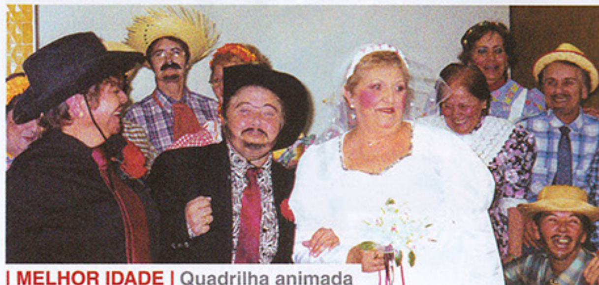
I MELHOR IDADE | Quadrilha animada