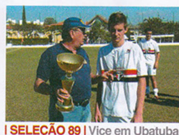
I SELEÇÃO 89 | Vice em Ubatuba