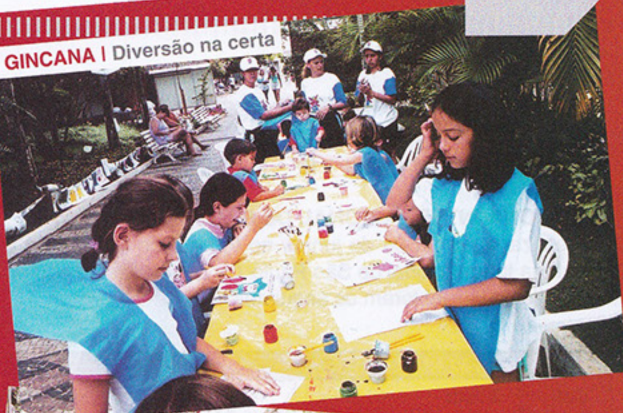
I GINCANA | Diversão na certa

O encerramento, no dia 8 de outubro, terá uma programação animada com shows musicais no portão 7, premiação da corrida pedestre, divulgação e premiação dos vencedores da Gincana, além da famosa macarronada, a partir das 12h30, no portão 9 e ginásio 4.