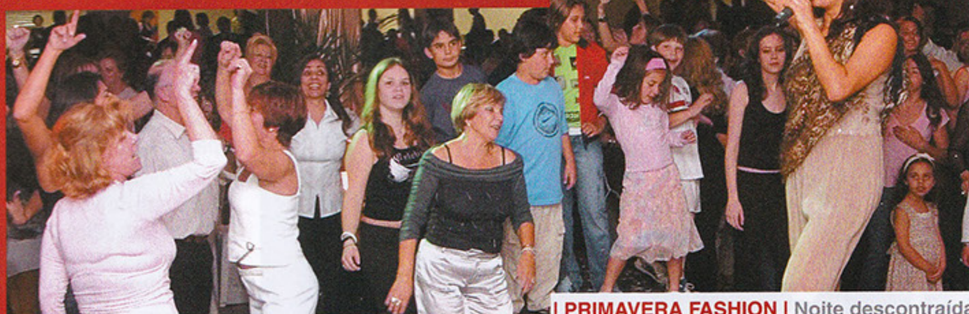
| PRIMAVERA FASHION | Noite descontraída

Imperdível será a edição deste ano do Primavera Fashion, dia 16 de setembro, no Salão de Festas. Dentre as atrações estão desfile de modas com as últimas tendências do momento, show e sorteio de prêmios. Informações no DASP ou através do telefone 3749-8208.