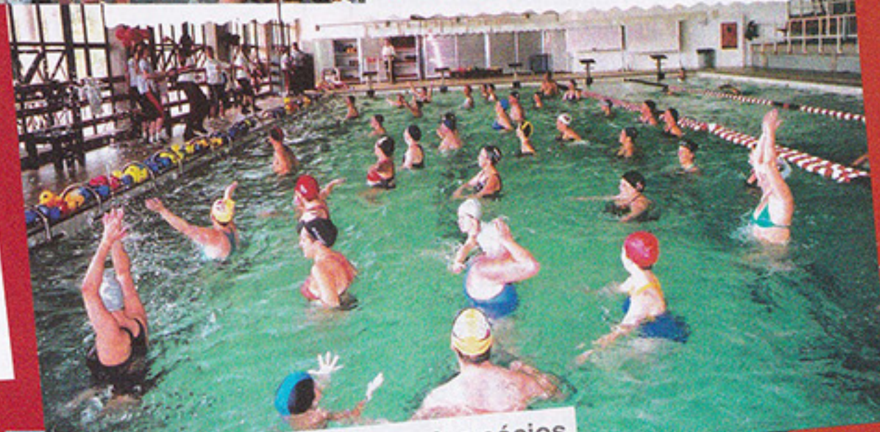
I COMPETIÇÕES | Presença dos sócios