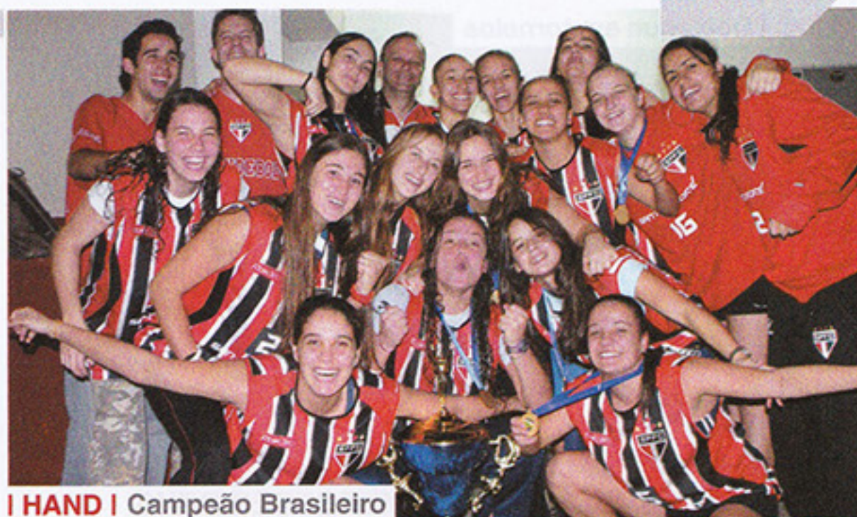
HAND | Campeão Brasileiro