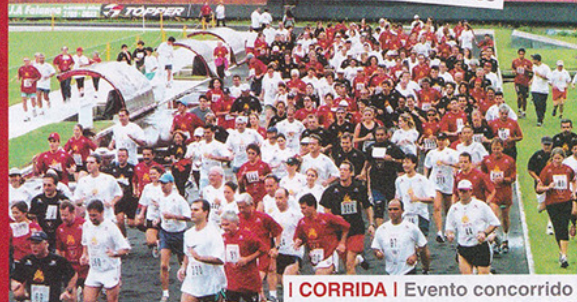
I CORRIDA | Evento concorrido