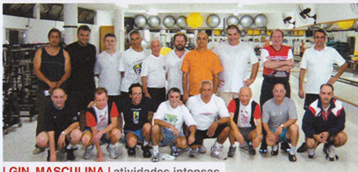
GIN. MASCULINA | atividades intensas

Outra novidade no setor é a realização das avaliações físicas, fundamentais na prescrição e controle das rotinas de treinamento individualizado. As avaliações são feitas pelos profissionais do Fitness que adotaram um modelo de acompanhamento ainda mais ágil e eficiente. São prescritas rotinas em função das necessidades e restrições de cada aluno, proporcionando aos associados melhor qualidade de vida. Faça parte do Fitness! Informações 3749-8233.