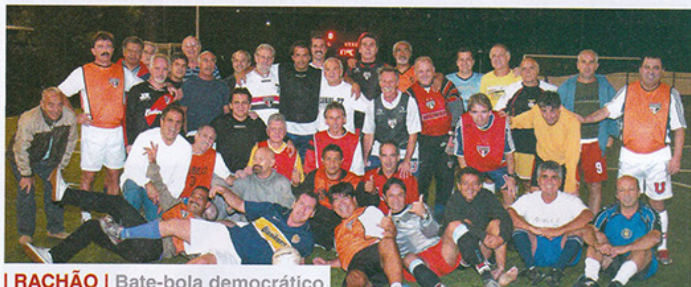
I RACHÃO | Bate-bola democrático