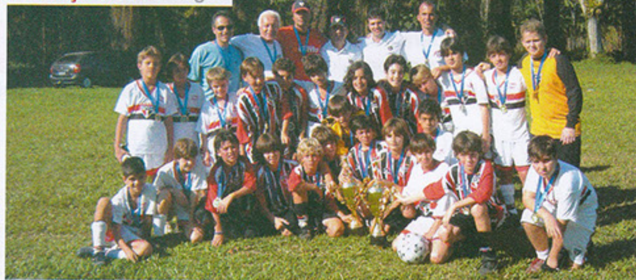
I SELEÇÃO 95 | 3º lugar

Resultado: SPFC 89 sagrou-se Vice-Campeão