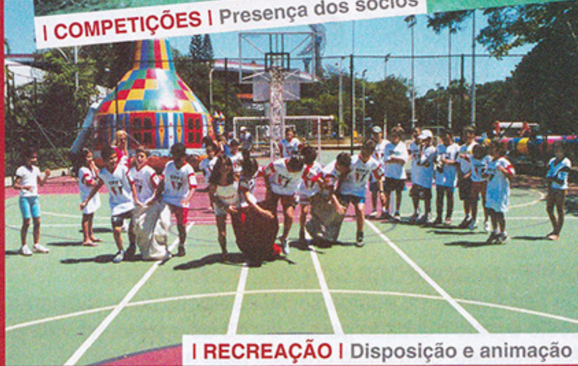
I RECREAÇÃO | Disposição e animação