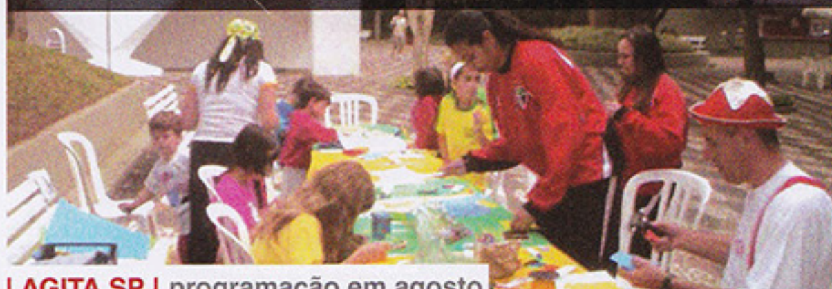
AGITA SP | programação em agosto

Divirta-se no clube aos finais de semana participando das atividades recreativas do Programa Agita São Paulo. Informações na Central de Atendimento Único e através do site www.saopaulofc.net