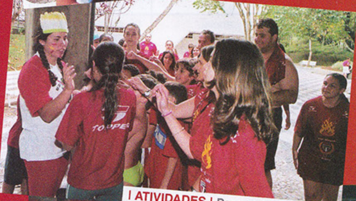
I ATIVIDADES | Para todas as idades