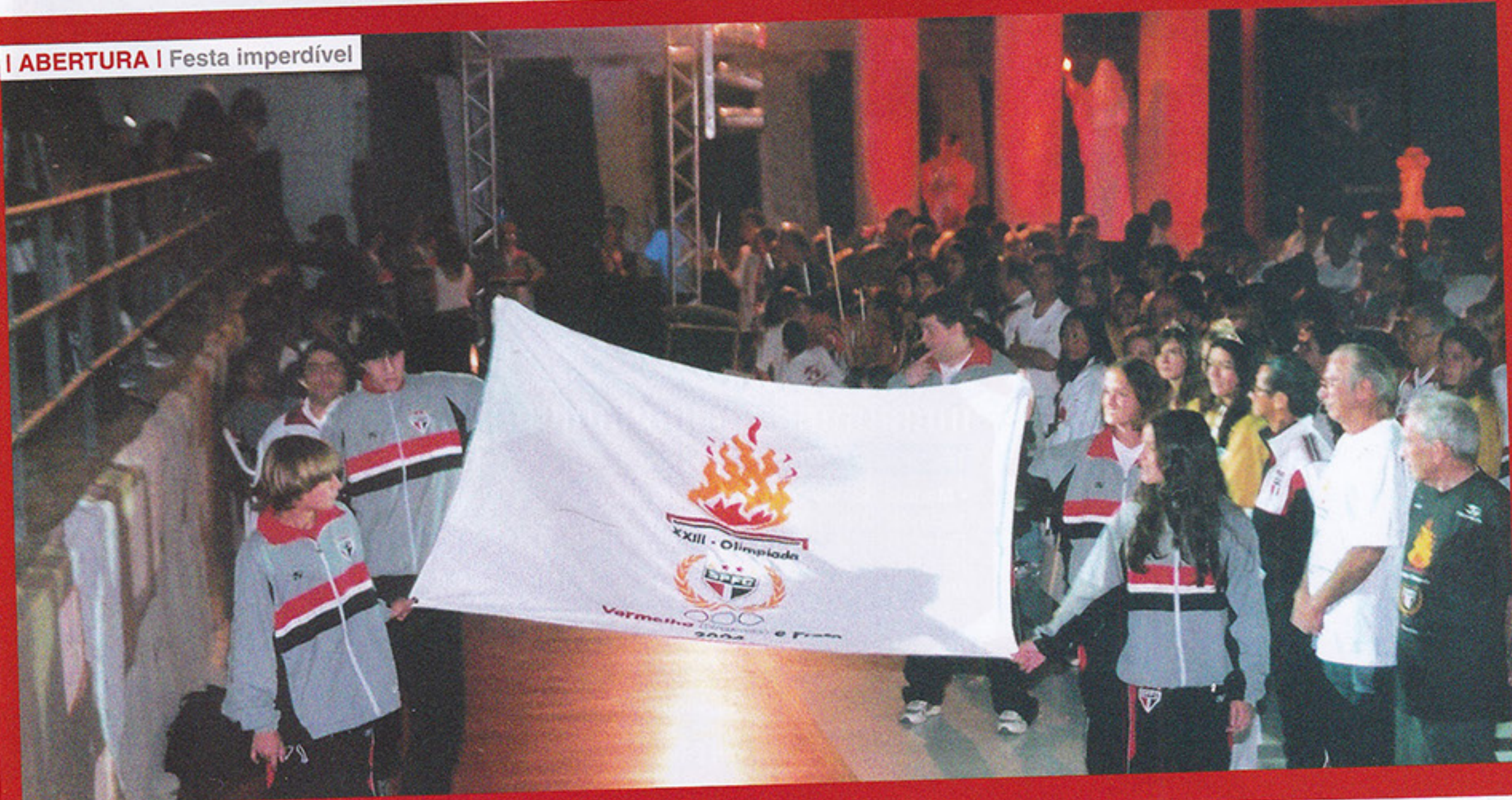
ABERTURA | Festa imperdível