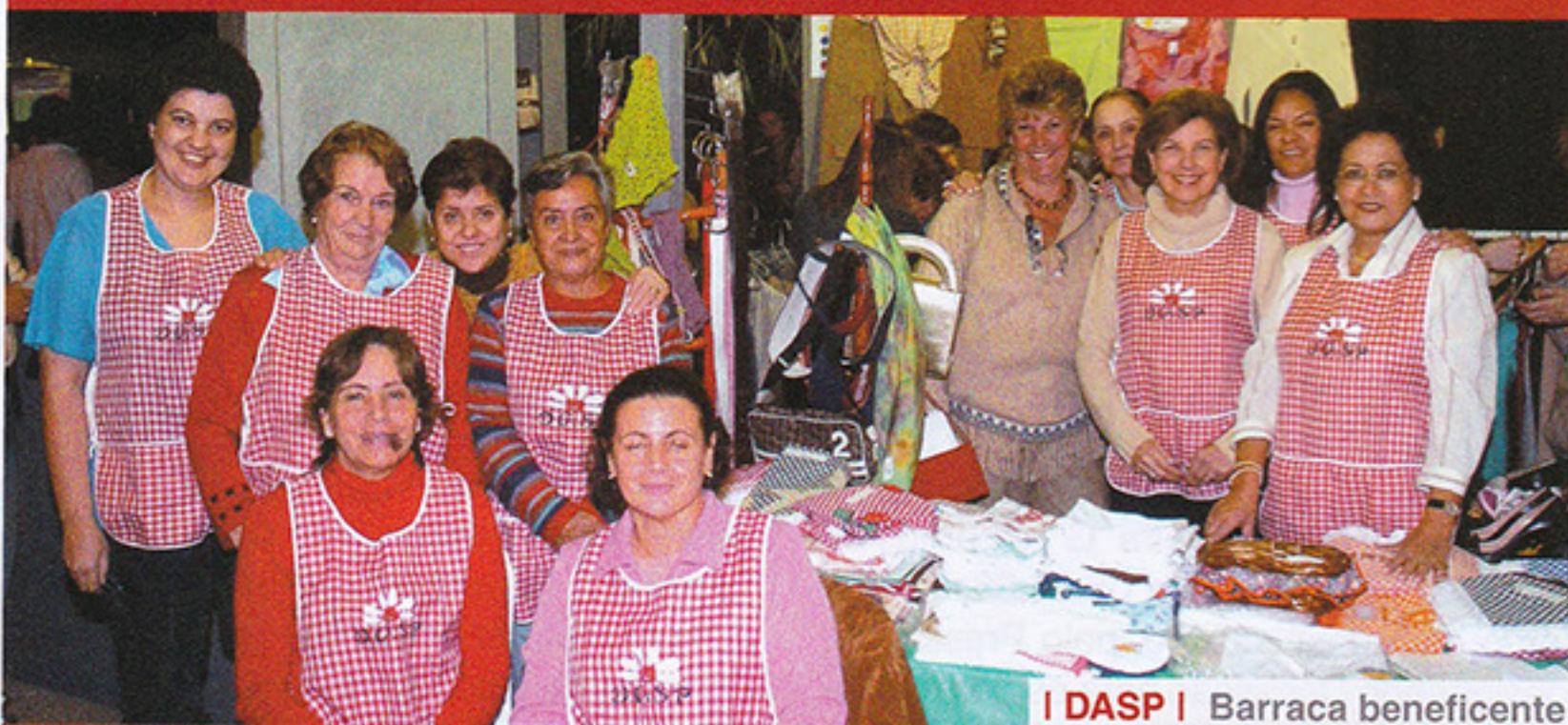
DASP | Barraca beneficente

Nos dias 23, 24 e 25 de junho o São Paulo Futebol Clube realizou a sua tradicional Festa Junina com uma programação especial para os três dias do evento.