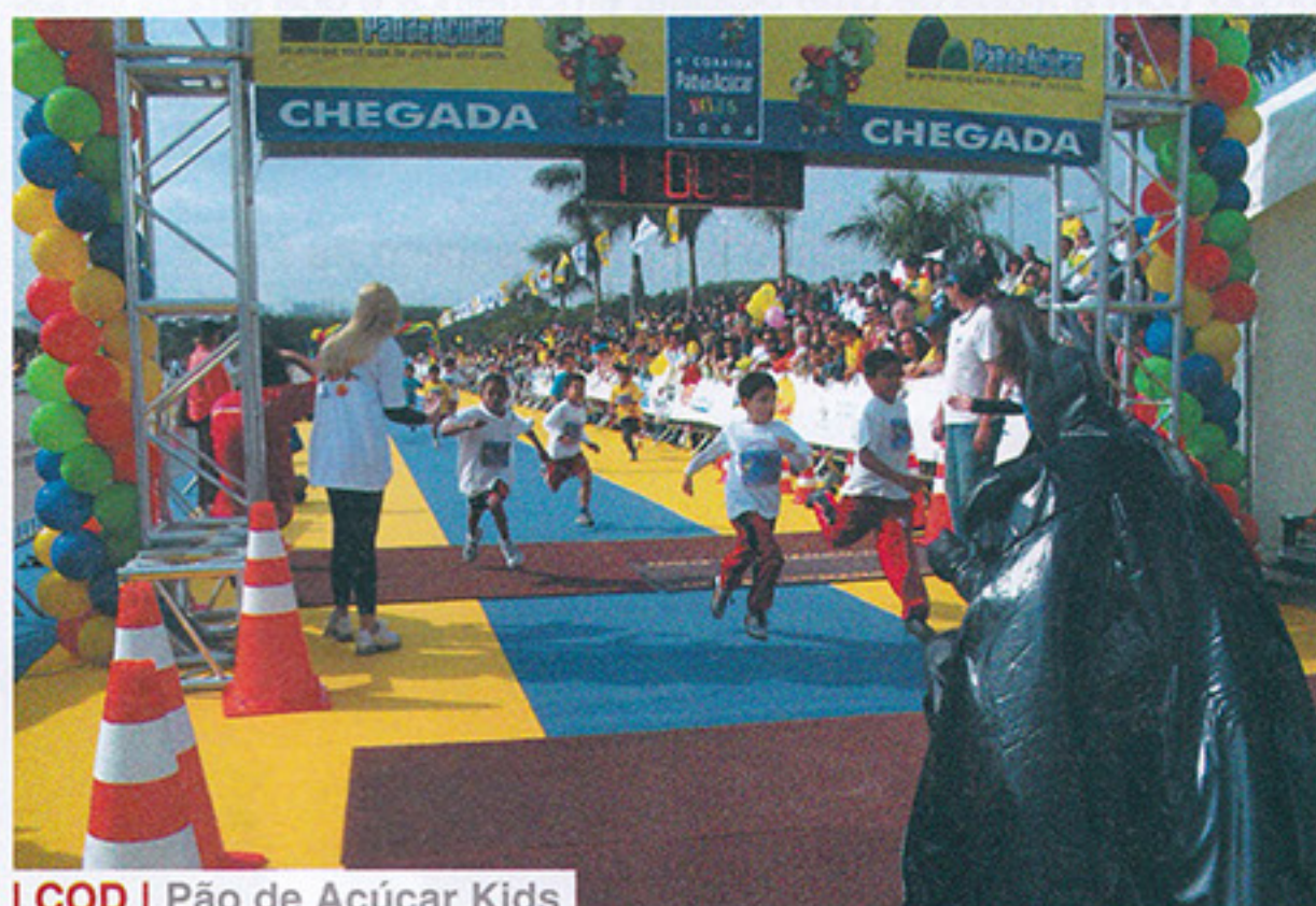
I COD | Pão de Açúcar Kids

No dia 03 de junho, 108 associados de 04 a 12 anos, participaram da 4ª Corrida Pão de Açúcar Kids, no Parque Villa Lobos. Os pequenos fizeram um percurso de 30 a 500 metros.