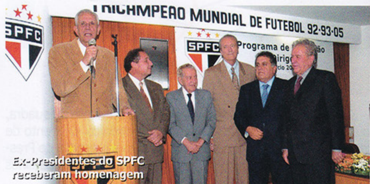
Ex-Presidentes do SPFC receberam homenagem