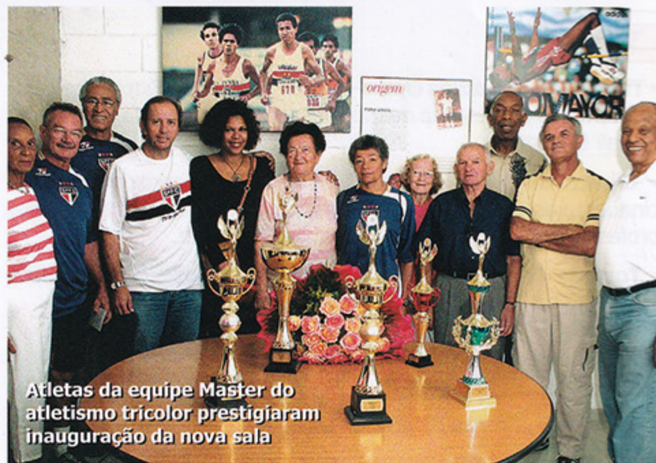
Atletas da equipe Master do atletismo tricolor prestigiaram inauguração da nova sala

No dia 04 de março, a seção do Atletismo inaugurou sua nova sala que leva o nome de Adhemar Ferreira da Silva, em homenagem ao ex-atleta são-paulino, responsável pelas duas estrelas amarelas do símbolo que representam seus recordes mundiais e olímpicos nas Olimpíadas de Helsinque, em 52, e nos Jogos Pan-americanos do México, em 55.