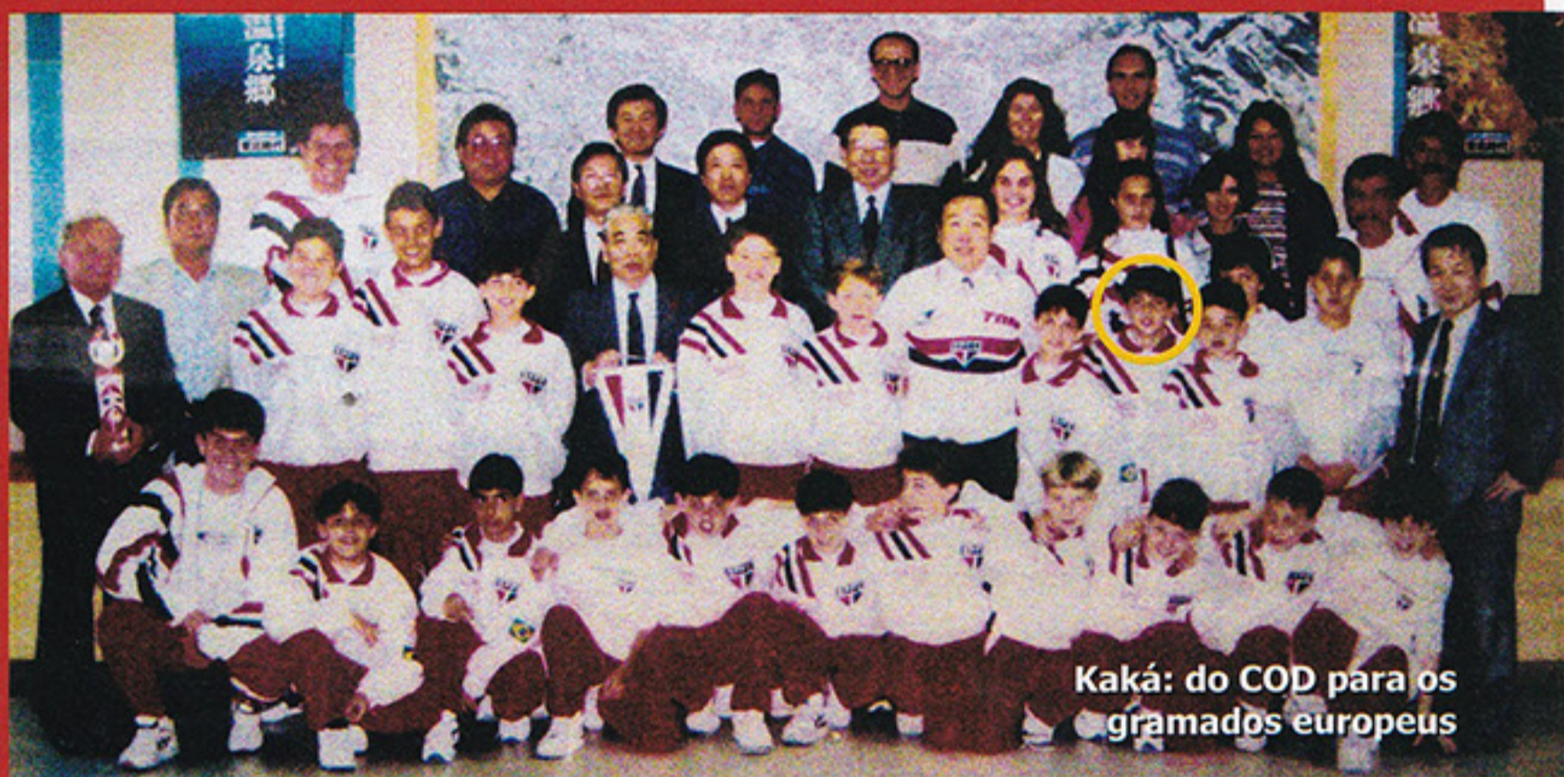
Kaká: do COD para os gramados europeus

esportiva da criança. "Quando fui aluna, fiz judô, natação, atletismo até definir que o que eu queria mesmo era a ginástica", disse.