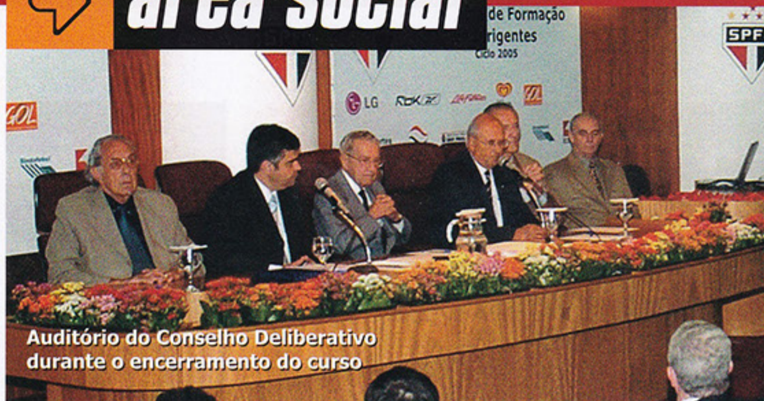
Auditório do Conselho Deliberativo durante o encerramento do curso