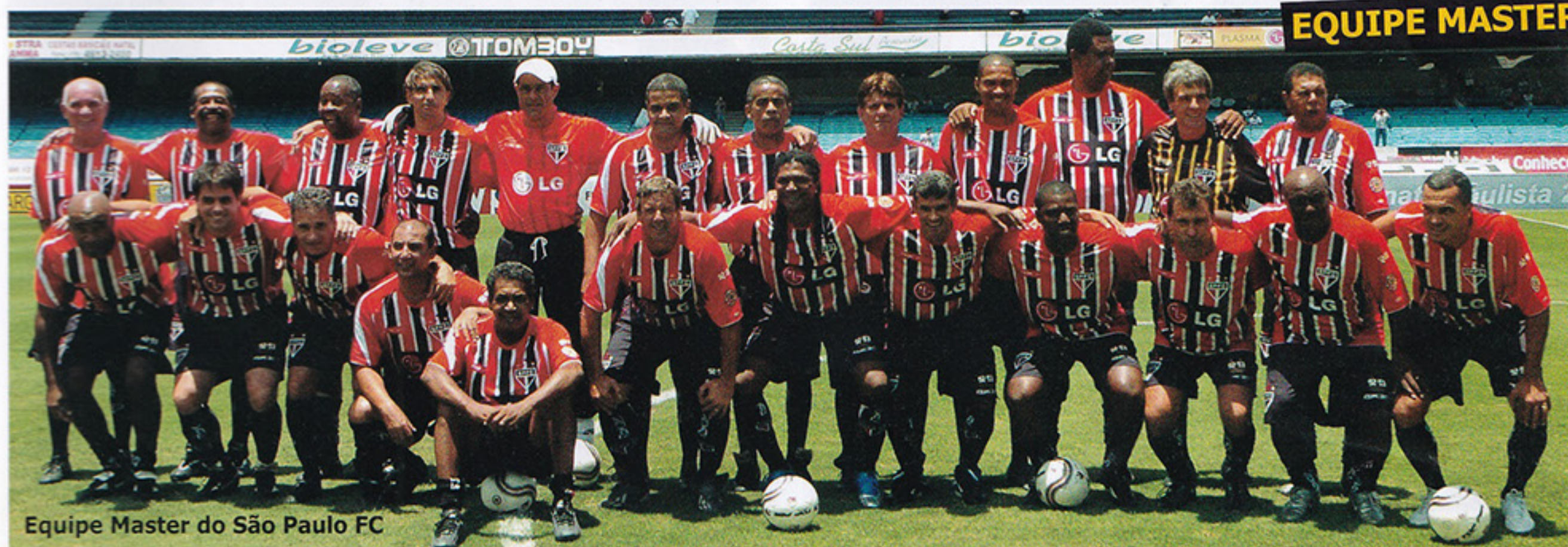
Equipe Master do São Paulo FC