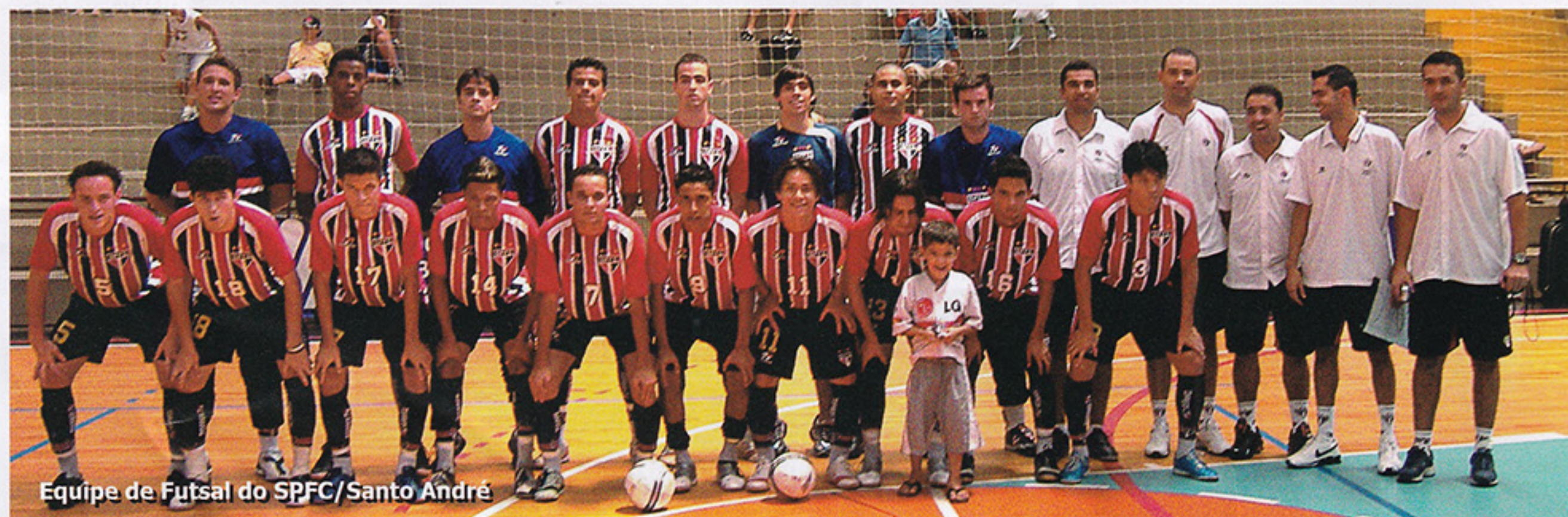
Equipe de Futsal do SPFC/Santo André