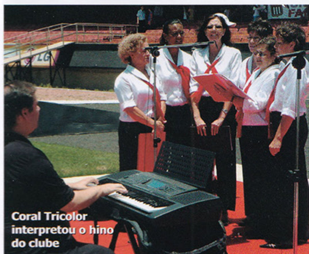
Coral Tricolor interpretou o hino do clube