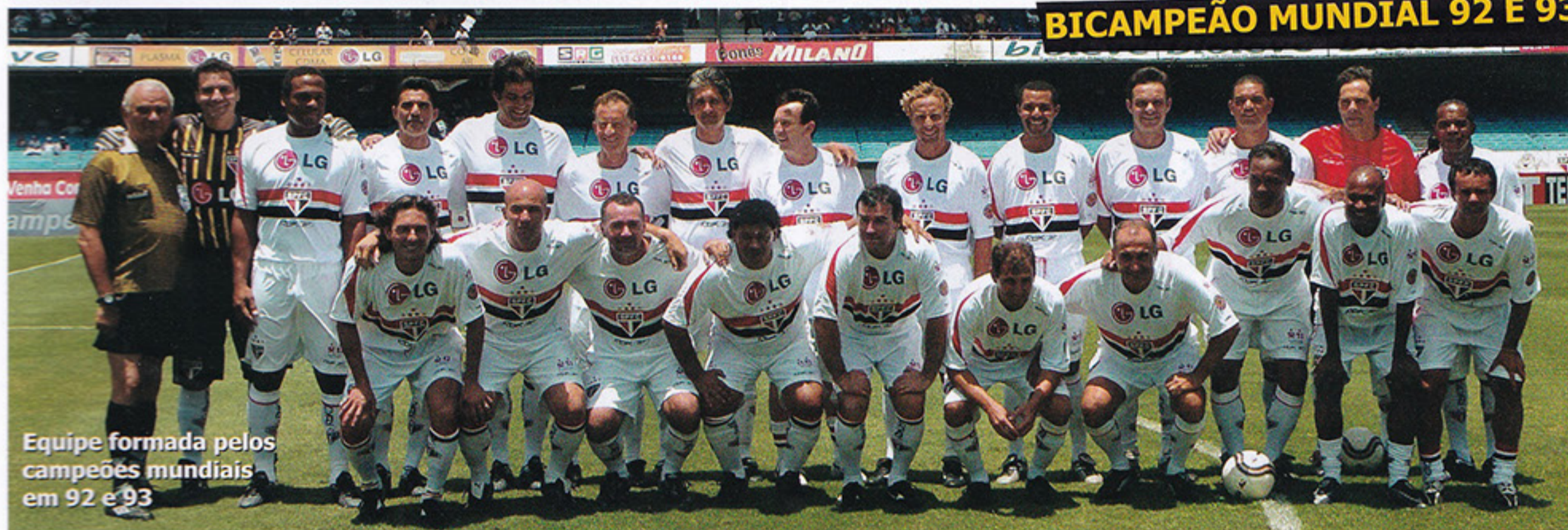
Equipe formada pelos campeões mundiais em 92 e 93

Foi uma grande festa em homenagem ao mais querido do Brasil!