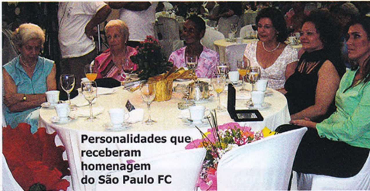
Personalidades que receberam homenagem do São Paulo FC