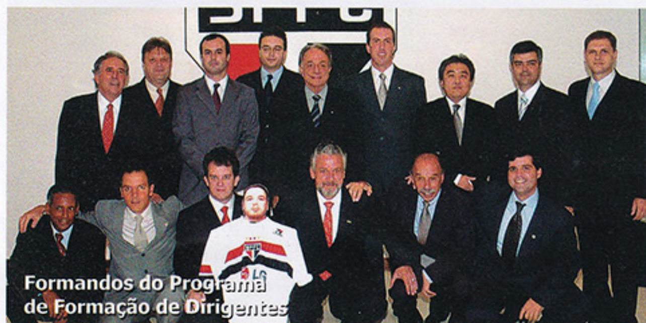
Formandos do Programa de Formação de Dirigentes