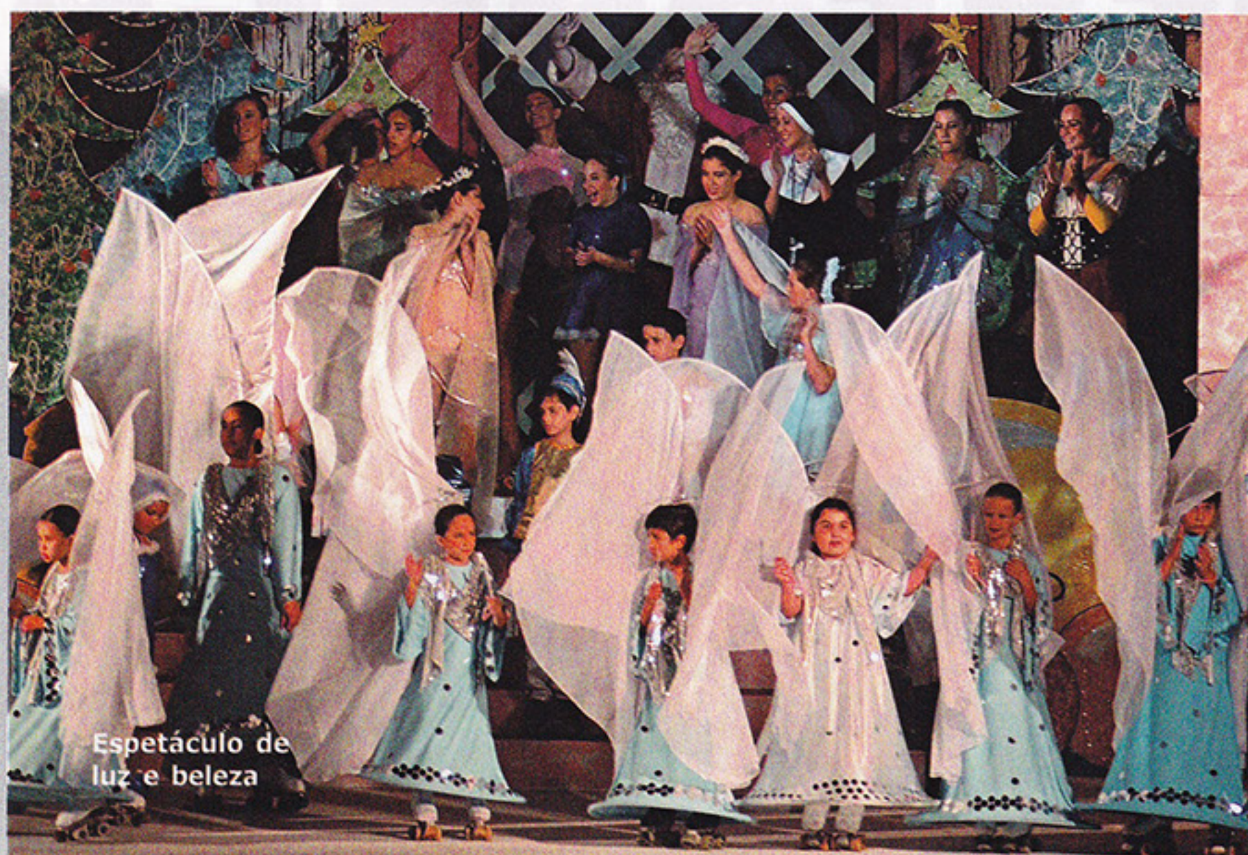
Espetáculo de luz e beleza

foi perfeita com coreografias bem ensaiadas e um belo figurino. Ao final do show a platéia aplaudiu de pé os patinadores são-paulinos. Os brinquedos arrecadados foram doados a instituições.