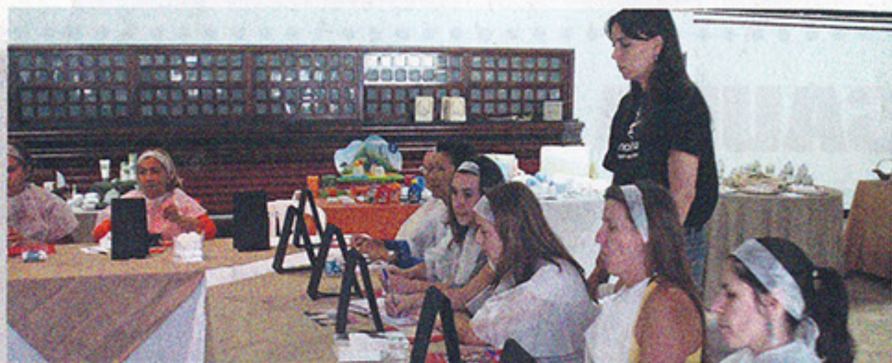
Oficina da Beleza Natura – 22 e 23 de setembro