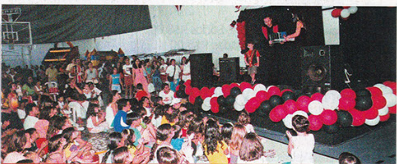
Dia das Crianças – 12 de outubro