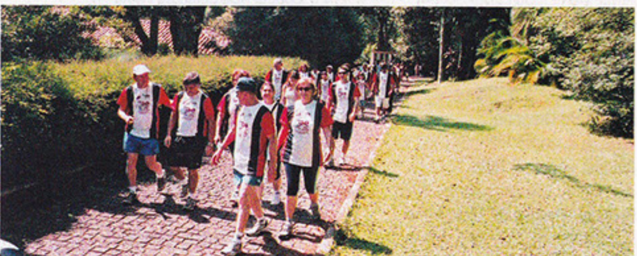
Pico do Jaraguá – 05 de novembro

OUTROS EVENTOS Peça Infantil Vovô – 19 de novembro / Encerramento das Voluntárias do DASP – 01 de dezembro / Bazar Beneficente de Natal – 10 e 11 de dezembro / II Exposição de Artes Óleo e Tapeçaria do SPFC – 07 a 10 de novembro / Festa Alemã – 19 de novembro