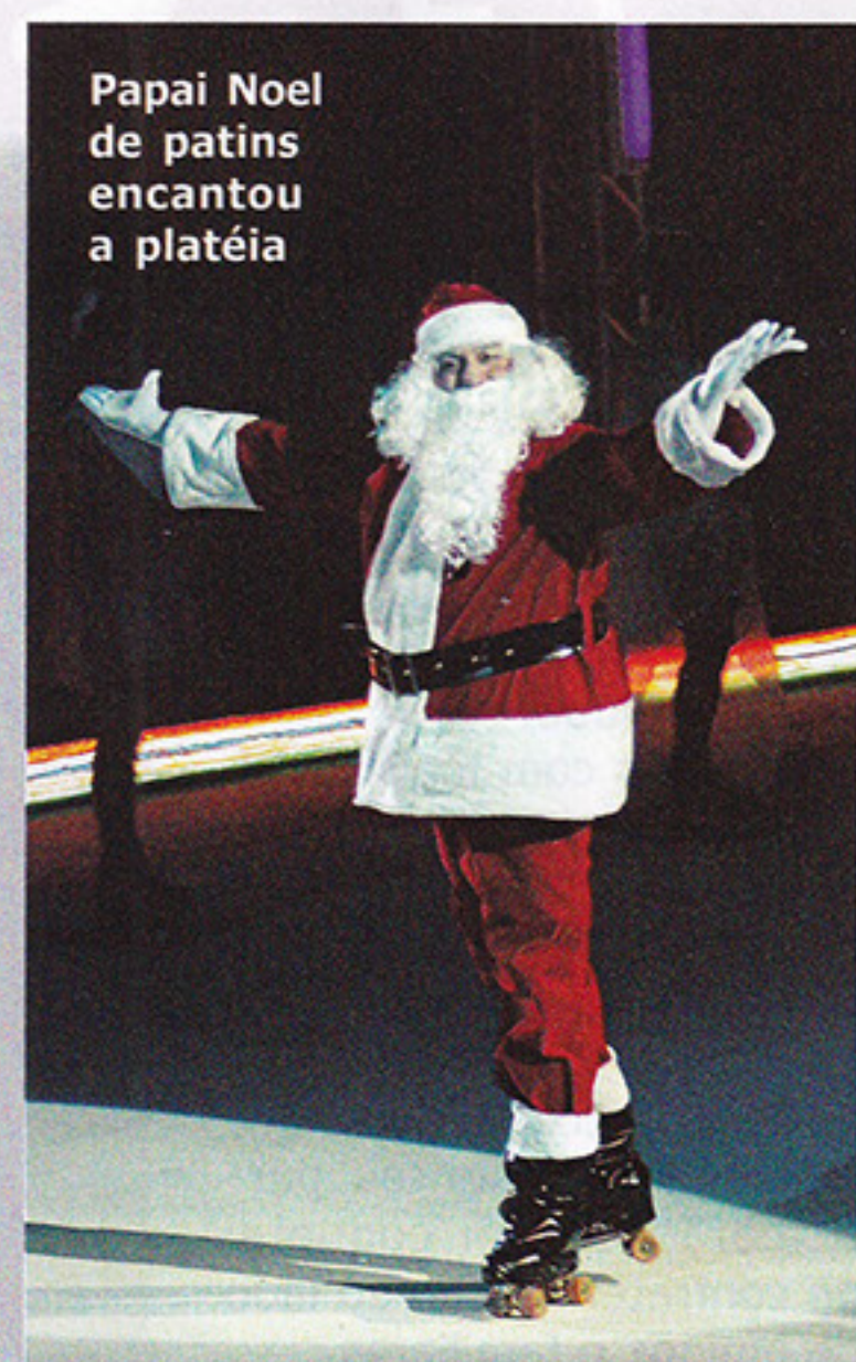
Papai Noel de patins encantou a platéia