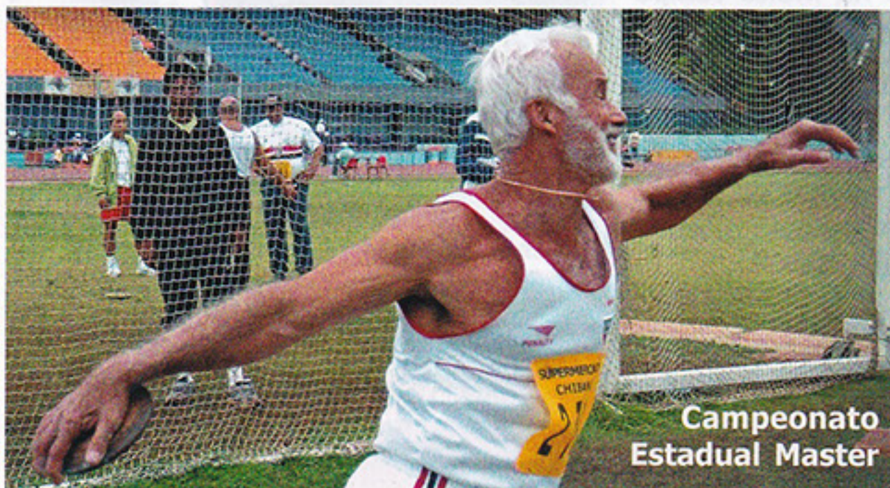
Campeonato Estadual Máster