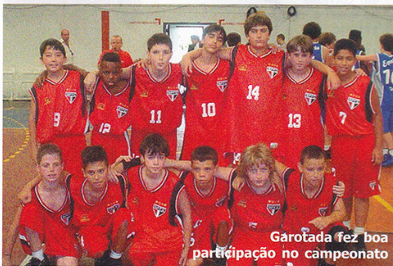
Garotada fez boa participação no campeonato