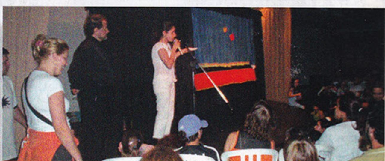
Peça Infantil Circus – 08 de outubro