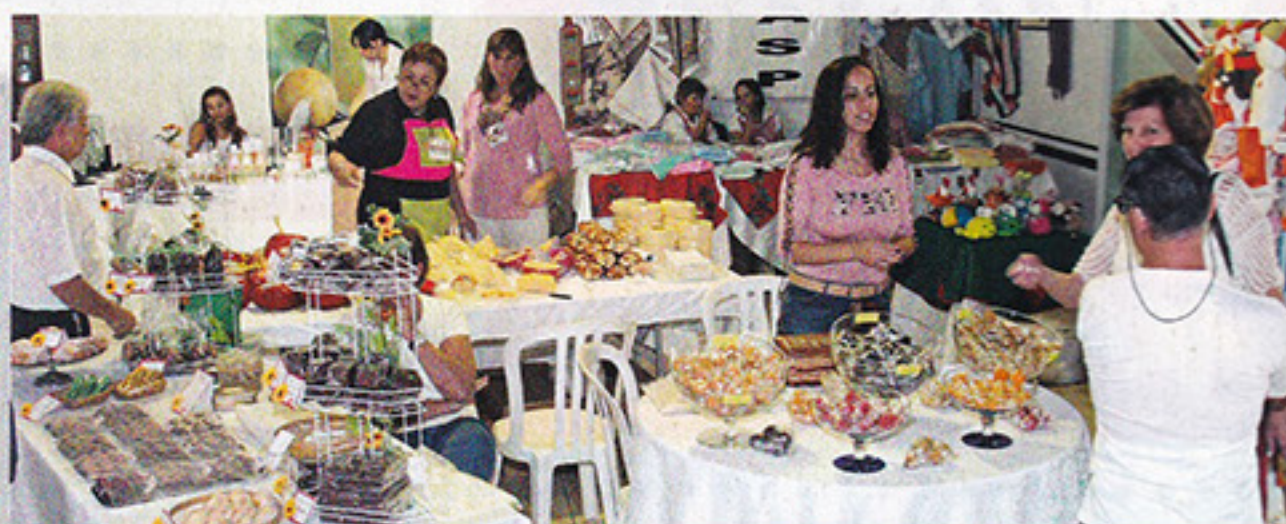
Bazar da Primavera – 24 e 25 de setembro