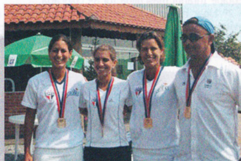
Tenistas recebem premiação