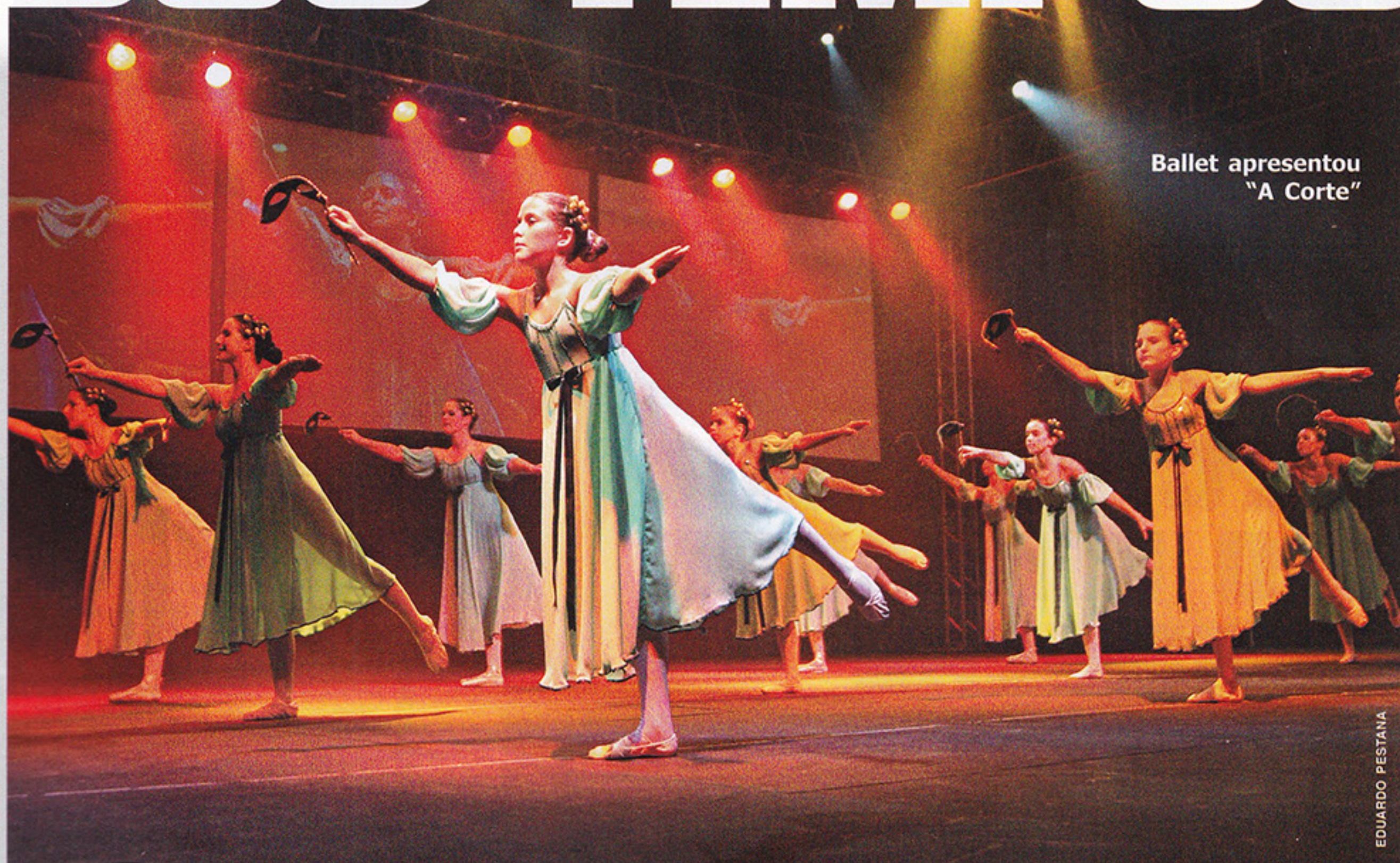
Ballet apresentou "A Corte"