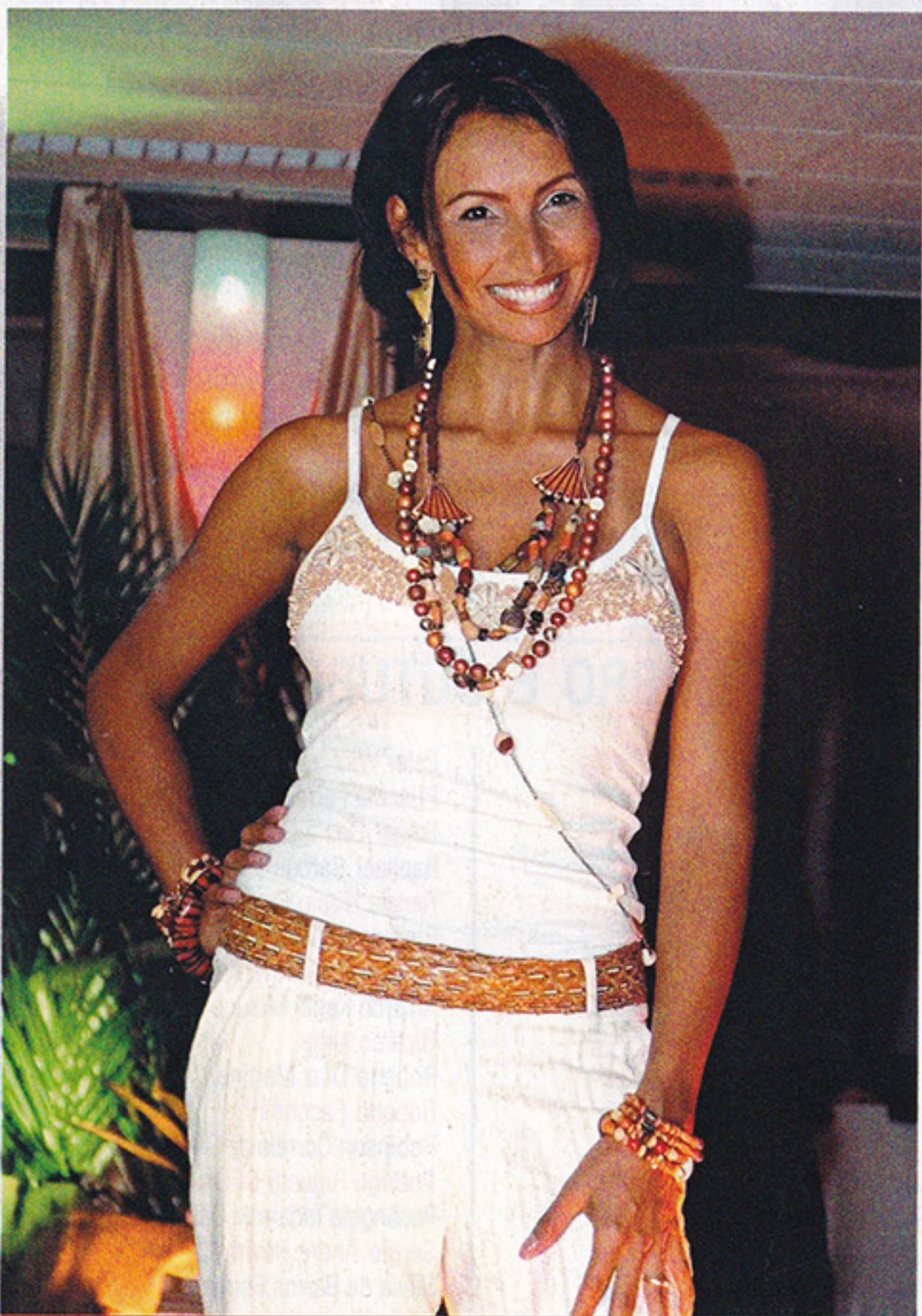
III Primavera Fashion – 15 de outubro