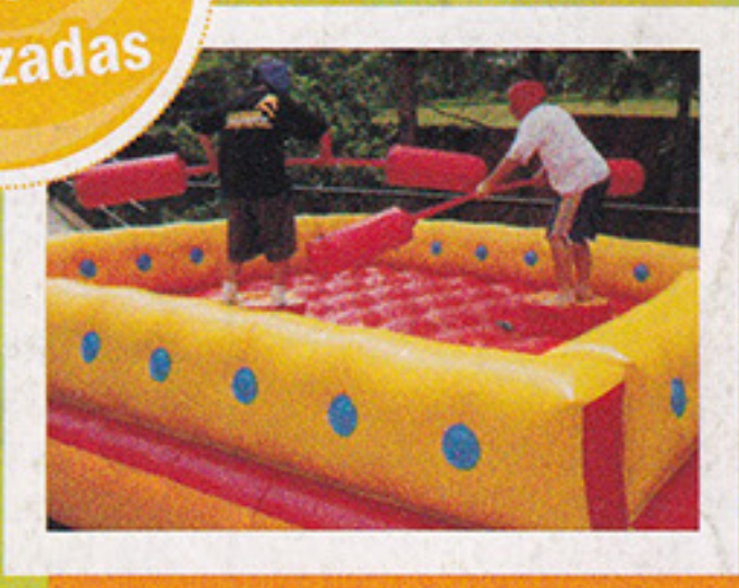
Luta de Cotonete