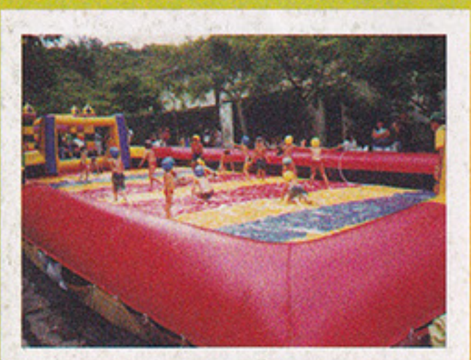
Futebol de Sabão