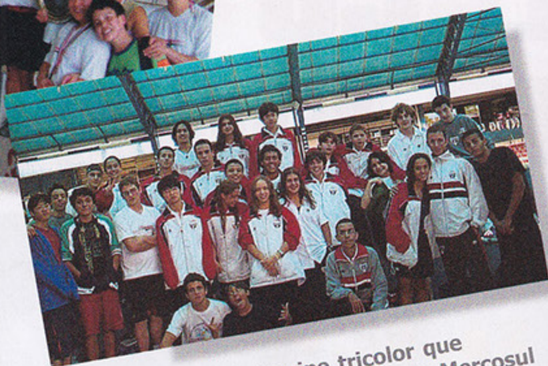
Equipe tricolor que brilhou na Copa Mercosul