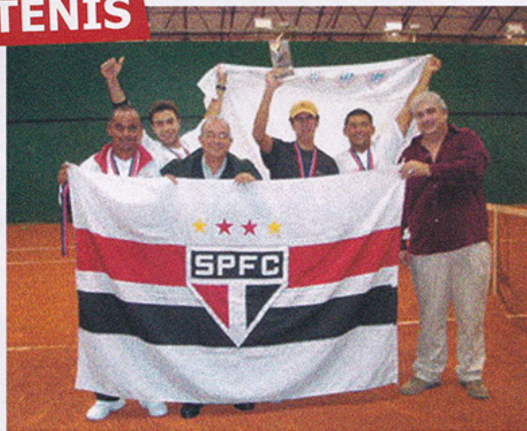
FEDERAÇÃO PAULISTA DE TÊNIS