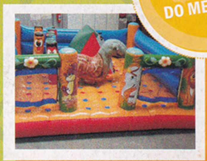
Kiddie Play Inflável