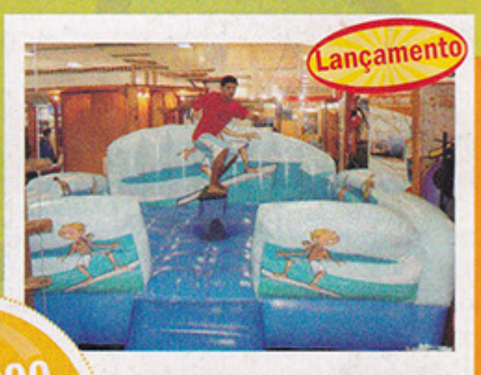
Surf Mecânico Wind