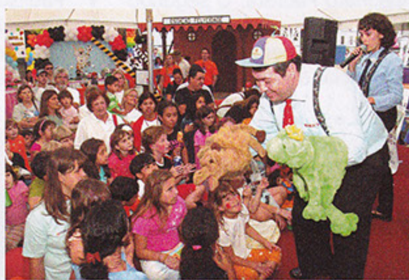
Baixinhos se esbaldaram no evento