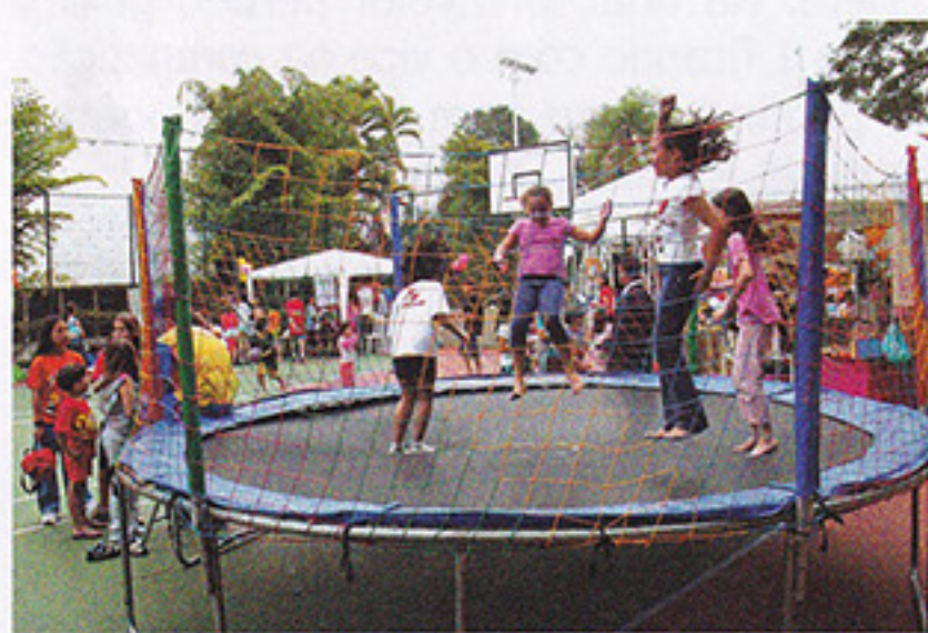
Cama elástica divertiu a criançada

A Silvana Araújo Eventos está localizada a Rua Dr. Luiz Migliano, 2050 – Conjunto 79 – Morumbi – Telefone: (11) 3773-8203.