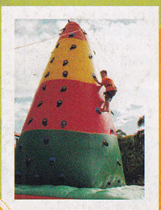
Montanha de Alpinismo

A MELHOR EM QUALIDADE, PONTUALIDADE E ATENDIMENTO