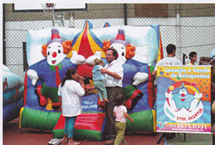
Brinquedos para todas as idades