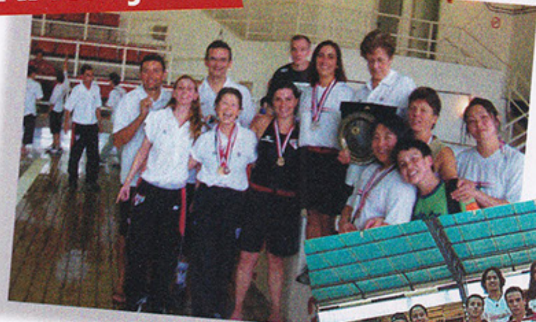
Nadadores ficaram em terceiro no Master