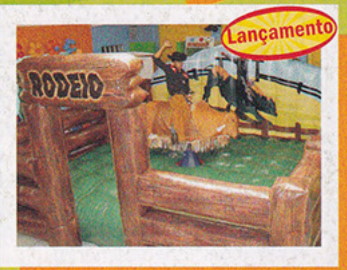
Touro Mecânico Rodeio