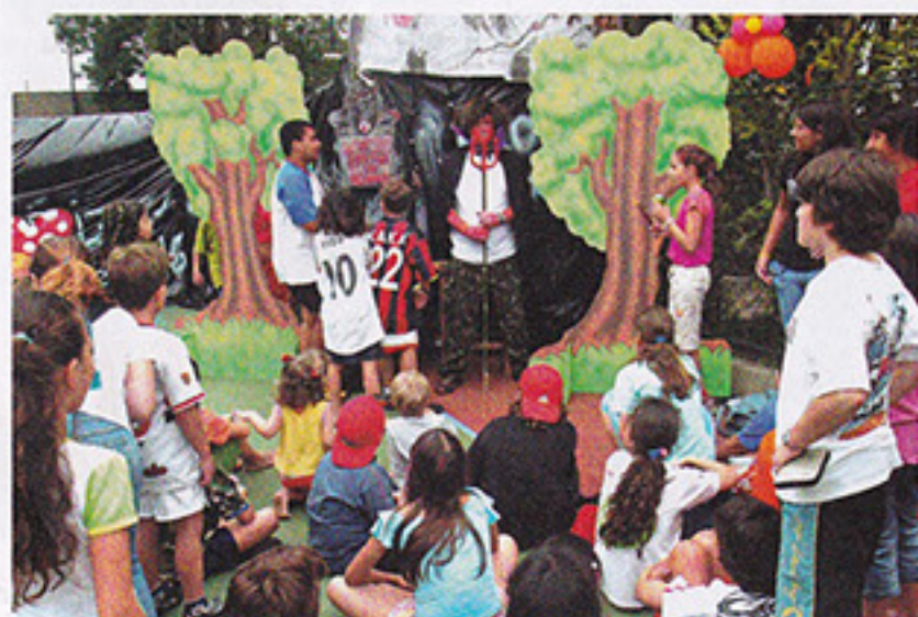
Sócios lotaram as quadras externas