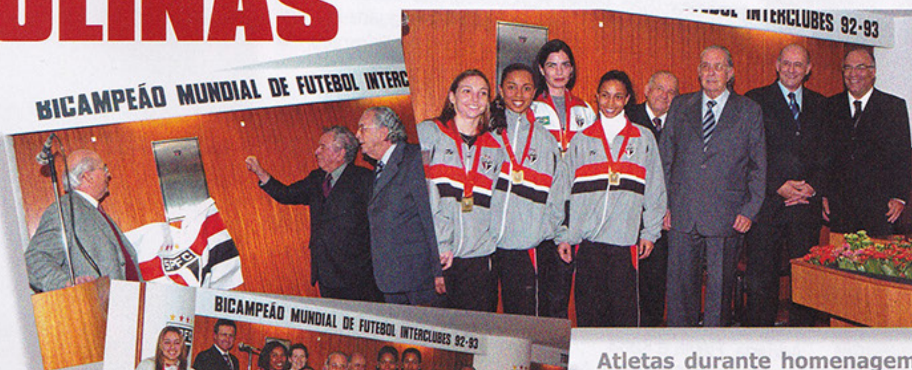
Atletas durante homenagem do Conselho Deliberativo