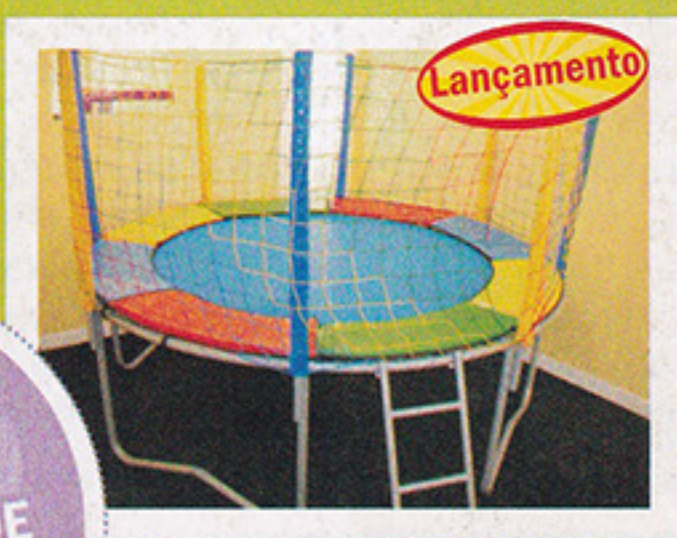
Cama Elástica 2,70m