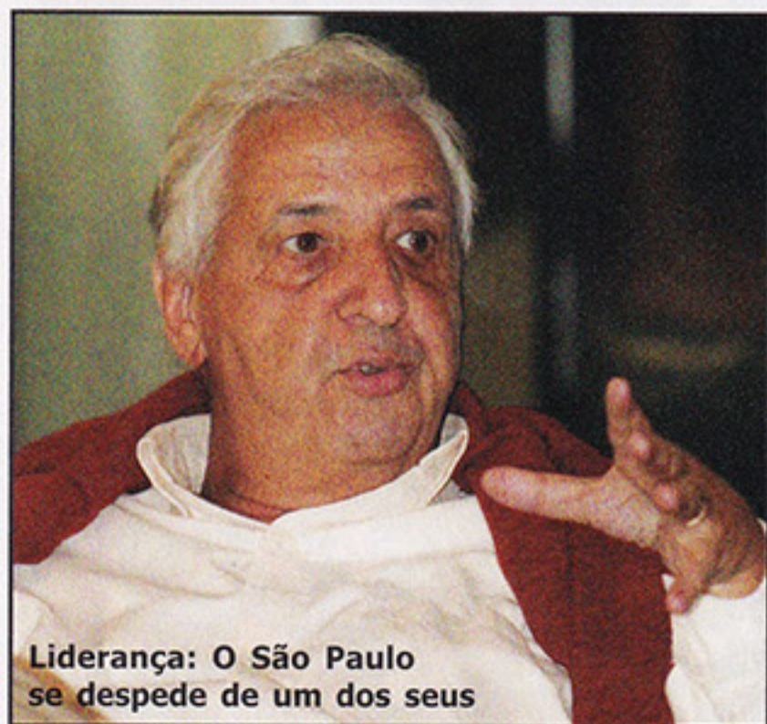
Liderança: O São Paulo se despede de um dos seus

19, no Cemitério do Morumbi, e teve a presença de familiares, amigos, diretores e conselheiros do São Paulo.