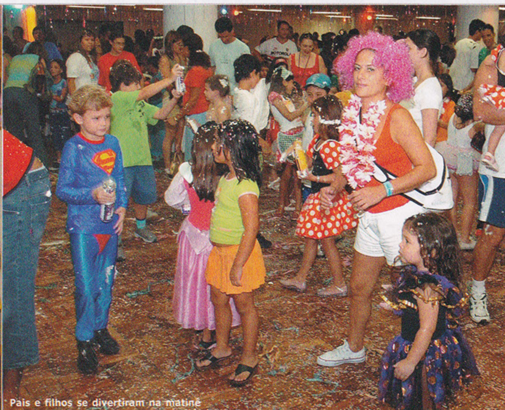
Pais e filhos se divertiram na matinê