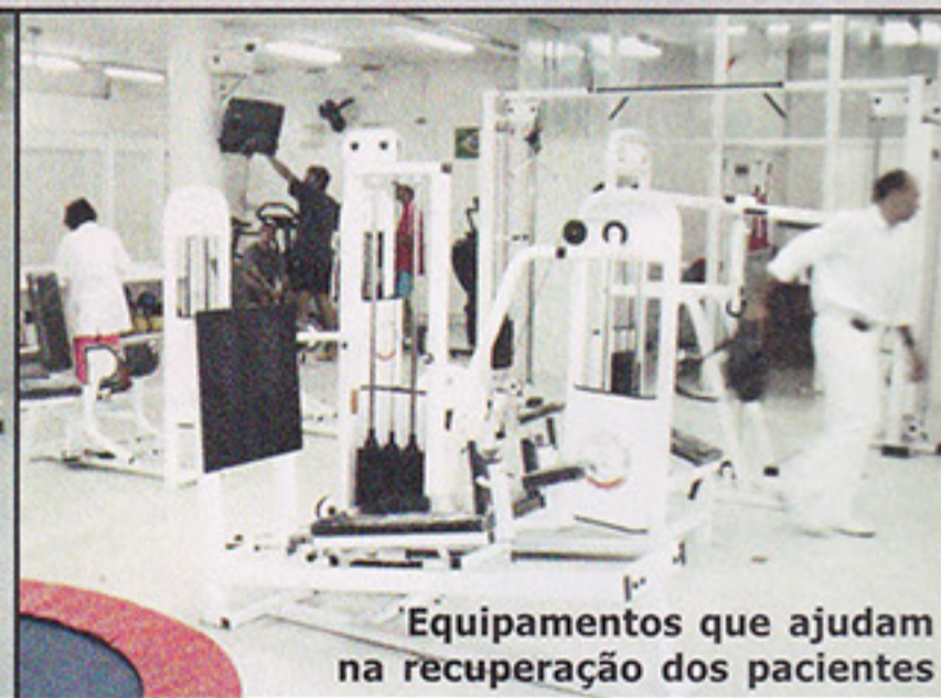
Equipamentos que ajudam na recuperação dos pacientes