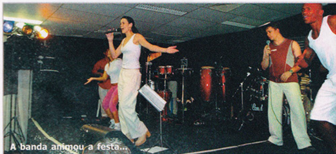
A banda animou a festa...

E na terça-feira à noite, os adultos se despediram do carnaval 2005, com a 'Folia Tropical'. O salão de festas recebeu uma decoração especial, com coqueiros e bananeiras, e a festa rolou até de madrugada. Em clima bem tropical, foi oferecida aos foliões uma mesa de frutas para compensar o desgaste do último dia de carnaval, que foi de muita animação.