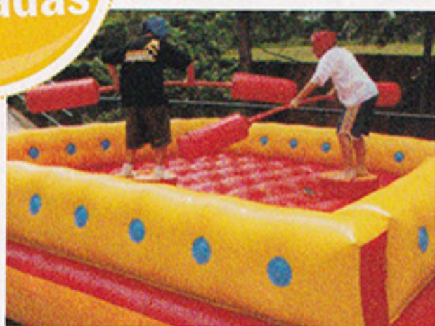
Luta de Cotonete