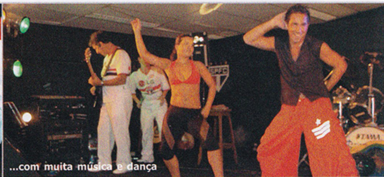
...com muita música e dança