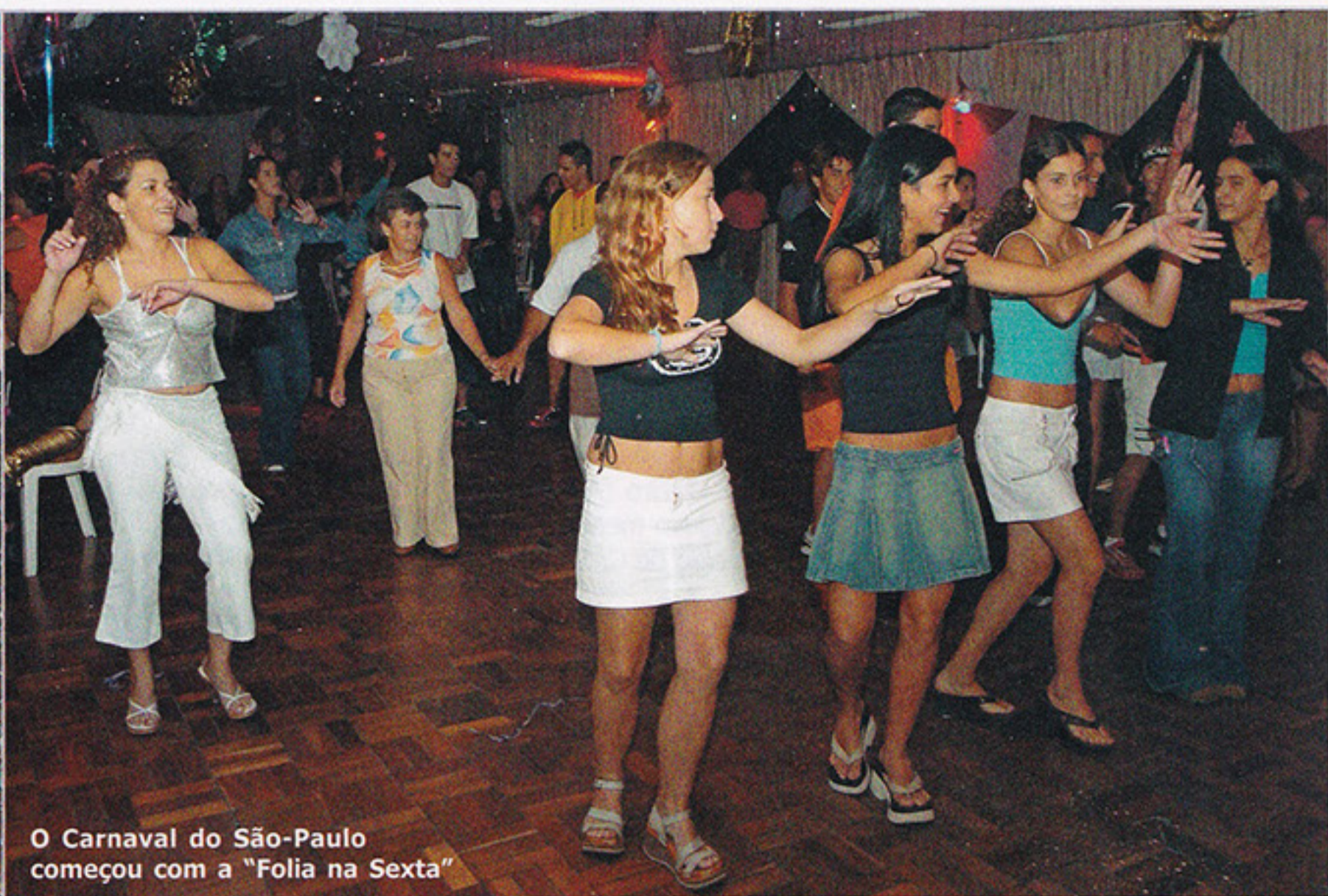
O Carnaval do São-Paulo começou com a "Folia na Sexta"