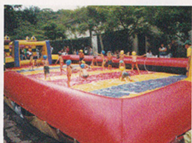
Futebol de Sabão