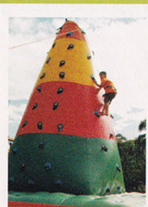
Montanha de Alpinismo

A MELHOR EM QUALIDADE, PONTUALIDADE E ATENDIMENTO