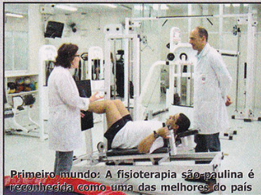
Primeiro mundo: A fisioterapia são-paulina é reconhecida como uma das melhores do país

Os associados do clube têm a disposição um centro de fisioterapia voltado para a reabilitação ortopédica e esportiva. O local dispõe de equipamentos modernos e conta com cinco fisioterapeutas, um ortopedista e quatro auxiliares de saúde. Os sócios podem usufruir a estrutura que oferece 50% de desconto no tratamento. A sala de Fisioterapia está localizada no saguão do portão principal do Estádio do Morumbi. Informações através dos telefones (11) 3749-8160 ou 3749-8162.