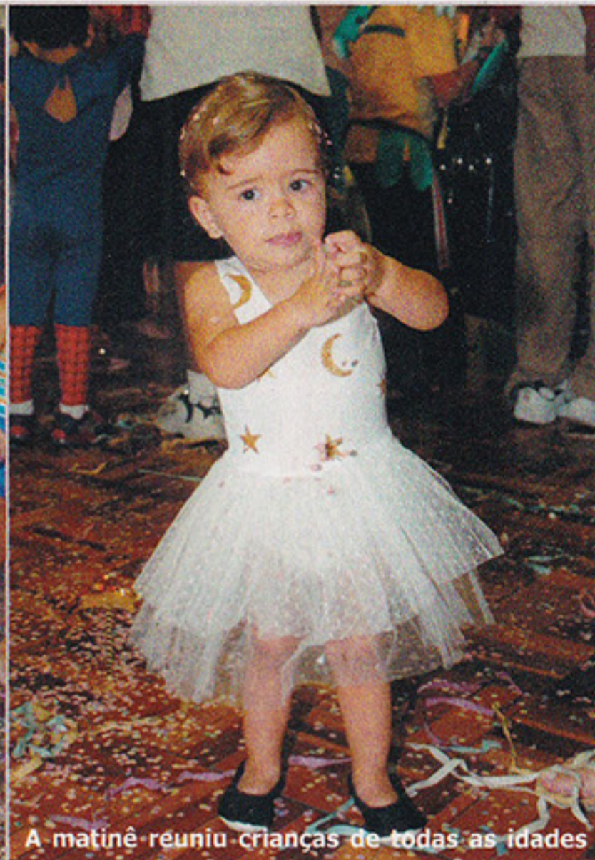
A matinê reuniu crianças de todas as idades