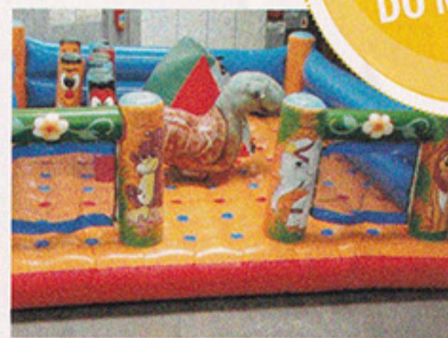
Kiddie Play Inflável