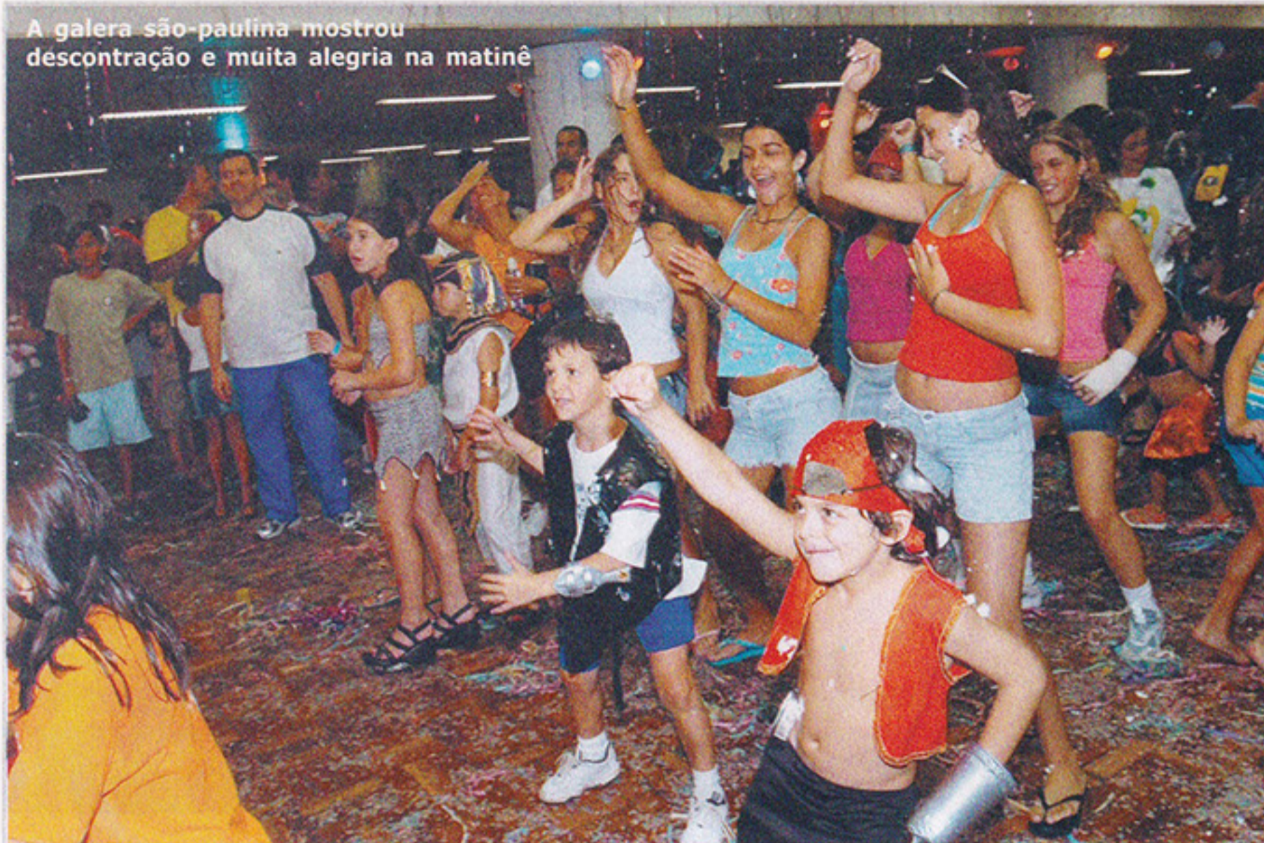
A galera são-paulina mostrou descontração e muita alegria na matinê