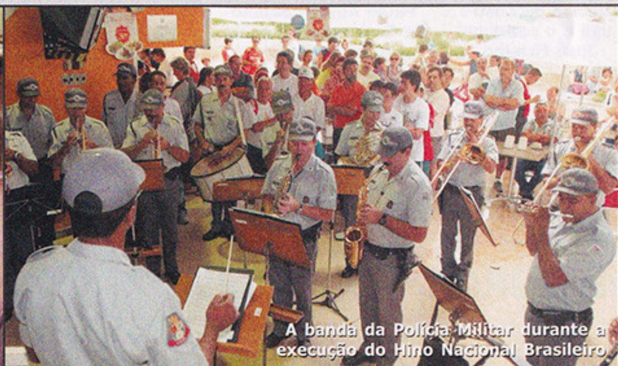
A banda da Polícia Militar durante a execução do Hino Nacional Brasileiro.