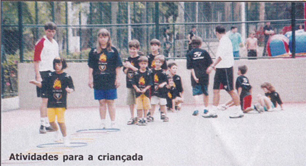
Atividades para a criançada