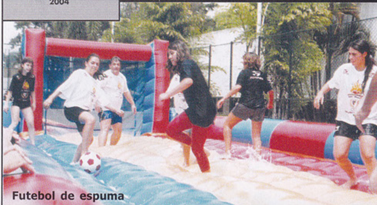
Futebol de espuma