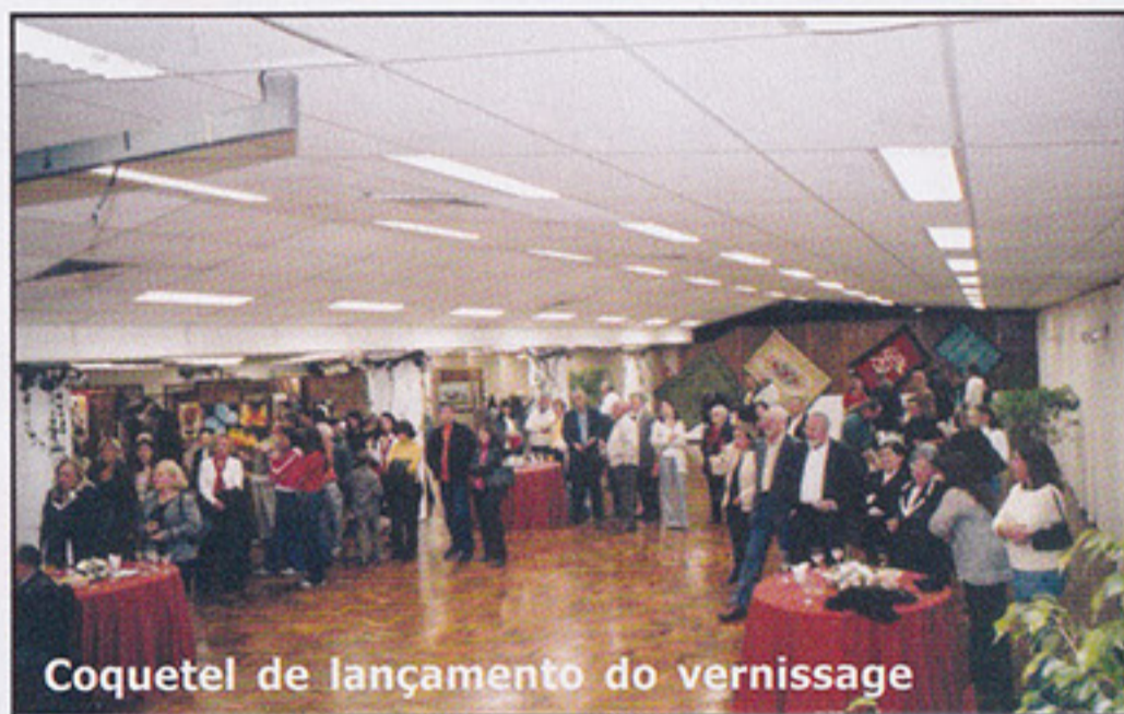
Coquetel de lançamento do vernissage