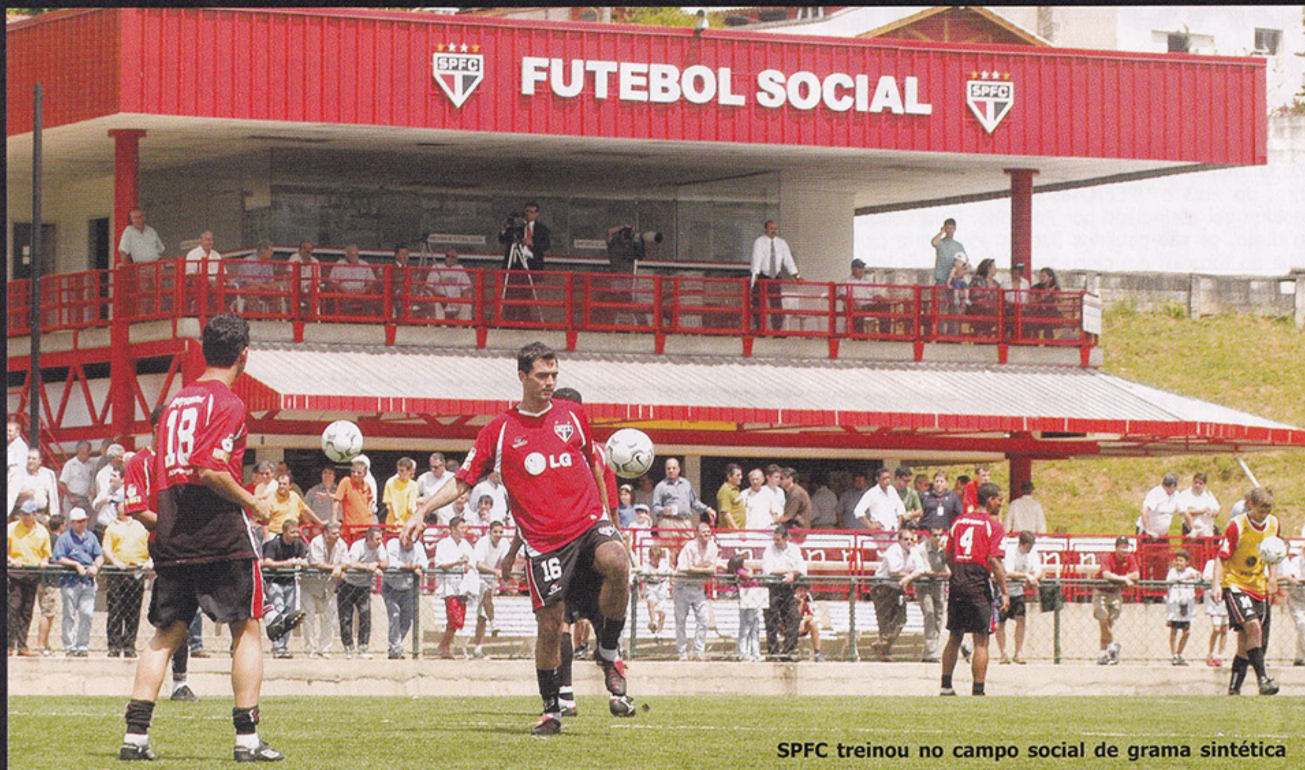
SPFC treinou no campo social de grama sintética

A inauguração oficial do campo de grama sintética, dia 05 de novembro, contou com a presença da equipe de futebol profissional do São Paulo FC que treinou no novo tapete instalado na área social. Dirigentes e associados do clube também prestigiaram o evento. O São Paulo é o primeiro clube brasileiro a utilizar este tipo de piso, muito comum na Europa. Instalado pela empresa Soccer Grass o campo sintético do Tricolor, que é o maior da América Latina, segue os padrões exigidos pela FIFA com medidas próximas ao do gramado do estádio do Morumbi. O espaço utiliza ainda a tecnologia denominada "Just Robber", que absorve os impactos, dá conforto e segurança e ajuda, principalmente, a evitar lesões.