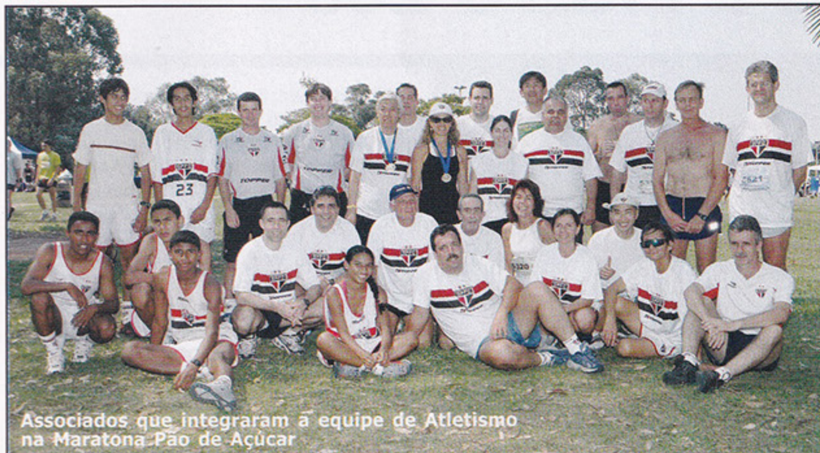
Associados que integraram a equipe de Atletismo na Maratona Pão de Açúcar