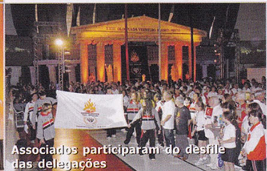
Associados participaram do desfile das delegações