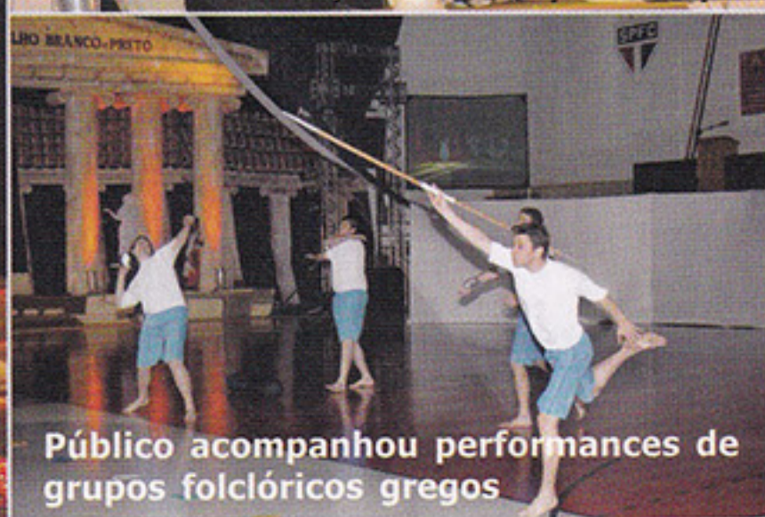
Público acompanhou performances de grupos folclóricos gregos