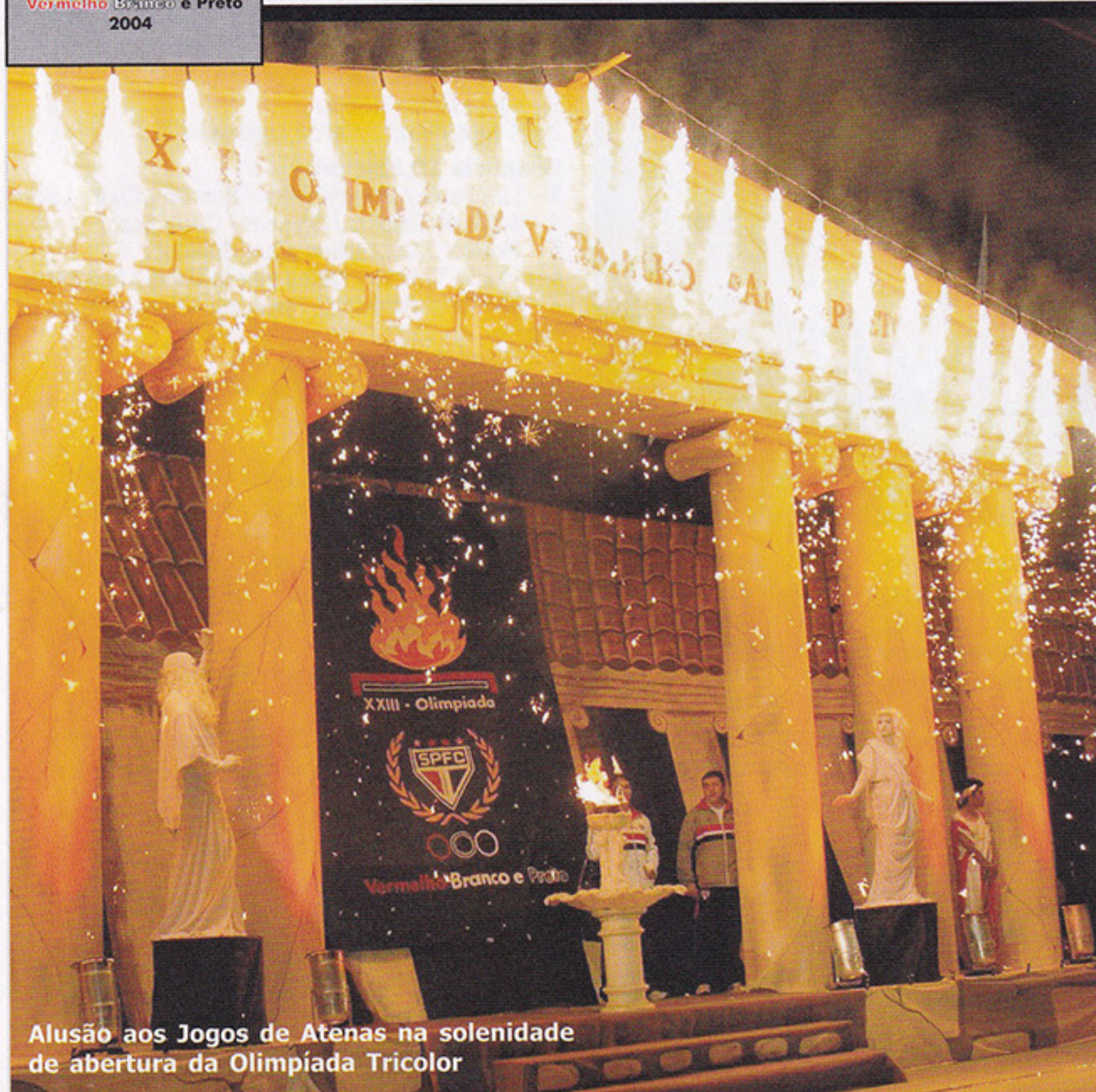
Alusão aos Jogos de Atenas na solenidade de abertura da Olimpíada Tricolor

A abertura da XXIII Olimpíada Vermelho, Branco e Preto, sob o tema Jogos Olímpicos do São Paulo Futebol Clube, em alusão aos Jogos de Atenas, aconteceu no dia 09 de outubro, no Ginásio 1, e contou com a presença de um público de aproximadamente 1200 pessoas. Para o evento foi montado um grandioso cenário grego, com uma réplica do Pátemon, por onde desfilaram as diversas modalidades representadas por associados do clube. O público pôde ainda acompanhar as performances de grupos folclóricos gregos e estátuas vivas.