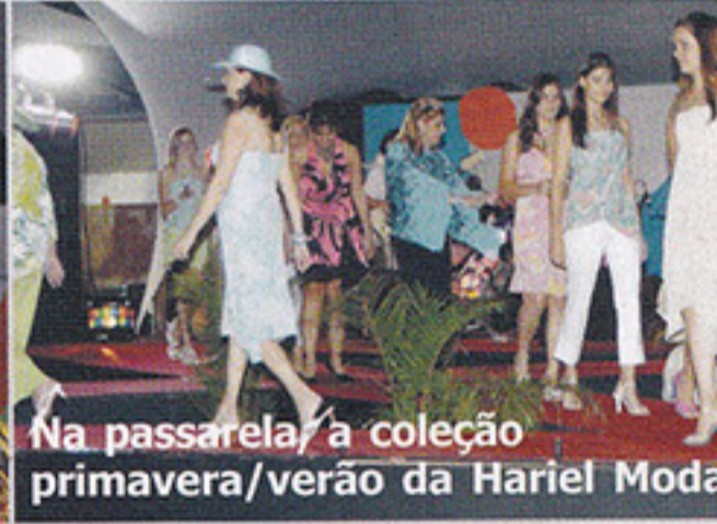
Na passarela a coleção primavera/verão da Hariel Moda