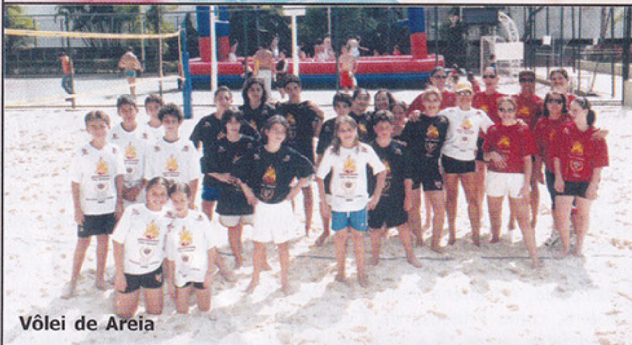
Vôlei de Areia