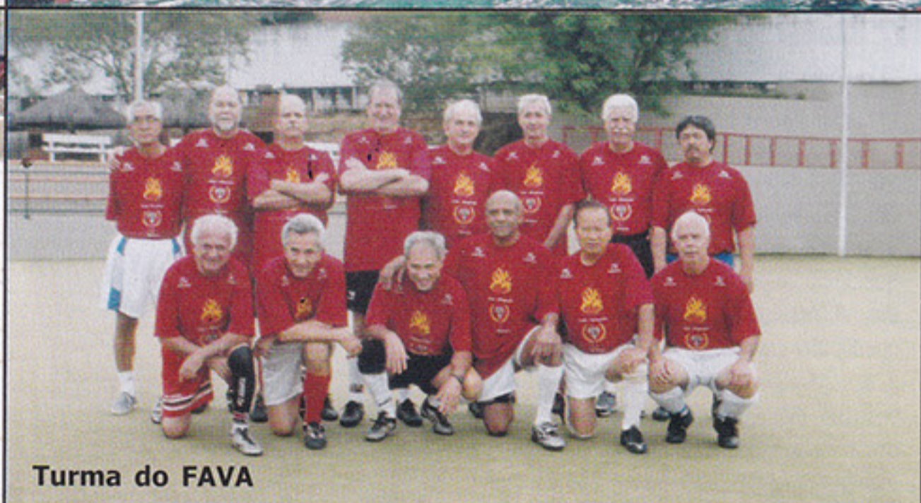
Turma do FAVA