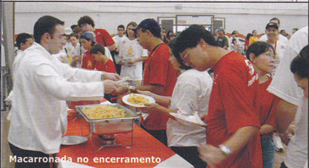
Macarronada no encerramento