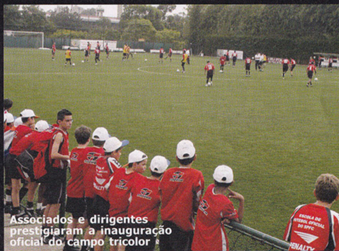
Associados e dirigentes prestigiaram a inauguração oficial do campo tricolor

A inauguração oficial do campo de grama sintética, dia 05 de novembro, contou com a presença da equipe de futebol profissional do São Paulo FC que treinou no novo tapete instalado na área social. Dirigentes e associados do clube também prestigiaram o evento. O São Paulo é o primeiro clube brasileiro a utilizar este tipo de piso, muito comum na Europa. Instalado pela empresa Soccer Grass o campo sintético do Tricolor, que é o maior da América Latina, segue os padrões exigidos pela FIFA com medidas próximas ao do gramado do estádio do Morumbi. O espaço utiliza ainda a tecnologia denominada "Just Robber", que absorve os impactos, dá conforto e segurança e ajuda, principalmente, a evitar lesões.