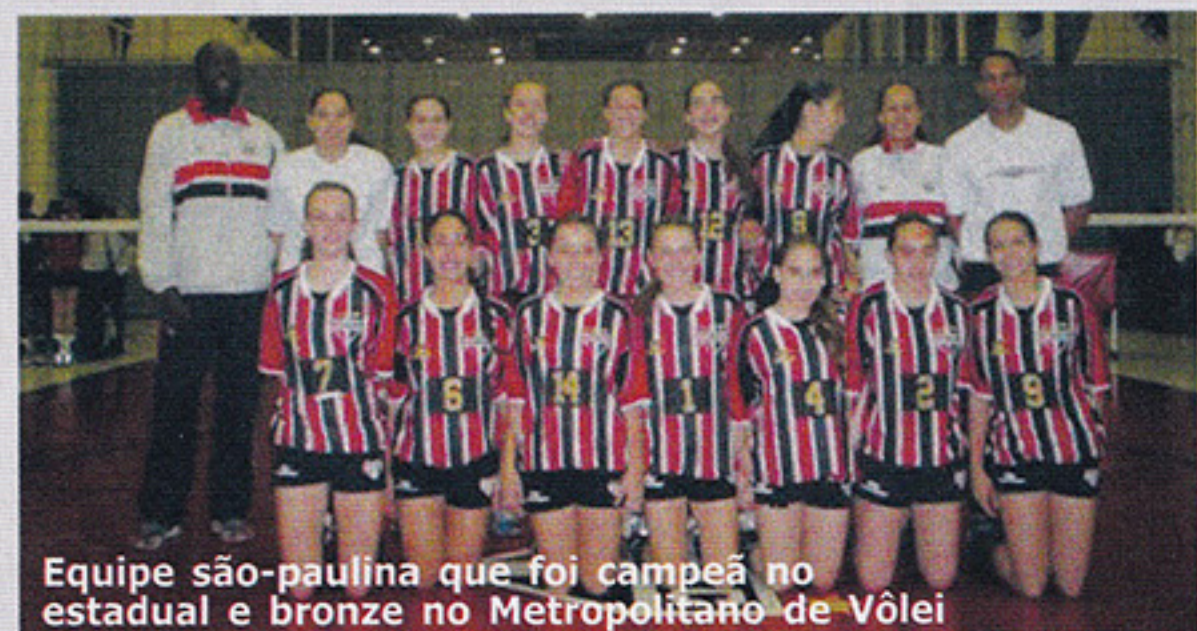
Equipe são-paulina que foi campeã no estadual e bronze no Metropolitano de Vôlei