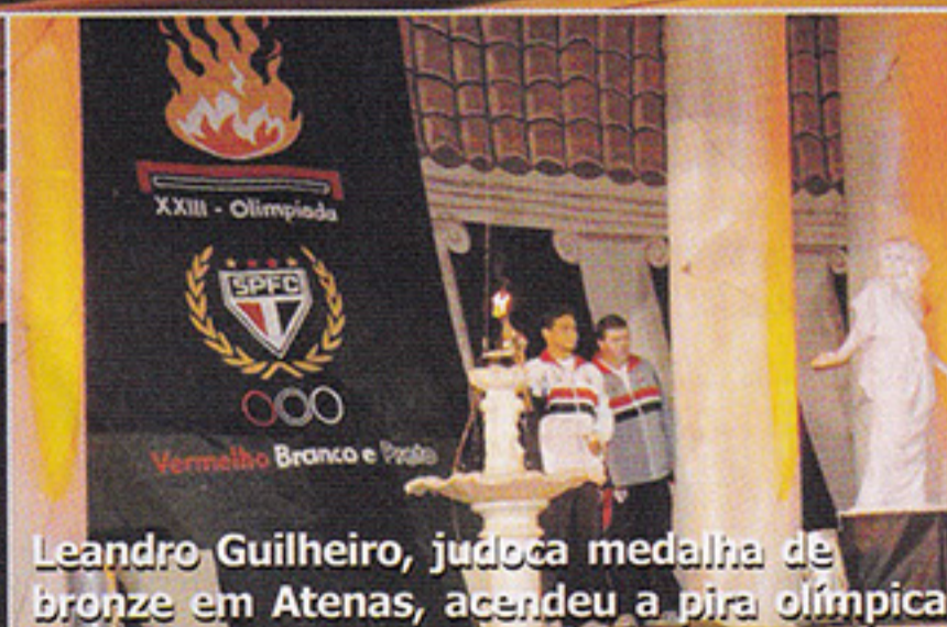
Leandro Guilherme, judoca medalha de bronze em Atenas, acendeu a pira olímpica