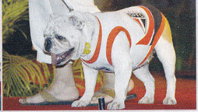
Cachorro da raça Pug carrega as cores do tricolor