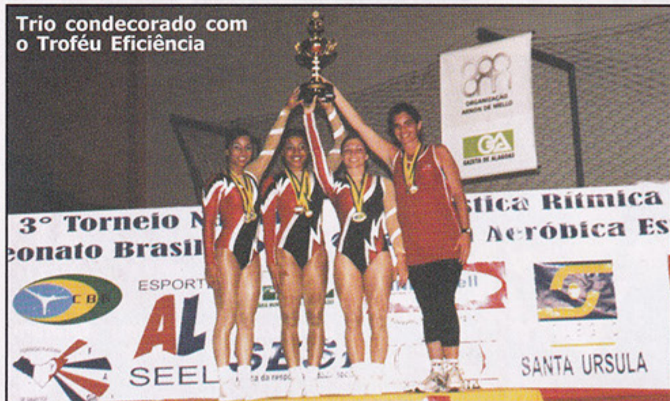
Trio condecorado com o Troféu Eficiência