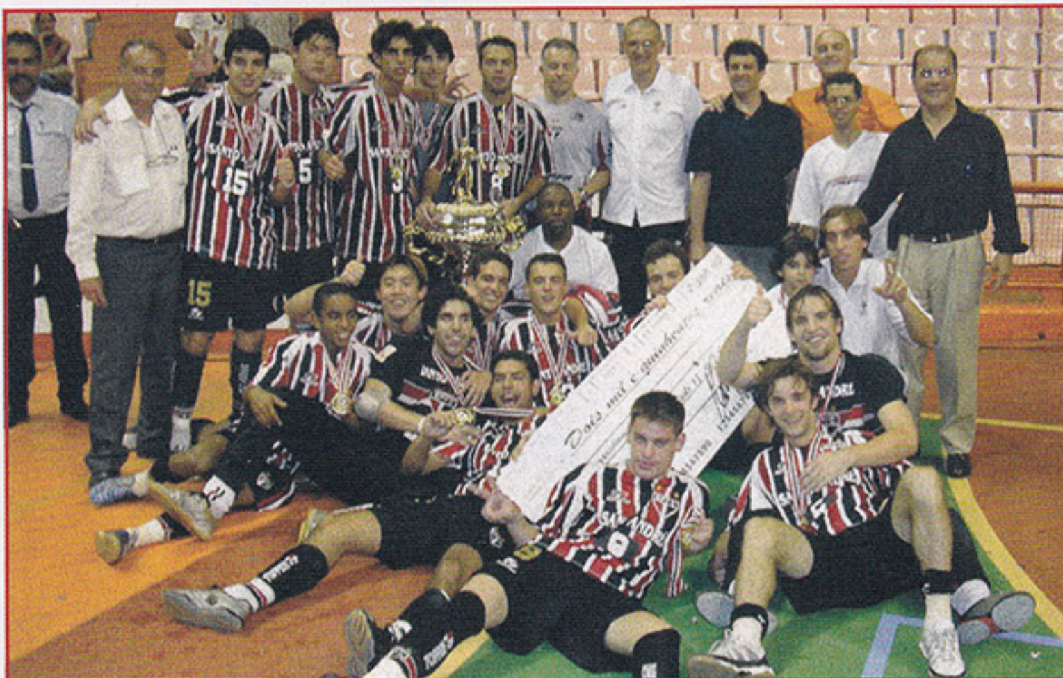
JORNAL DO FUTSAL