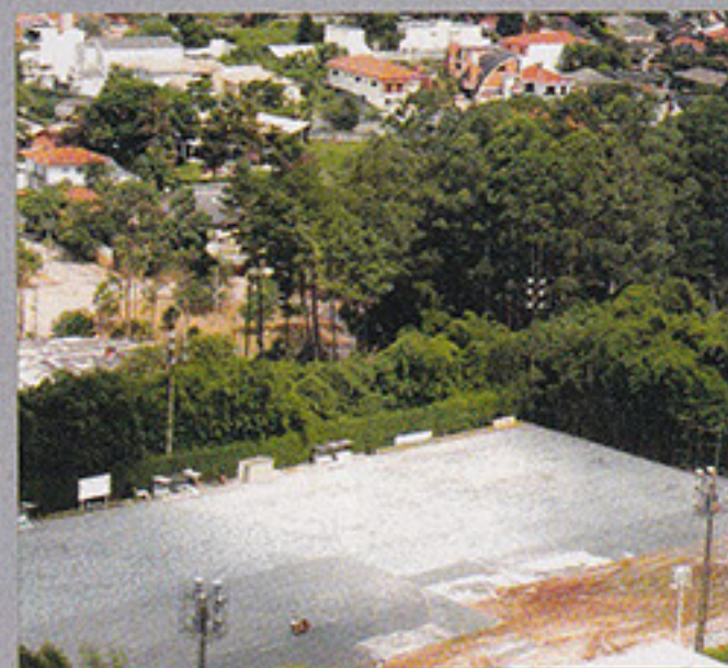
Obra do Campo Social

Outras obras como a última etapa da expansão da sala de musculação/centro de fitness (que alcançará 525 m 2 de área equipada), do centro de treinamento de Judô (com entrega prevista para o final de fevereiro), a nova lanchonete do campo social (entrega prevista para 21 de fevereiro), as quadras de squash e a cancha de bocha estão em andamento. O prédio social, novamente com suas estruturas em ordem, também deve reabrir em breve, já com a nova Central de Atendimento e o cyber place. Assim, o Ginásio 5, que hoje está sendo ocupado provisoriamente pelas Diretorias Social e de Esportes Amadores, poderá ser devolvido aos sócios em breve.