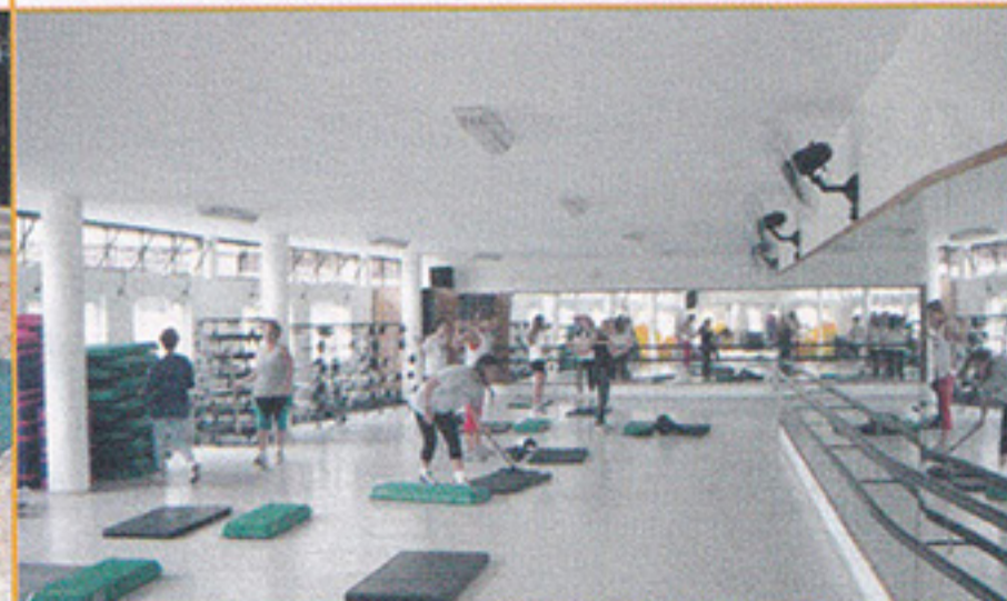
Novas salas da ginástica agradam