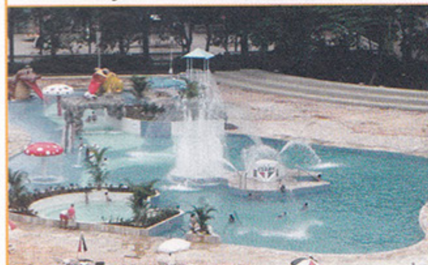
Parque Aquático: diversão garantida