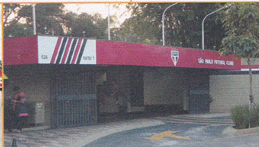
Novos acessos aos associados