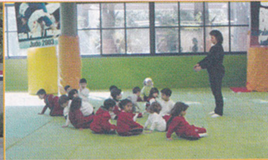
Judô em nova área