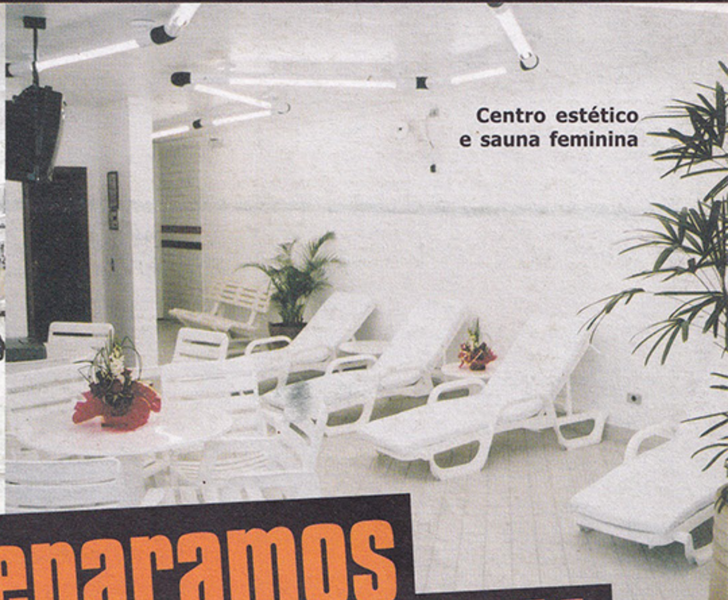
Centro estético e sauna feminina