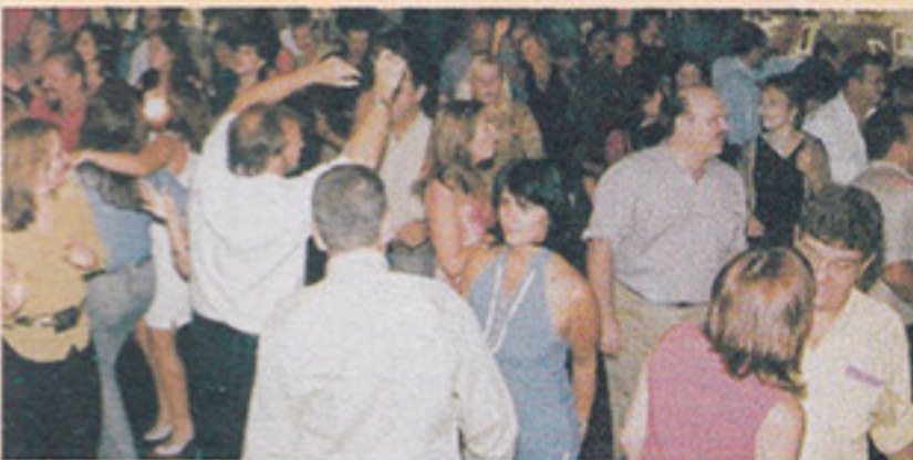
Associados e convidados divertem-se na Sexta Musical

A animação tomou conta da Sexta Musical do dia 22 de agosto com animação da Banda Café. Reúna os amigos e divirta-se na Sexta Musical. Todas as sextas-feiras, a partir das 22 horas, no Salão de Festas Social, com música ao vivo e ritmos variados. Sócios R$ 5,00 e convidados R$ 10,00 sem consumação.