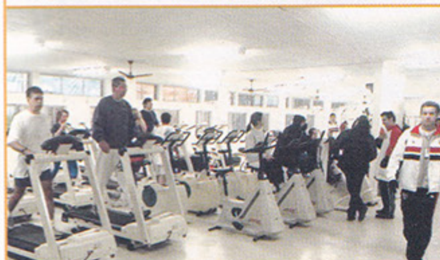
Salas arejadas e confortáveis