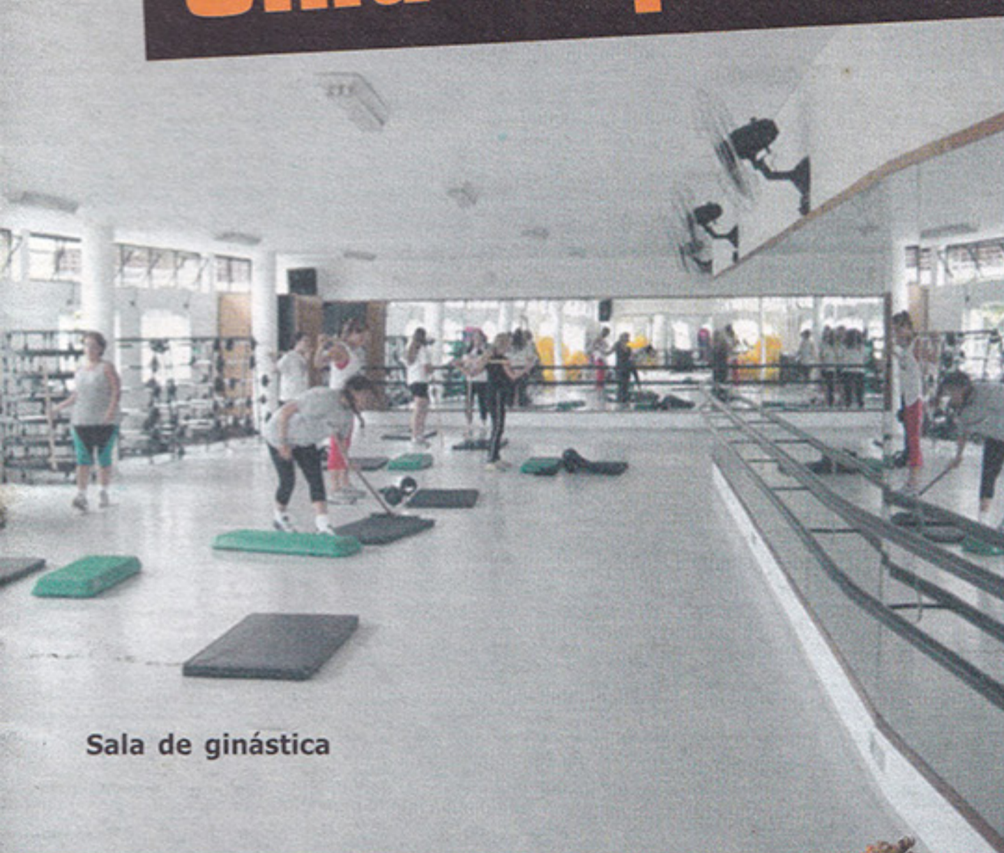
Sala de ginástica