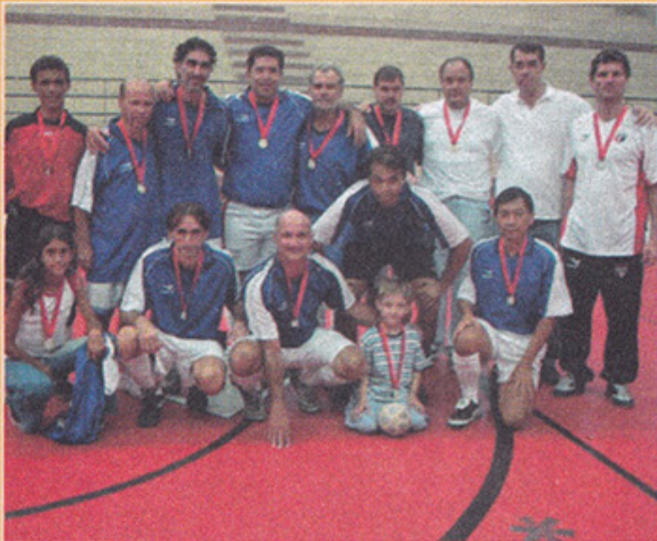
Categoria Adulto C Campeão: Panathinaikos Vice-campeão: Feyenoords