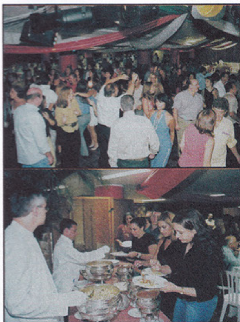
Associados prestigiaram Noite da Pasta e Vinho

Quem puder e tiver interesse em contribuir com o DASP, deve procurar o Grupo de Voluntárias, que se reúne todas as quartas-feiras, a partir das 14 horas, no portão 9 (antiga churrasceria). O grupo trabalha com todo tipo de artesanato (tricô, crochê, costura, biscuit, tapeçaria, pintura, bordados, etc). As peças não doadas serão vendidas na Festa Junina.