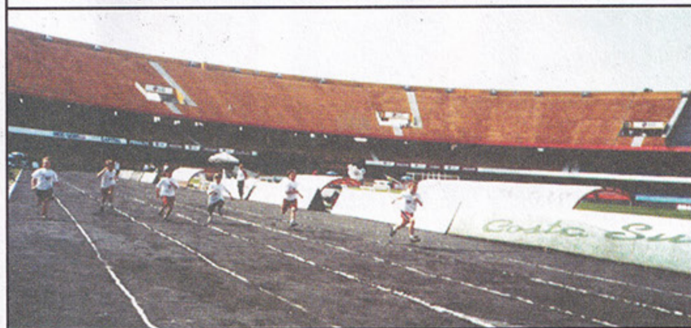
Garotada participando de atividades na pista do estádio do SPFC

Educação Física Infantil – crianças de 3 a 5 anos / Práticas Desportivas – crianças de 6 a 12 anos Aulas todas as terças e quintas-feiras ou quartas e sextas-feiras, das 8h10 às 11h10 ou das 14 às 17 horas.