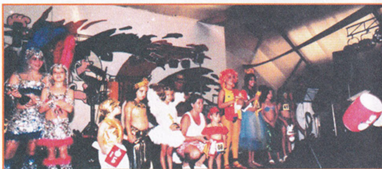
Concurso de fantasias premiou os pequenos foliões