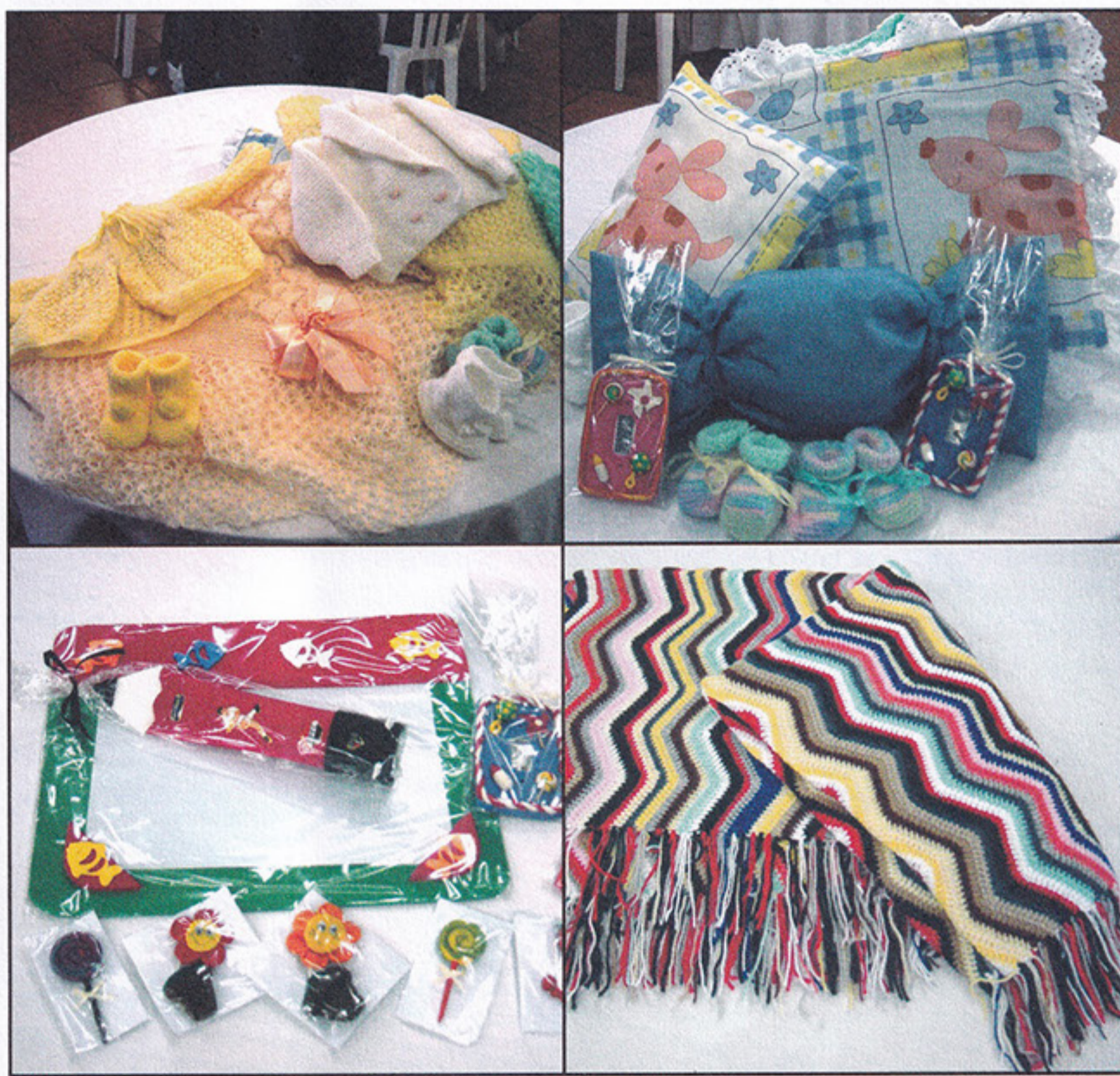
Materiais produzidos pelas voluntárias do Departamento de Assistência Social do São Paulo (DASP)