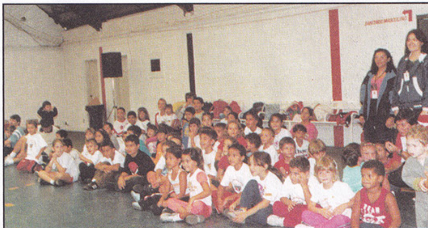
Manhã de integração reúne pais, professores e alunos

Criado para promover o desenvolvimento harmônico de todo o corpo, o COD visa dar uma boa postura e o equilíbrio da saúde das crianças. Isso é feito através de trabalhos progressivos de desenvolvimento das habilidades motoras - força, velocidade, resistência, coordenação e flexibilidade - e das formas básicas do movimento - andar, correr, saltar, lançar, rolar, girar, etc - aplicadas à iniciação em esportes individuais e coletivos. Além disso, o programa é voltado também para o desenvolvimento da integração social através de atividades