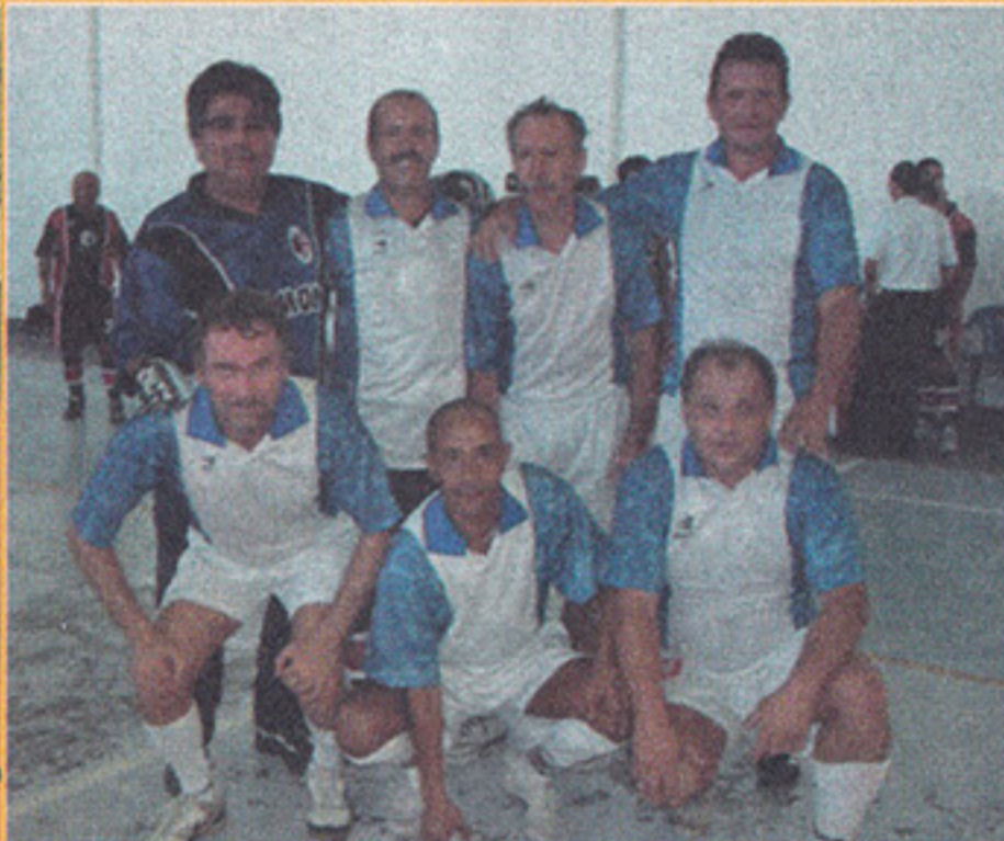
Categoria Adulto D Campeão: Olímpia Vice-campeão: Penharol

Para as categoria adultas, o campeonato começou dia 5 de abril. Todos os jogos são realizados no ginásio 1, aos sábados e domingos, a partir das 8 horas.