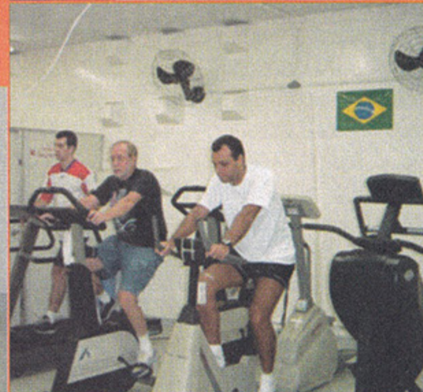
Atletas e sócios se beneficiam das ótimas instalações da fisioterapia são-paulina.