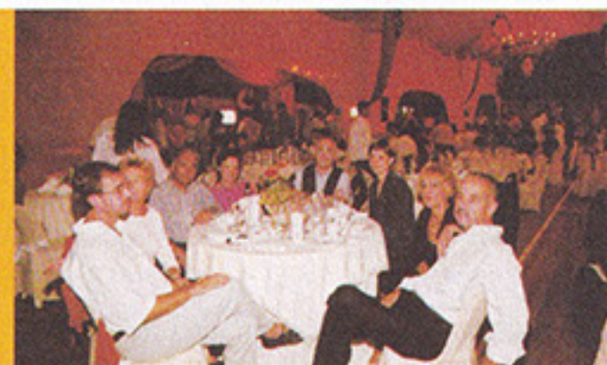
Representantes da Comunidade Alemã no Brasil prestigiaram a festa