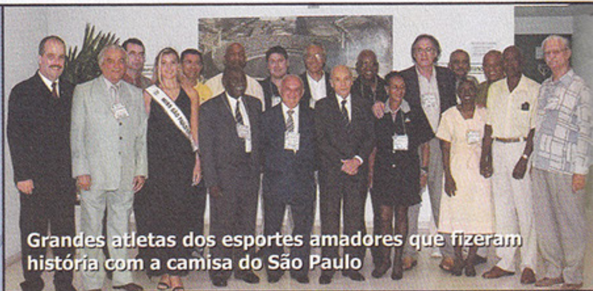
Grandes atletas dos esportes amadores que fizeram história com a camisa do São Paulo