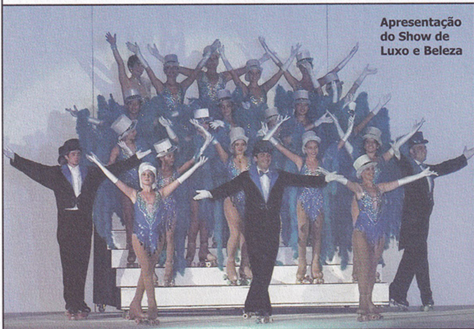
Apresentação do Show de Luxo e Beleza

A grande campeã deste ano foi a equipe Branca, totalizando 107 pontos; seguida pela equipe Vermelha, com 85 pontos e a Preta em terceiro com 78 pontos. Logo após os sócios se despediram da XXI Olimpíada participando da tradicional Macarronada, realizada no Salão de Festas.