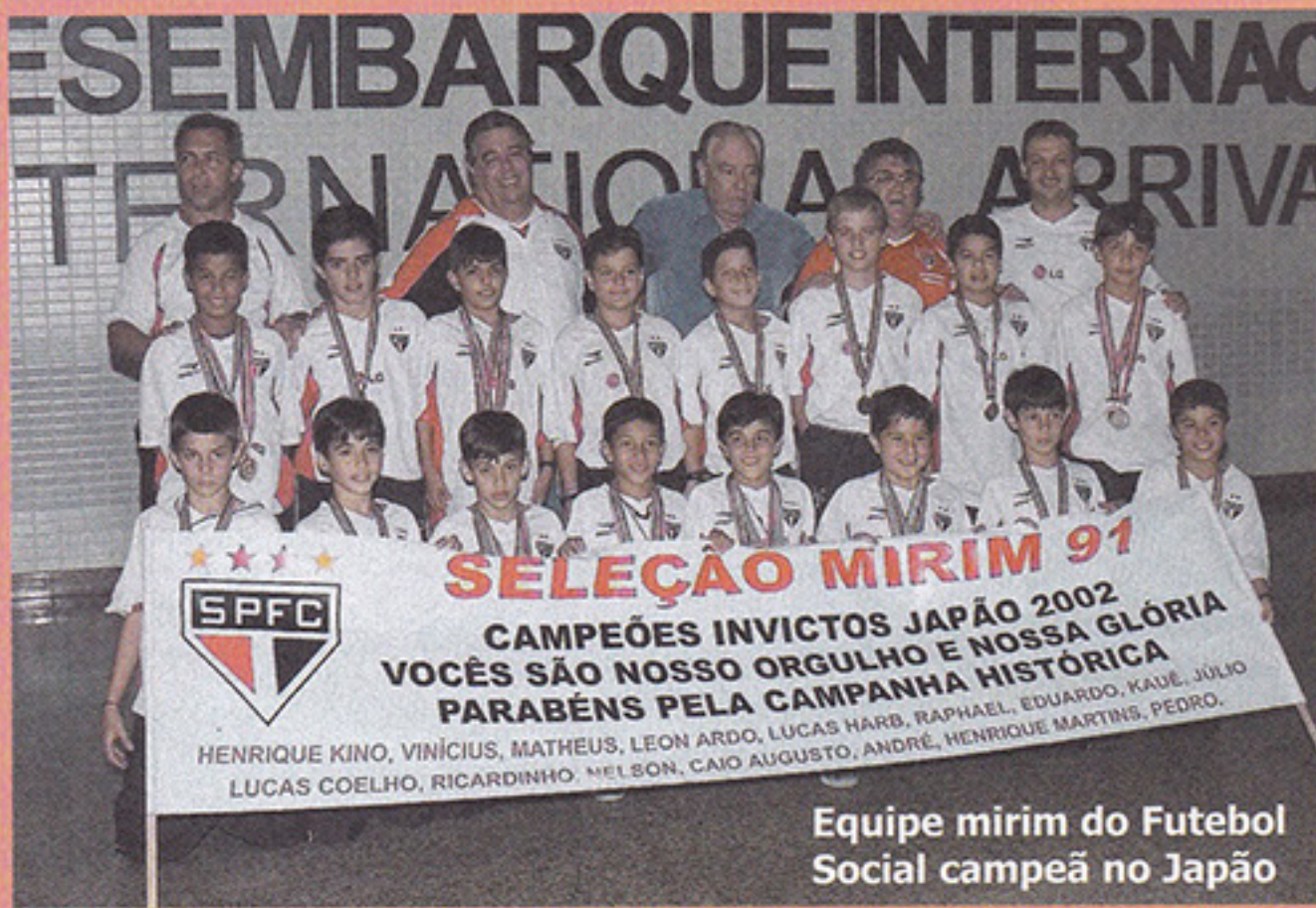
Equipe mirim do Futebol Social campeã no Japão

No décimo e último ano do intercâmbio esportivo-cultural com cidades do Japão, os meninos do Futebol Social Mirim do São Paulo deram show. Com uma campanha irrepreensível, os meninos retornaram trazendo na bagagem os troféus do 10º Intercâmbio de Futebol Social Mirim Taça da Amizade 2002, em Mogami, Estado de Yamagata; do 10º Torneio Takatomo Wonder Farm, em Naruko, no Estado de Miyagi; e do 10º Aniversário do Co-