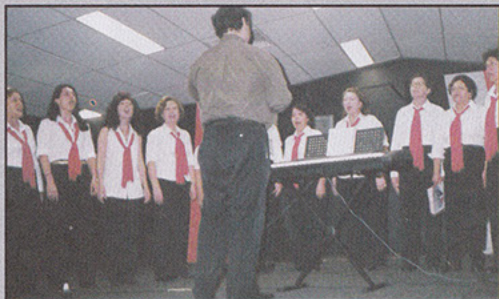
Coral do São Paulo no circuito Sindi-Clube de corais