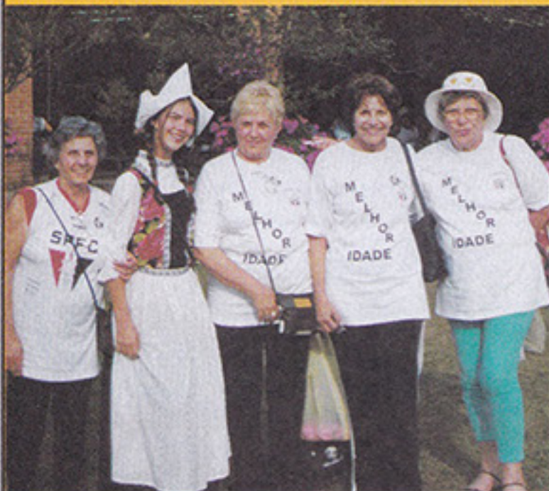
Turma da melhor idade passeia em Holambra

Aproximadamente 80 associados do tricolor, acompanhados por professores da ginástica, visitaram o Festival das Flores, evento tradicional da cidade. Neste ano, os são-paulinos já estiveram em Serra Negra e Campos do Jordão.