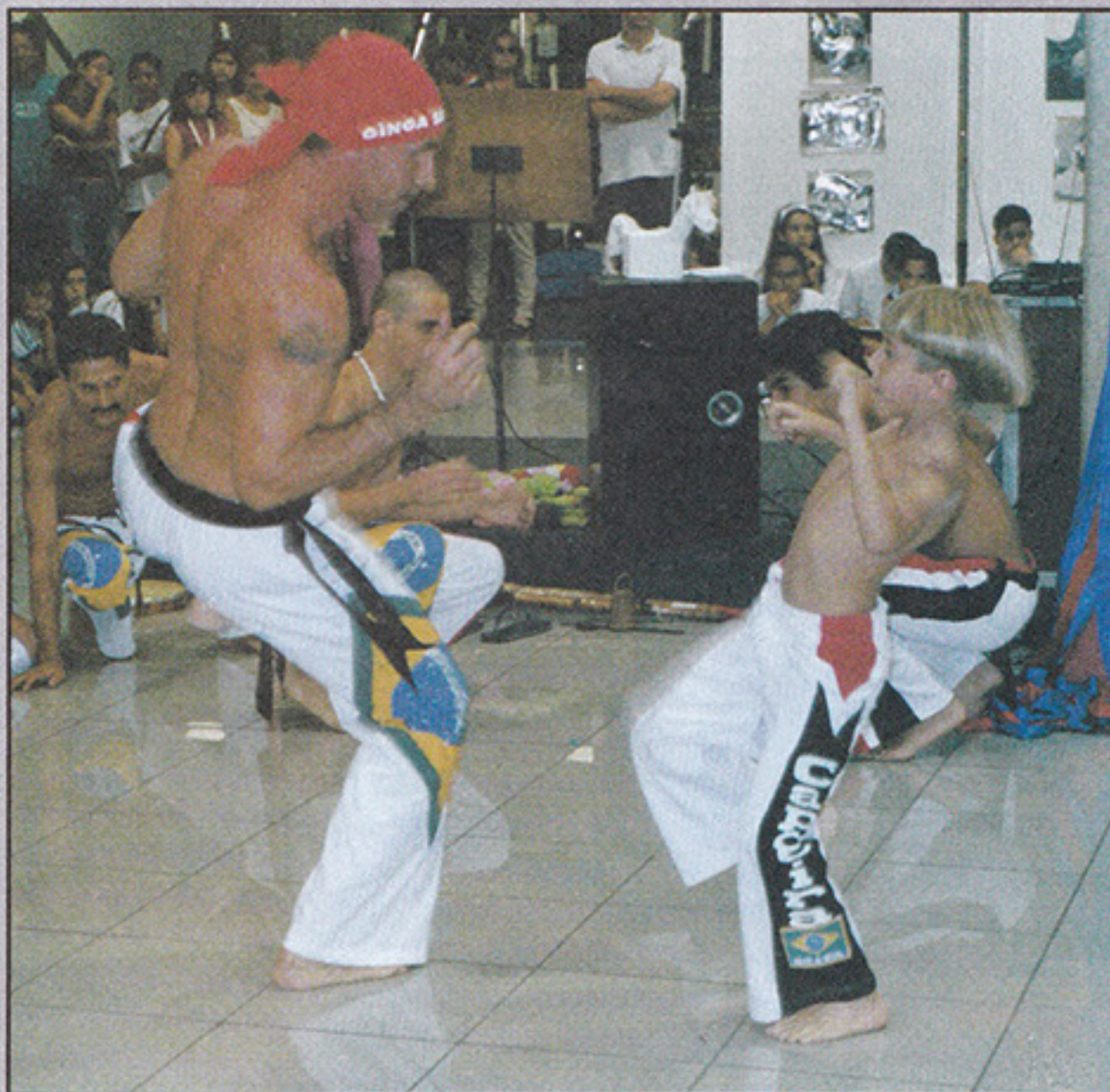
Grupo Ginga São Paulo no campeonato do Banespa