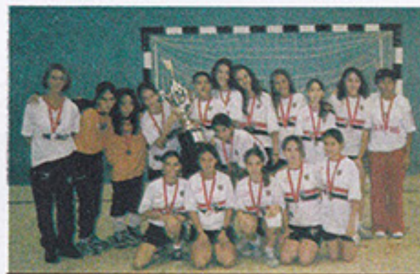
Meninas vice-campeãs do I Torneio Revelação Mirim