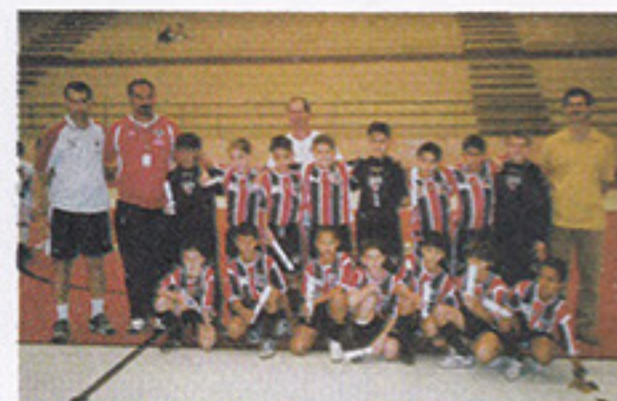
São Paulo/Barueri vice-campeã do metropolitano

O clube agora participa da Copa Rio/São-Paulo/Minas que terá os principais jogos transmitidos pela SPORTV.