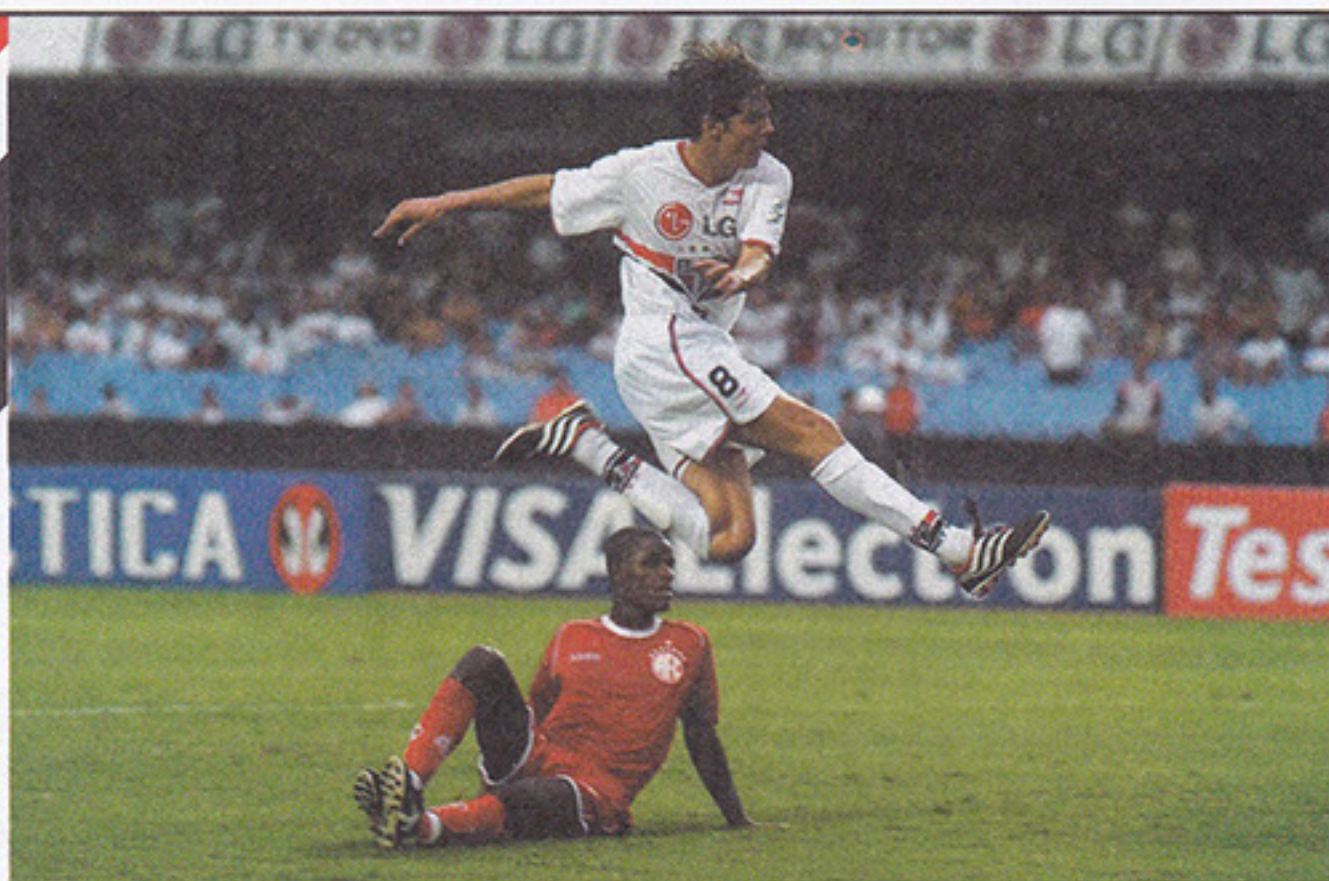
Hoje ídolo nacional, Kaká deu seus primeiros chutes e dribles nos campos do futebol social