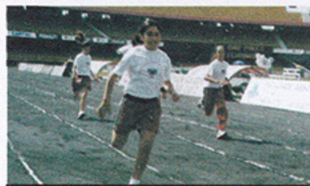
Crianças do COD no Festival de Velocidade

Dia 15 de setembro o COD realizou o Festival de Velocidade, com a participação de 53 crianças, com idade entre 6 e 12 anos. As competições aconteceram antes da partida do São Paulo contra o Fluminense no Estádio.