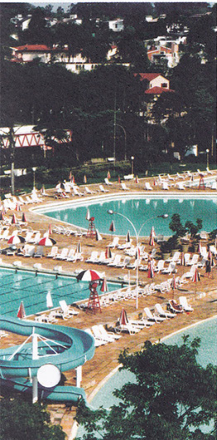
Relaxe no conjunto aquático do Tricolor