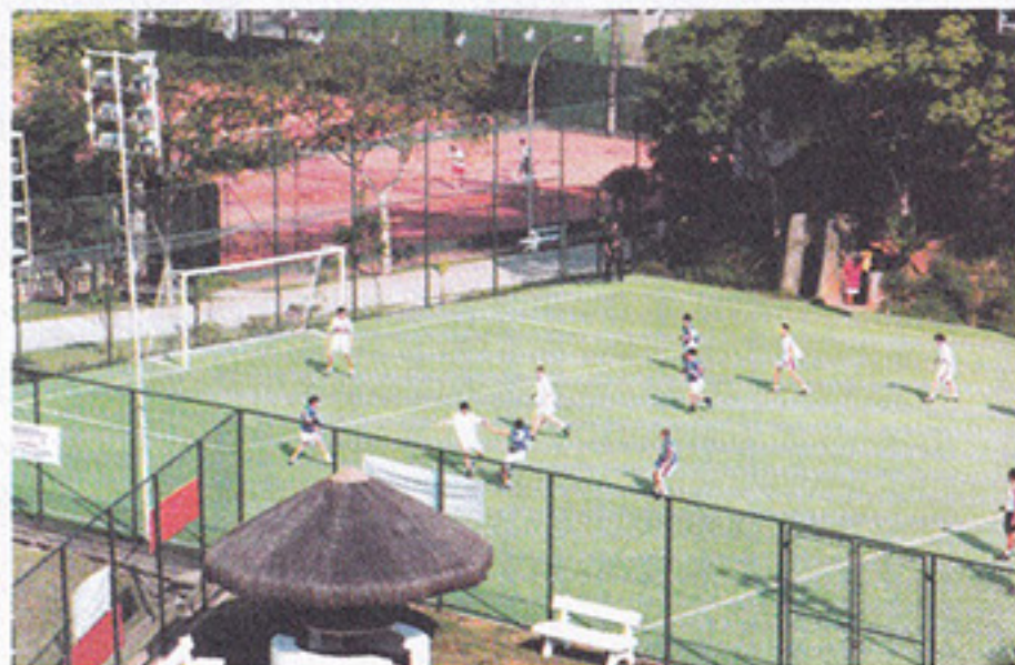
No Futebol Society desperte um craque em você