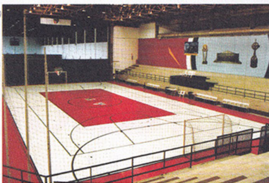
As quadras de futsal estão um brinco