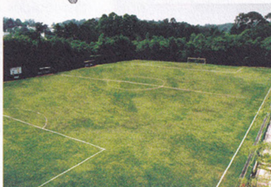
Tudo pronto no Futebol de Campo