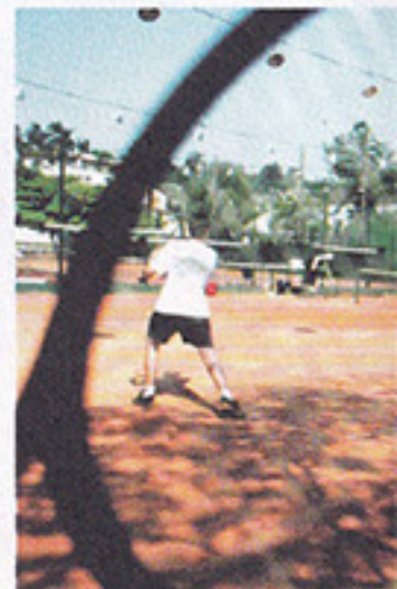
Confira as quadras