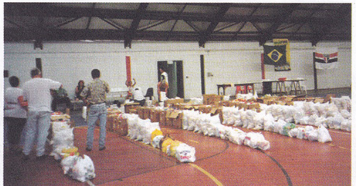
Oito toneladas de alimentos foram arrecadados

Já as competições esportivas aconteceram durante toda a semana, envolvendo atletas de todas as idades. No final das disputas, a cor vermelha sagrou-se campeã. Além das modalidades esportivas, os associados puderam aproveitar uma programação especial com muita música, recreação e eventos. Para finalizar a grande confraternização, os participantes se deliciaram com uma saborosa macarronada preparada pelos organizadores.