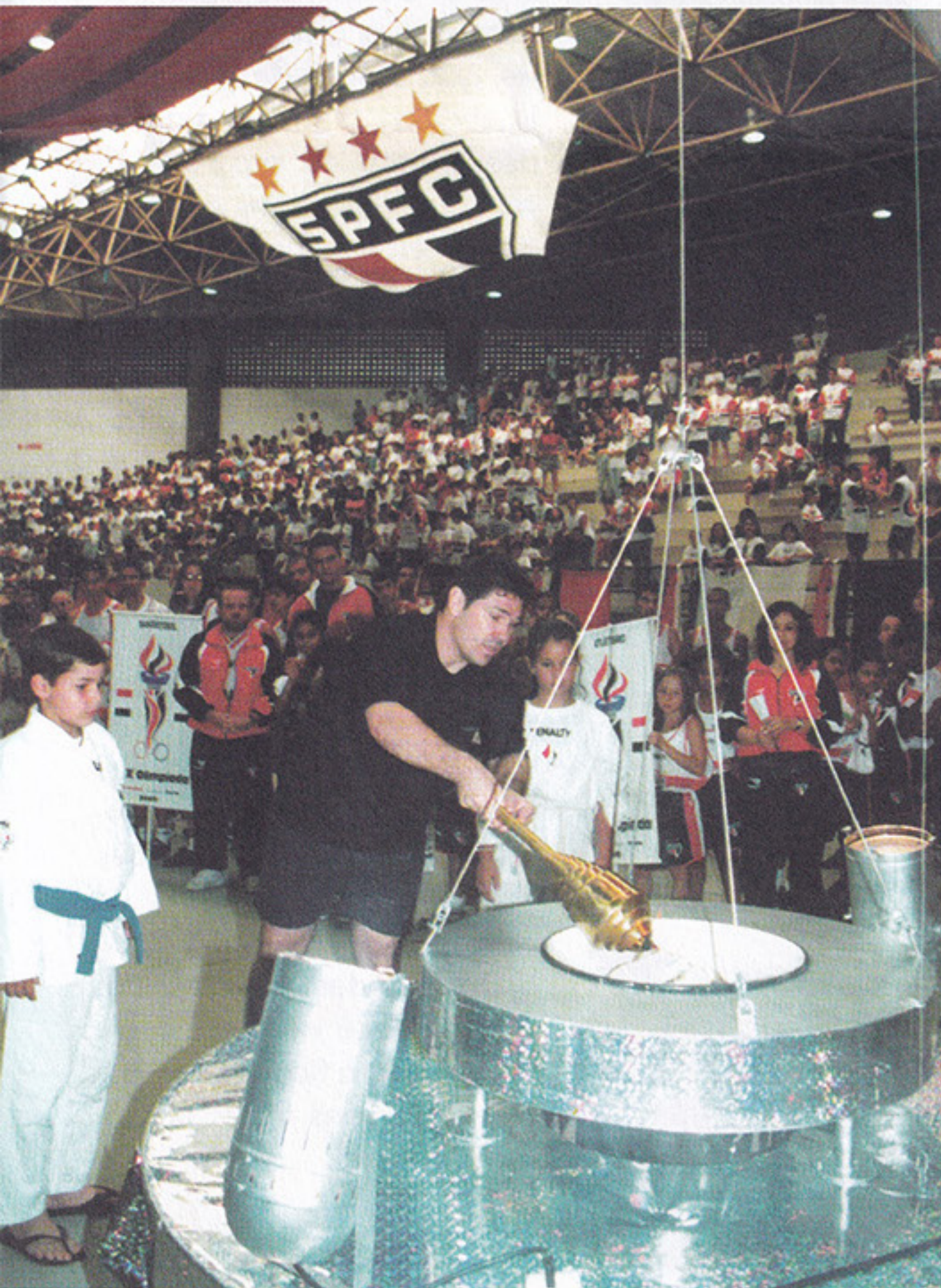
O campeão olímpico Aurélio Miguel acende a Pira Olímpica

A XIX Olimpíada Vermelho, Branco e Preto do São Paulo, realizada entre os dias 11 e 19 de novembro, balançou as dependências do clube. Com recorde de participantes, o Tricolor vibrou com as diversas alternativas esportivas proporcionadas aos associados. Um exemplo desse sucesso pode ser medido na quantidade de alimentos arrecadados. Foram 8 toneladas de produtos não perecíveis, distribuídos entre instituições de caridade: Care, Lar dos Velhinhos Izabel Modas, Associação Terceira Idade Cris, Lar Paulo de Tarso, Caritas - Par. Santa Suzana, Lar Jesus Menino, Lar Casa do Caminho e Instituto Lar de Jesus.