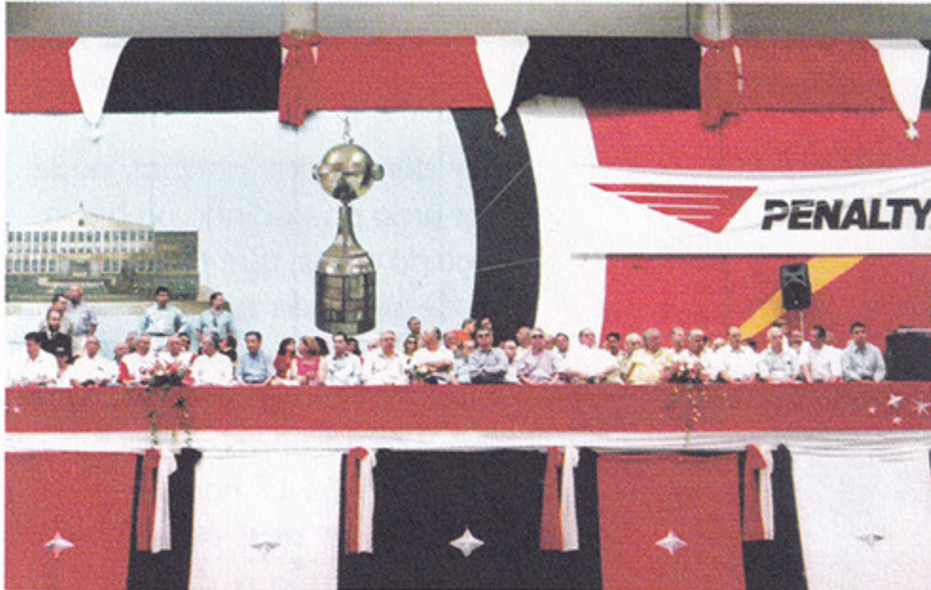
A Olimpíada Vermelho, Branco e Preto contou com a presença do presidente, ex-presidentes, conselheiros e diretores do Tricolor