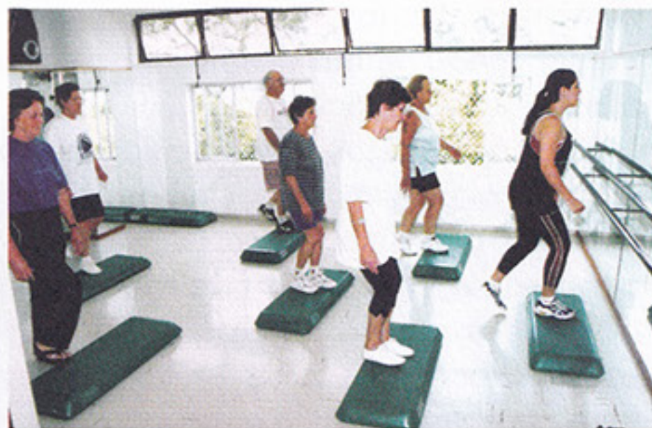
Step: uma modalidade diferente e descontraída