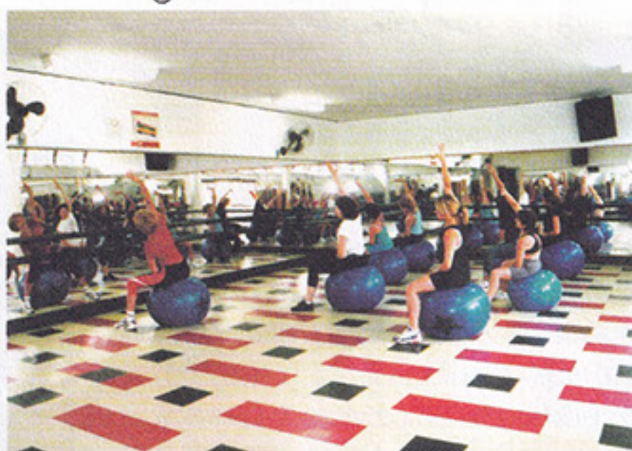
Ginástica para manter a forma