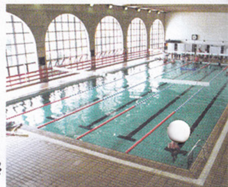
Na piscina coberta não esqueça do exame