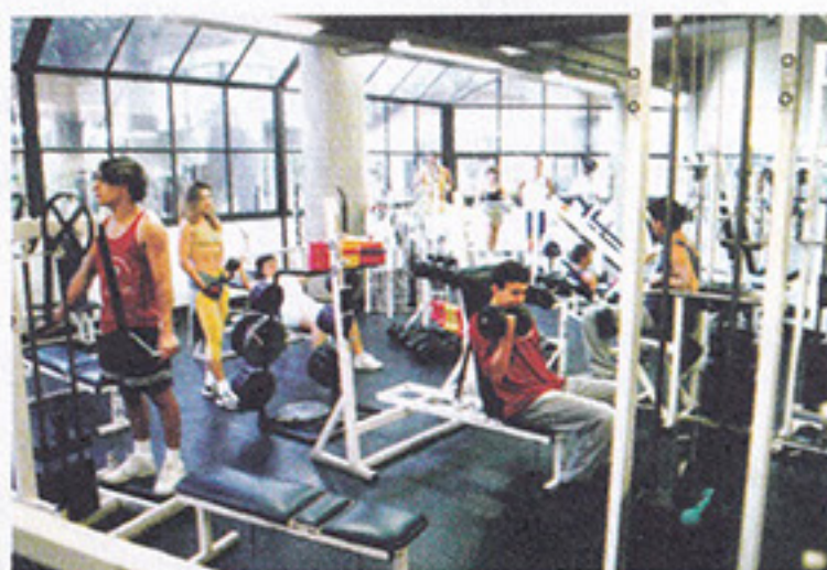
Musculação pra galera