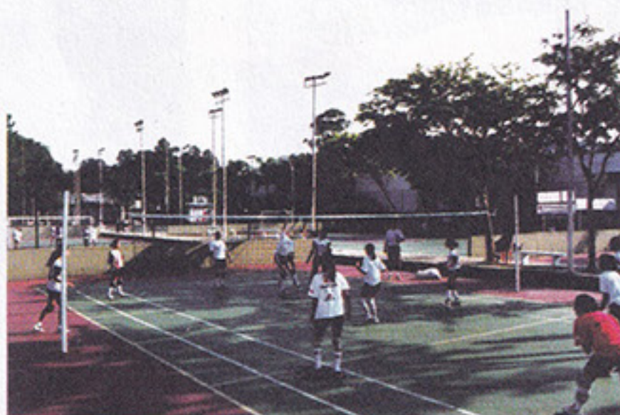
Quadras de vôlei reformadas para os associados

por dentro das notícias pode dar uma passadinha na biblioteca do clube, que estará aberta de segunda a sexta, das 9 às 20 horas, aos sábados das 9 às 19 horas, aos domingos das 9 às 18 horas, e nos feriados das 9 às 17 horas.