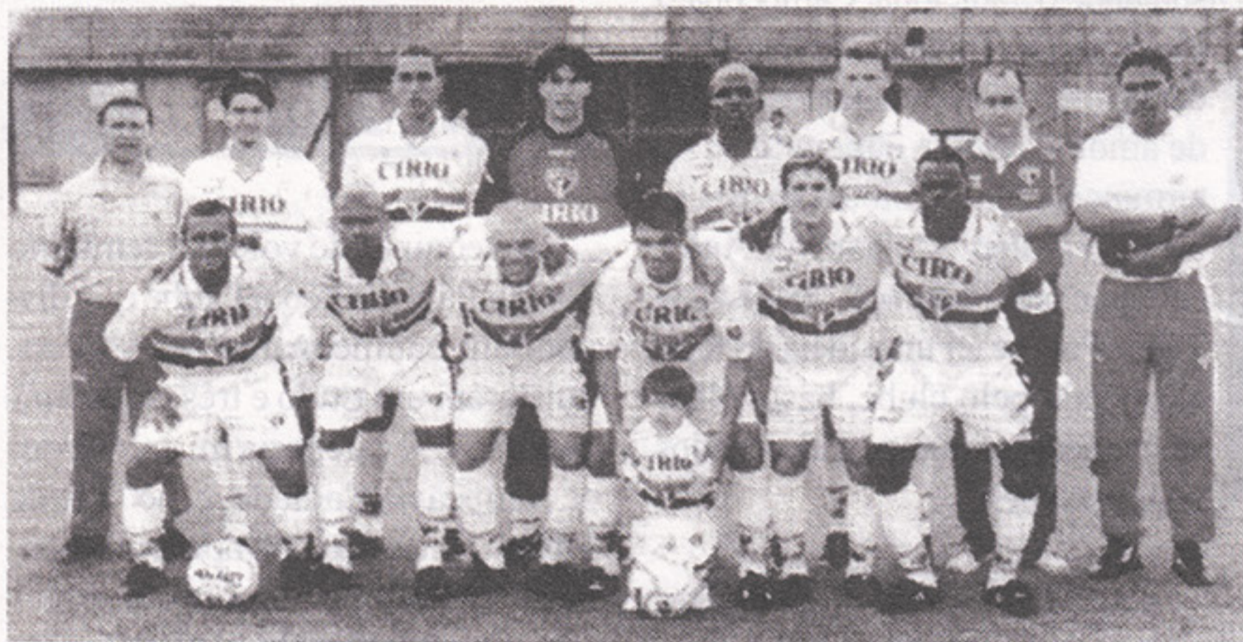
Juniões campeões: muitos deles já treinam com os profissionais.