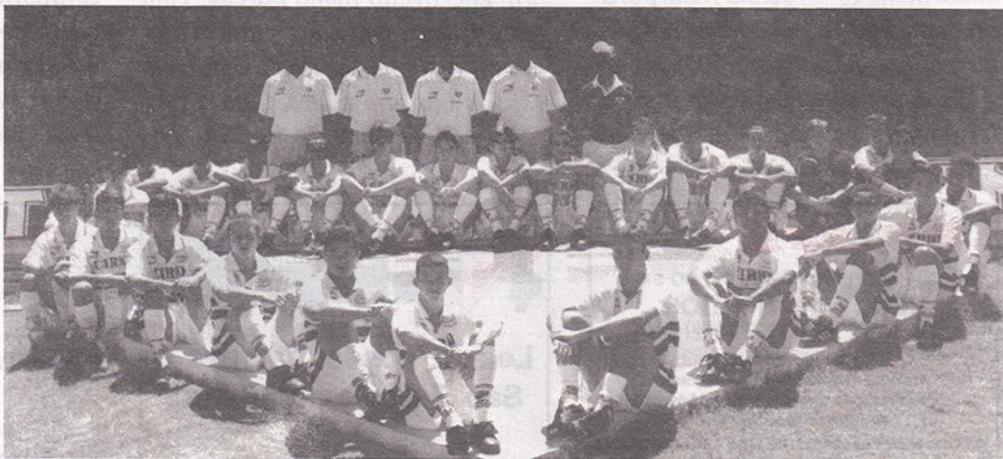
Elenco infantil-A do SPFC

A nova meta é o título da Copa São Paulo-2.000, competição que o Tricolor ganhou uma vez, em 1993. Nosso time está no Grupo E da primeira fase, com jogos em Guarulhos contra as equipes do Guarulhos, Juventude-RS e América-RN.