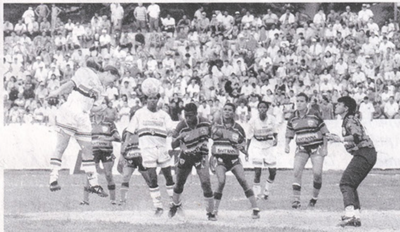
Na final do Brasileiro, São Paulo 4, Lusa Santana 0.