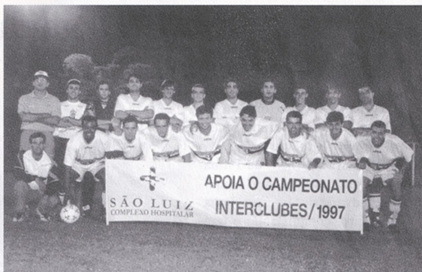
SPFC categoria principal: bicampeão 96/97.