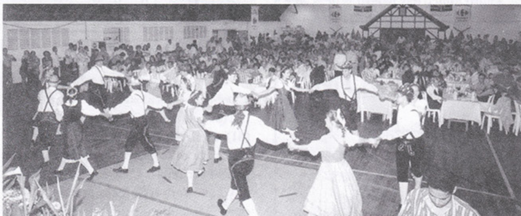
Festa alemã: animadíssima.

A Festa Alemã, dia 29/11, no G-4, foi exatamente o que dela se esperava: ótima. Animação e alegria, regadas por confraternização e amizade, pautaram a noite de chopp, chucrute, einsbein e que tais parecidos. Um casal presente foi sorteado com passagem e estadia em Caldas Novas, parceria que o SPFC fez com a ValeTur Turismo. Outros sorteios serão realizados em outras festas. O objetivo do clube é enriquecer cada vez mais o lazer do associado.