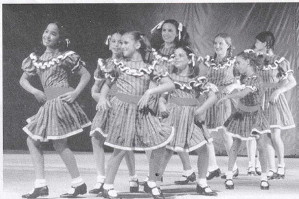
Graça e beleza no ritmo certo

Ano encerrado, ano novo no lugar. Os foliões já começaram a organizar o bloco que representará o SPFC no Pholianafaria, o desfile dos clubes da zona sul que acontece na Avenida Faria Lima no final de semana que antecede o Carnaval, dias 14 e 15/02. Nesta edição, nosso bloco vai desfilar às 18h50 do sábado, um horário que requer mais alegorias do que a camisa. O clube providenciou, então, um kit (com a camisa e outros adereços) que logo