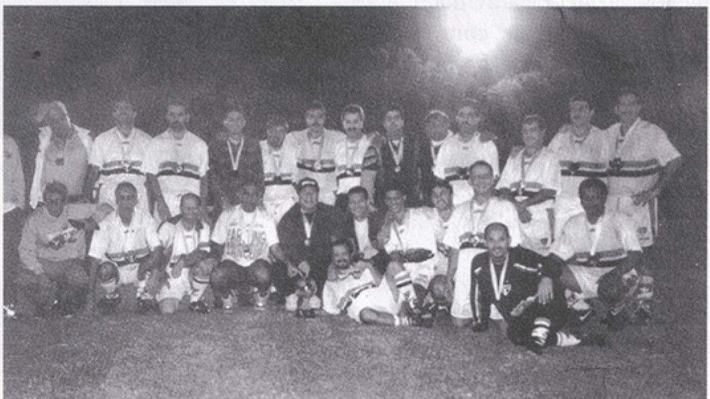
SPFC categoria masters: campeão 97.