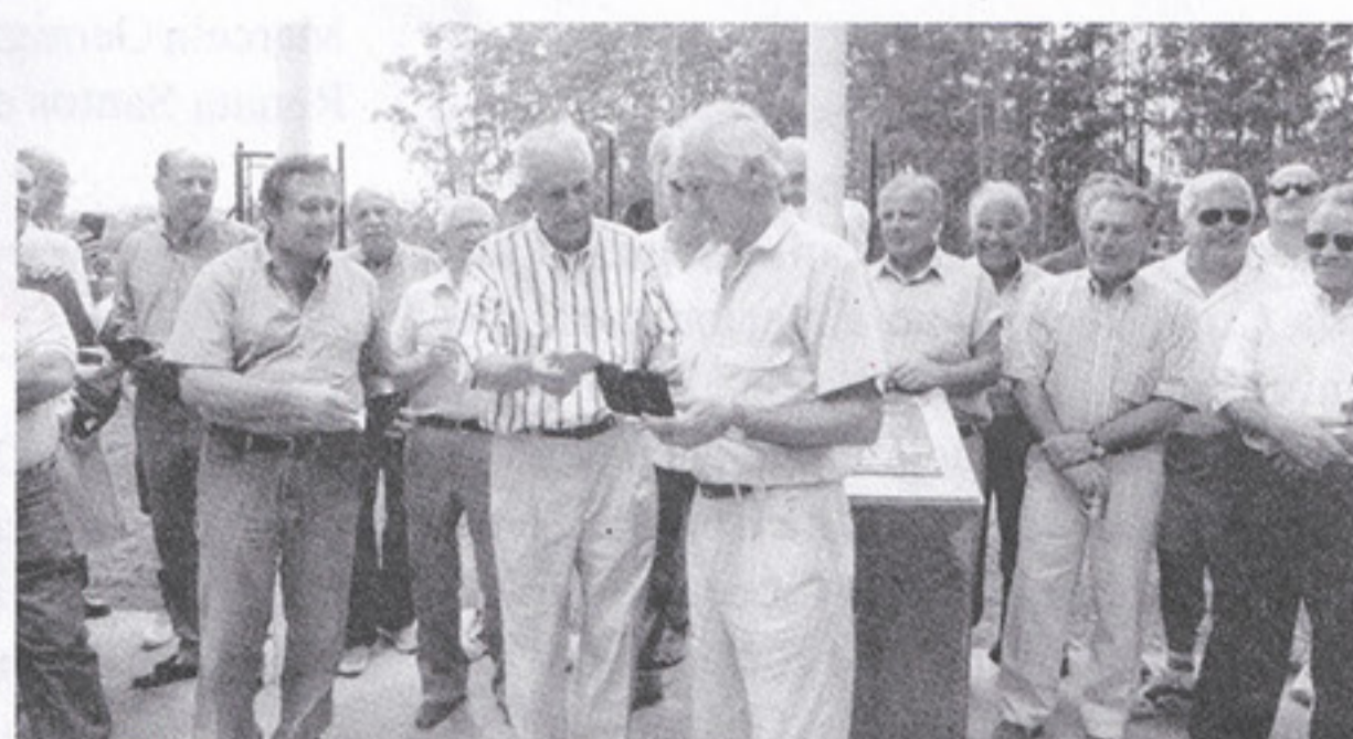
Na ocasião vários ex-jogadores foram homenageados pelos conselheiros, entre eles o "capitão" Bellini, ídolo do São Paulo na década de 60.