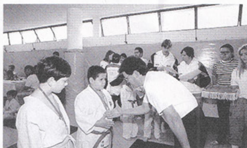
Judô do Cod: medalhas.