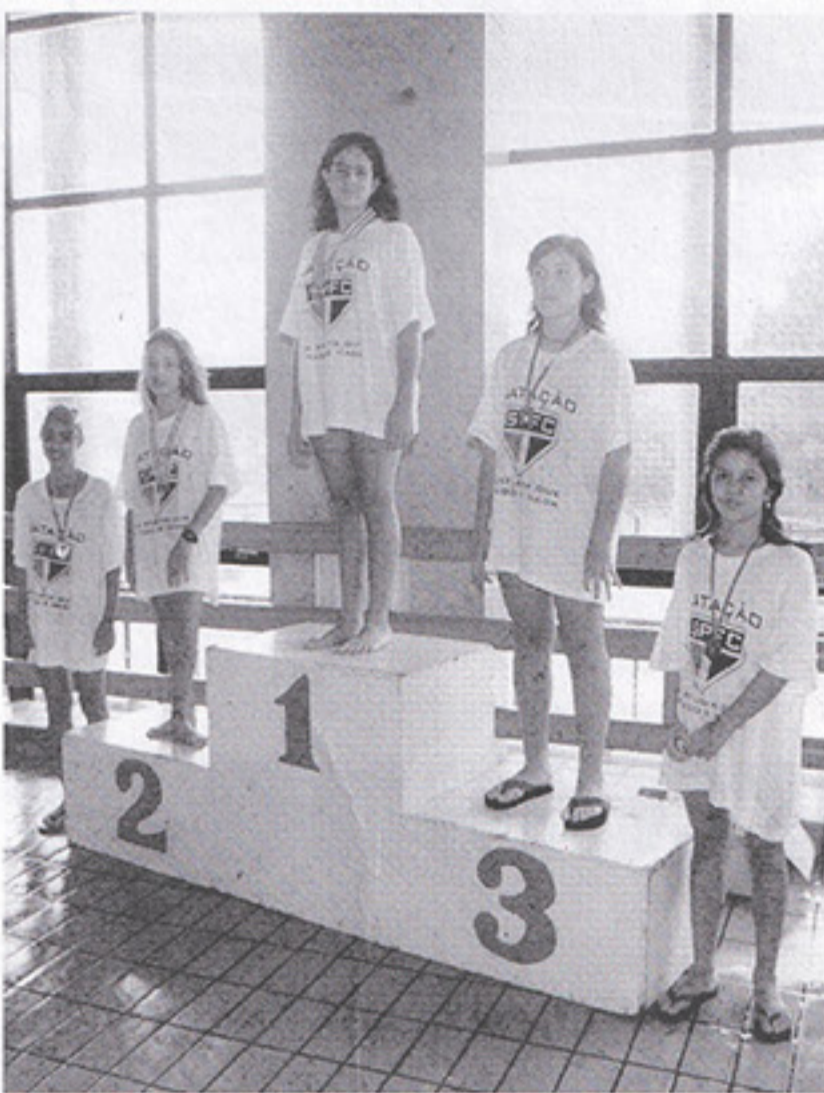
Vencendo e se motivando