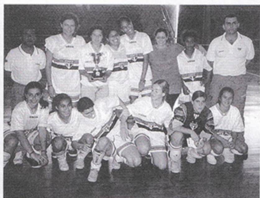
Taças para as meninas

O Campeonato Interno masculino e feminino do 2º semestre está à toda, com a