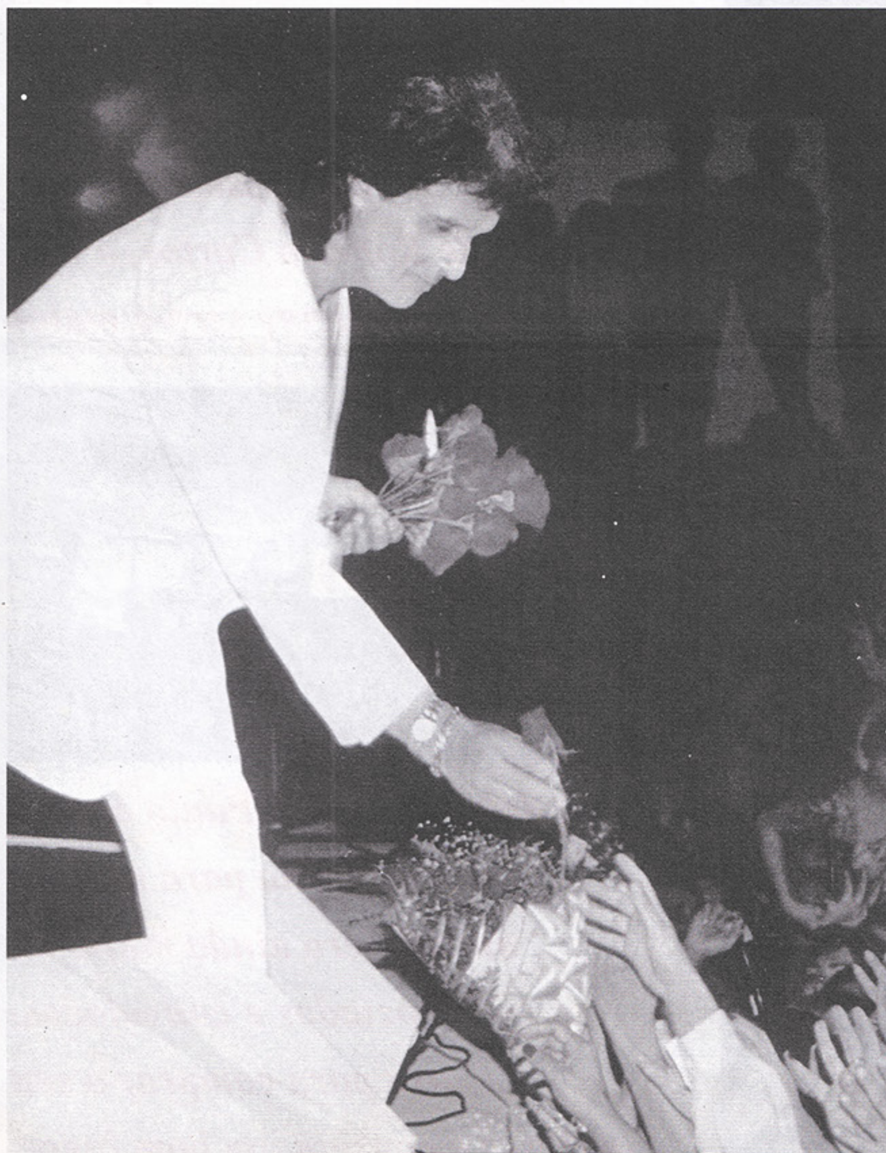
Roberto Carlos e o público: um entendimento eterno.

As empresas encarregadas de montar a infra-estrutura do show Amor, aliás, são as mesmas das turnês de grandes artistas, como Sting, Peter Gabriel e Rolling Stones, além de Pink Floyd. Para você ter uma idéia, Roberto Carlos é o primeiro artista brasileiro a utilizar o sistema de iluminação "vari lite", o melhor "moving light" do mundo, composto de 56 cabeças (spots móveis) computadorizadas, com capacidade de produzir até 3.600 matizes. Enfim, efeitos inovadores de projeção. Deslumbrante mesmo!