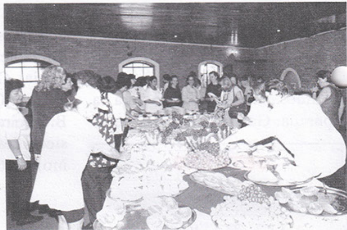
Um café da manhã especial para as mães no dia delas

Um clube vigoroso como o nosso não pára nunca de evoluir, em todos os seus setores. Neste segundo semestre, a entrada do Portão 7 passará por uma reforma, ficará mais moderna e funcional. Os painéis (murais) à esquerda de quem entra serão reformulados e conterão mais informações de interesse do associado. As máquinas para a implantação do novo sistema de carteiras sociais, também mais modernas e funcionais, estão chegando ao Portão 7. Semelhantes aos cartões de banco, elas são confeccionadas em dois minutos. Com foto! As catracas eletrônicas virão logo depois.