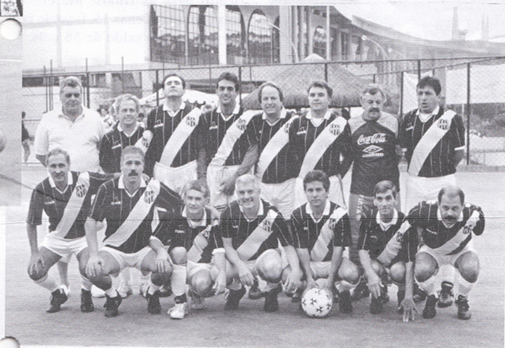
...o Chile foi o campeão da categoria B. A competição foi realizada na quadra de grama sintética nº 1 do Parque Social.