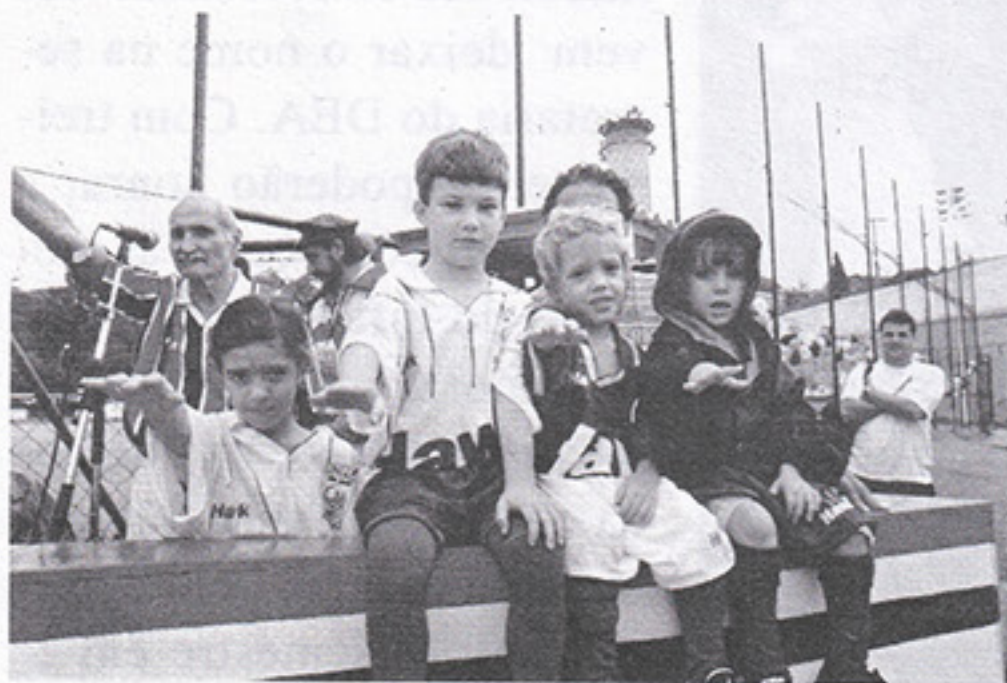
As solenidades de abertura são sempre emocionantes

470 associados assinaram a lista pró-grama sintética e 72 foram contra, preferindo o campo com piso de terra mesmo. Alguns assinaram as duas listas.