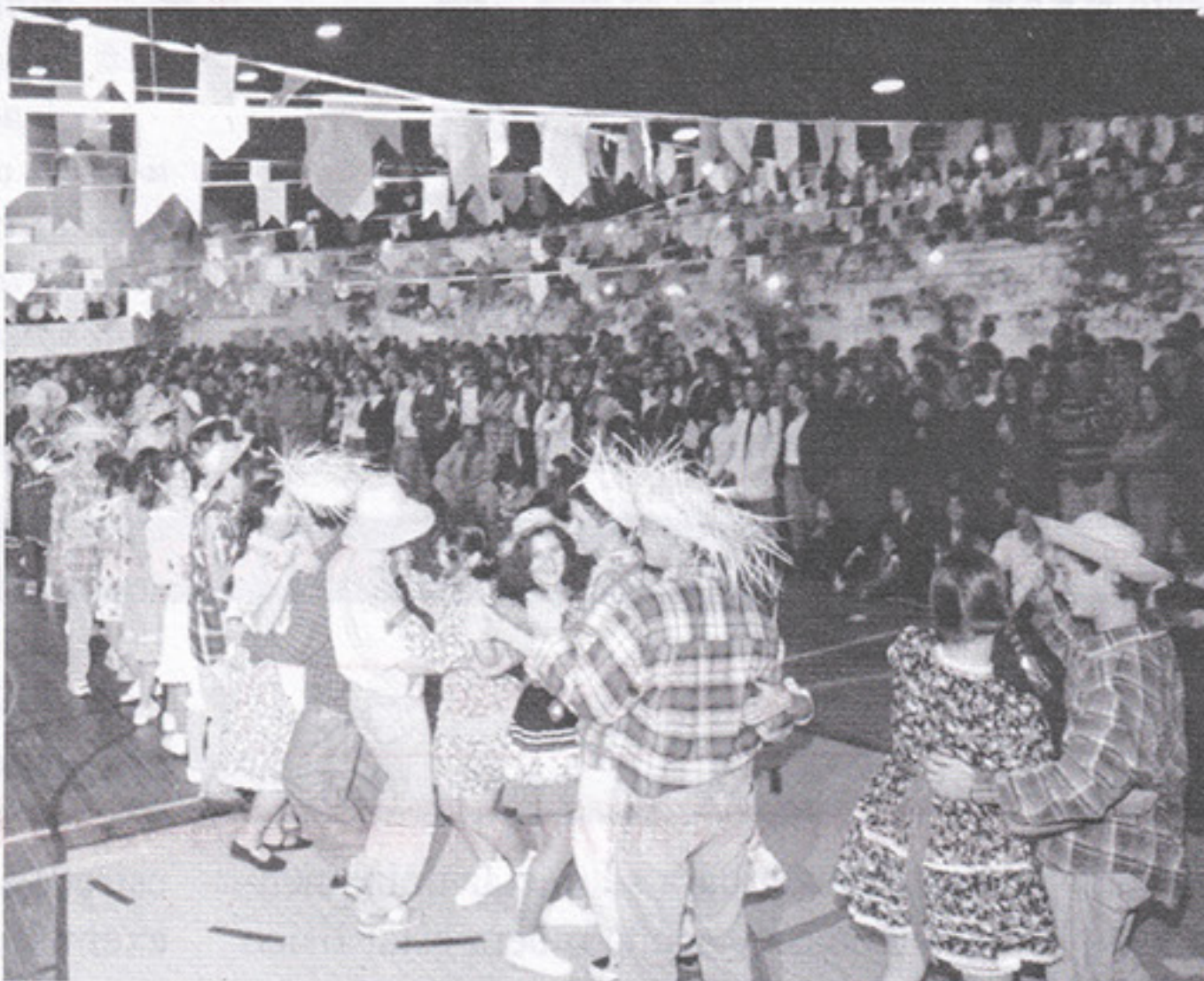
Festa Junina com alegria, animação e frequência.

A Subida do Pico do Jaraguá do dia 24/05 foi, mais uma vez, superagradável. Frio, tempo encoberto? E daí. A escalada e o churrasco foram ótimos, como sempre. Foi ótima, também, a Festa dos Anos 60, dia 07/06