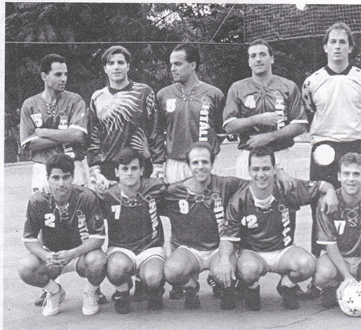
O time da Itália foi o campeão da categoria A do 1º Campeonato Interno de Futebol Society...

Por causa da Especial, não haverá categoria Juvenil no campeonato interno de menores. A Infantil e a Mirim, como sempre, jogarão no campo 1, reformado, bonito, e a Fraldinha e Pré-Mirim, além da Mulheres, jogarão no campo 2 — que passará a ter grama sintética. Essa reforma já começou e o novo “gramado de Primeiro Mundo” do clube ficará pronto em agosto. Assim, os campeonatos das mulheres e dos meninos mais novos começará uma ou duas semanas mais tarde do que os outros. Em compensação, é certo que não terão rodadas adiadas pela chuva.