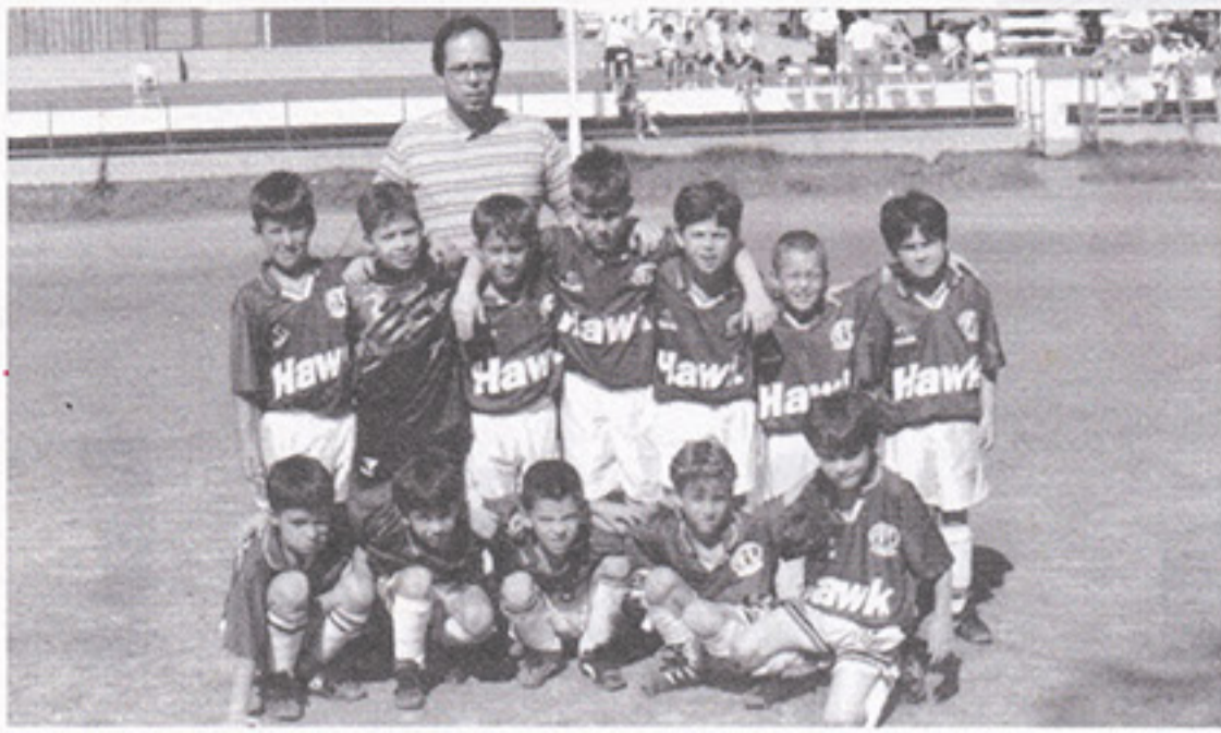
Ferroviária, categoria Fraldinha

Os campeões de 96 foram Ferroviária (Fraldinha), Ponte Preta (Pré Mirim), Internacional (Mirim), Novorizontino