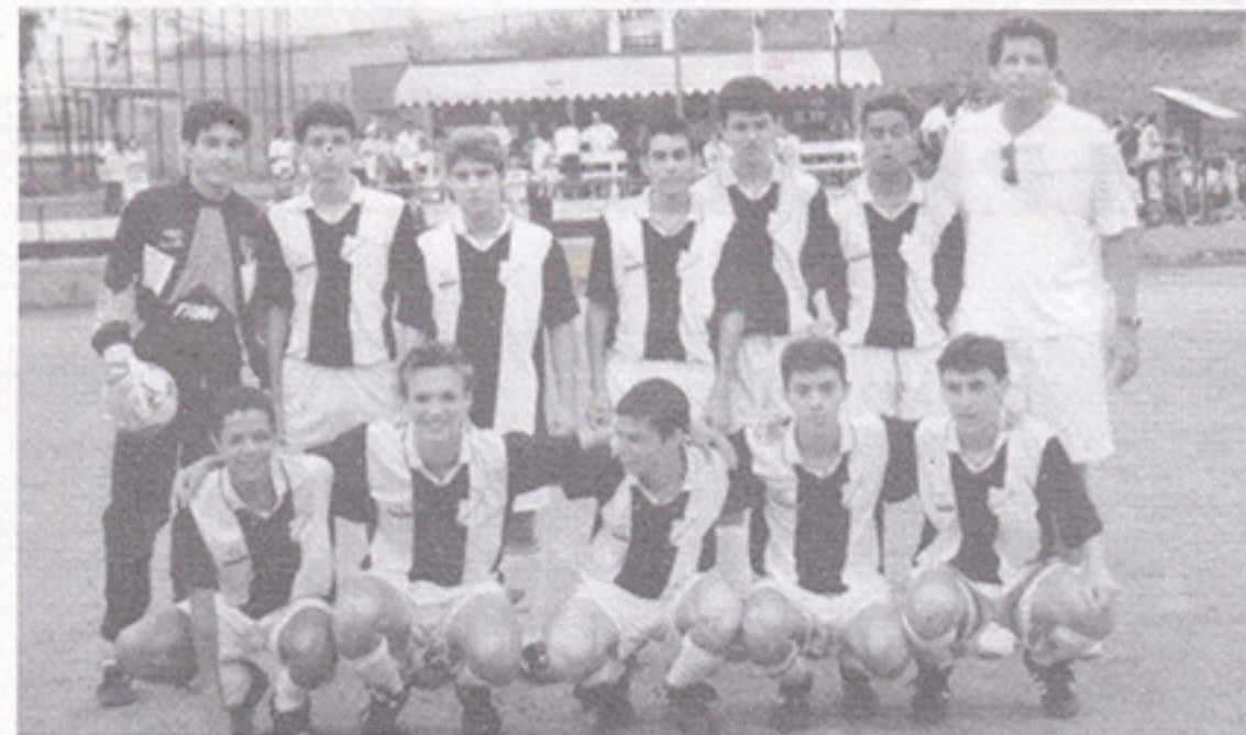
Internacional, categoria Infanto