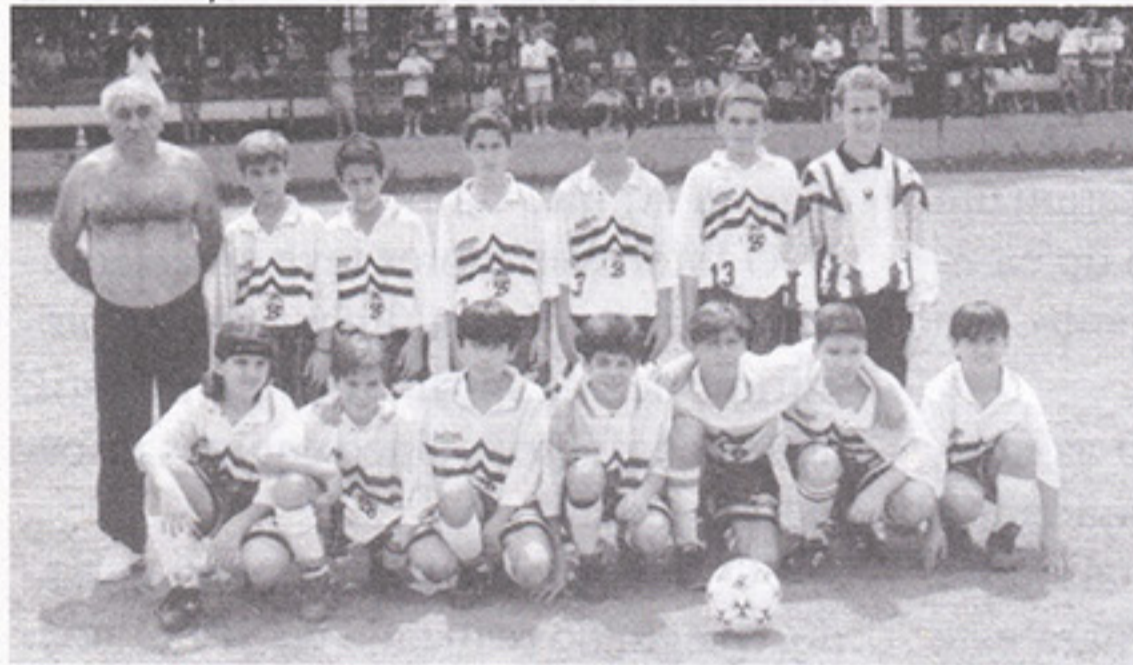
Internacional, categoria Mirim

(Infantil), Internacional (Infanto) e Botafogo (Juvenil). Os coordenadores-técnicos-pais-conselheiros - amigos dos garotos dessas equipes foram,