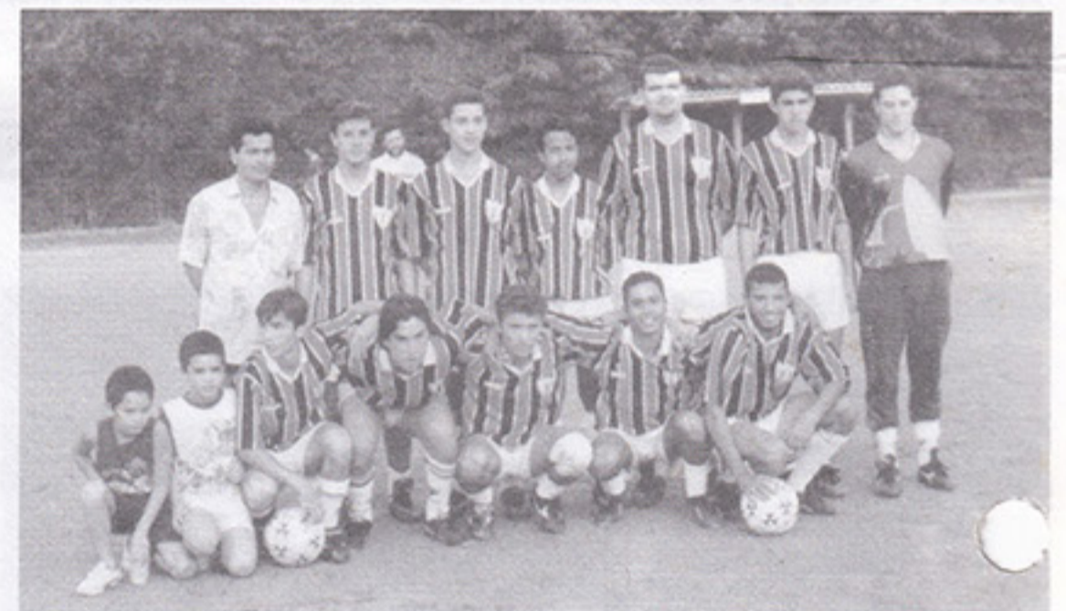
Botafogo, categoria Juvenil