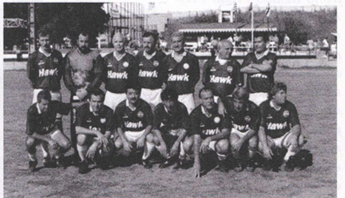
São José, categoria D