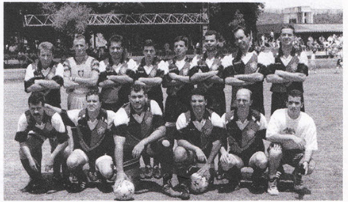
Rio Branco, categoria B