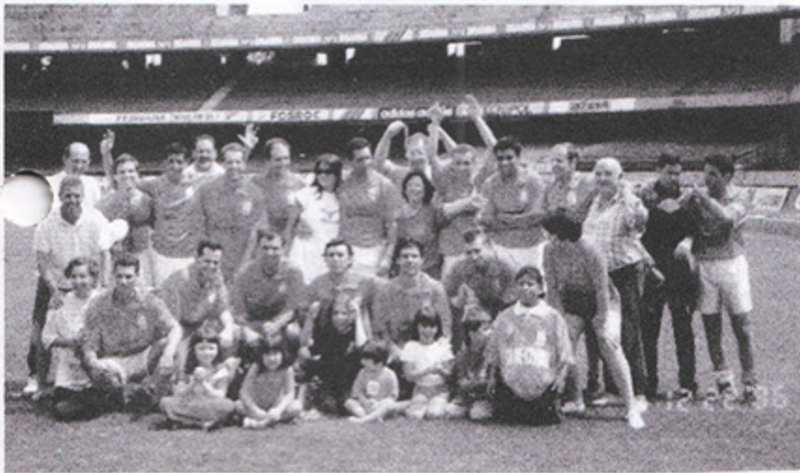
Holanda, categoria A

Os campeões de 1996 foram, na categoria A, o time da Holanda; na B, o Rio Branco; na C, o Juventus; e na D, o São José.