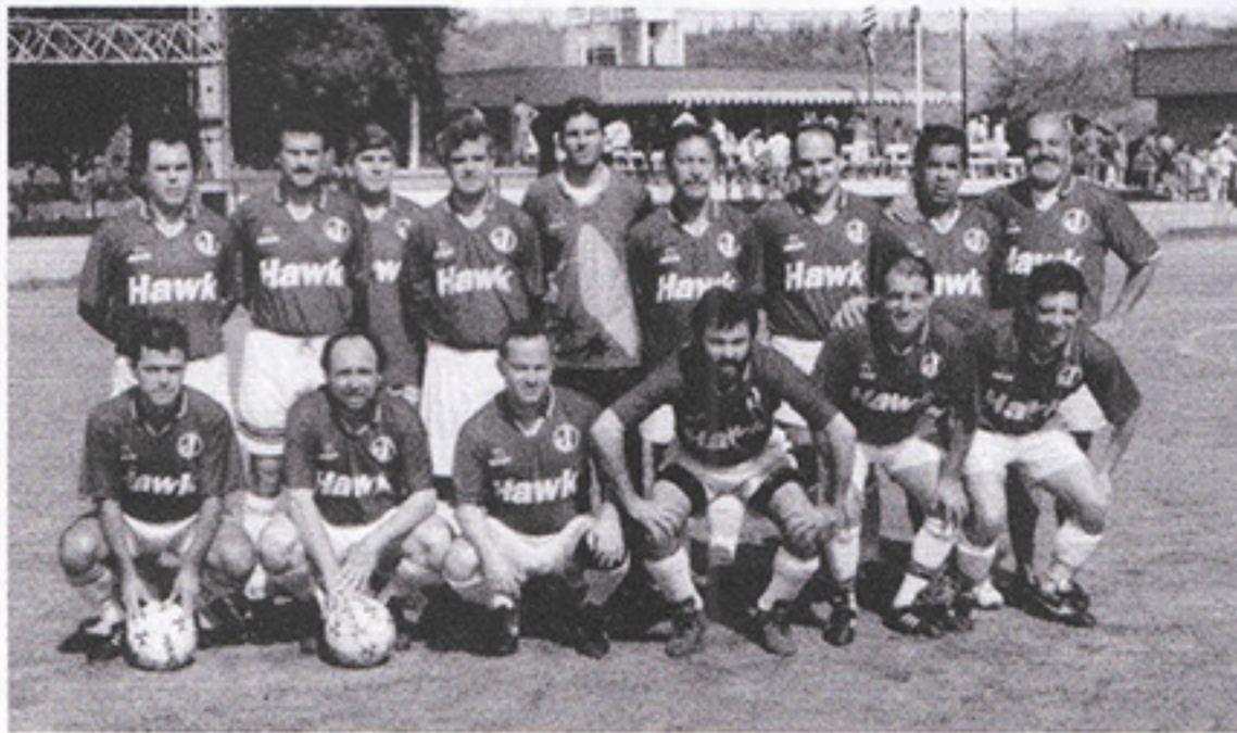
Juventus, categoria C