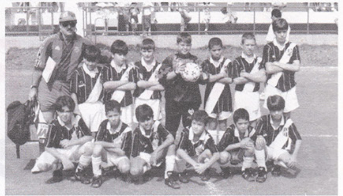
Ponte Preta, categoria Pré-Mirim

Os campeões de 96 foram Ferroviária (Fraldinha), Ponte Preta (Pré Mirim), Internacional (Mirim), Novorizontino