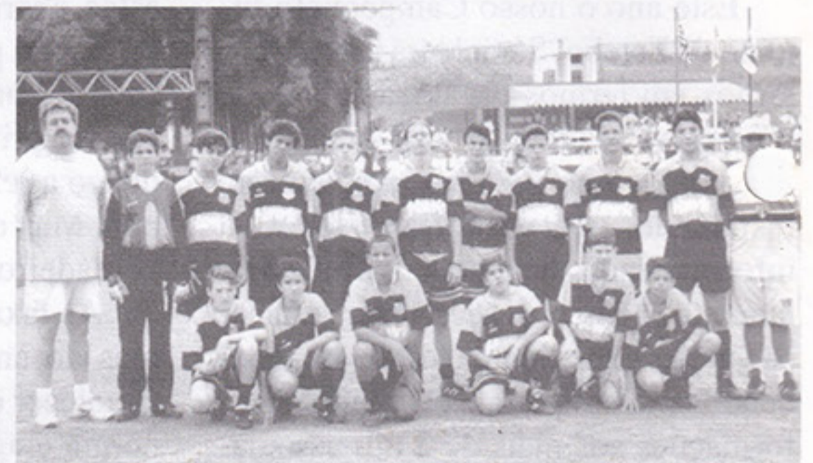
Novorizontino, categoria Infantil