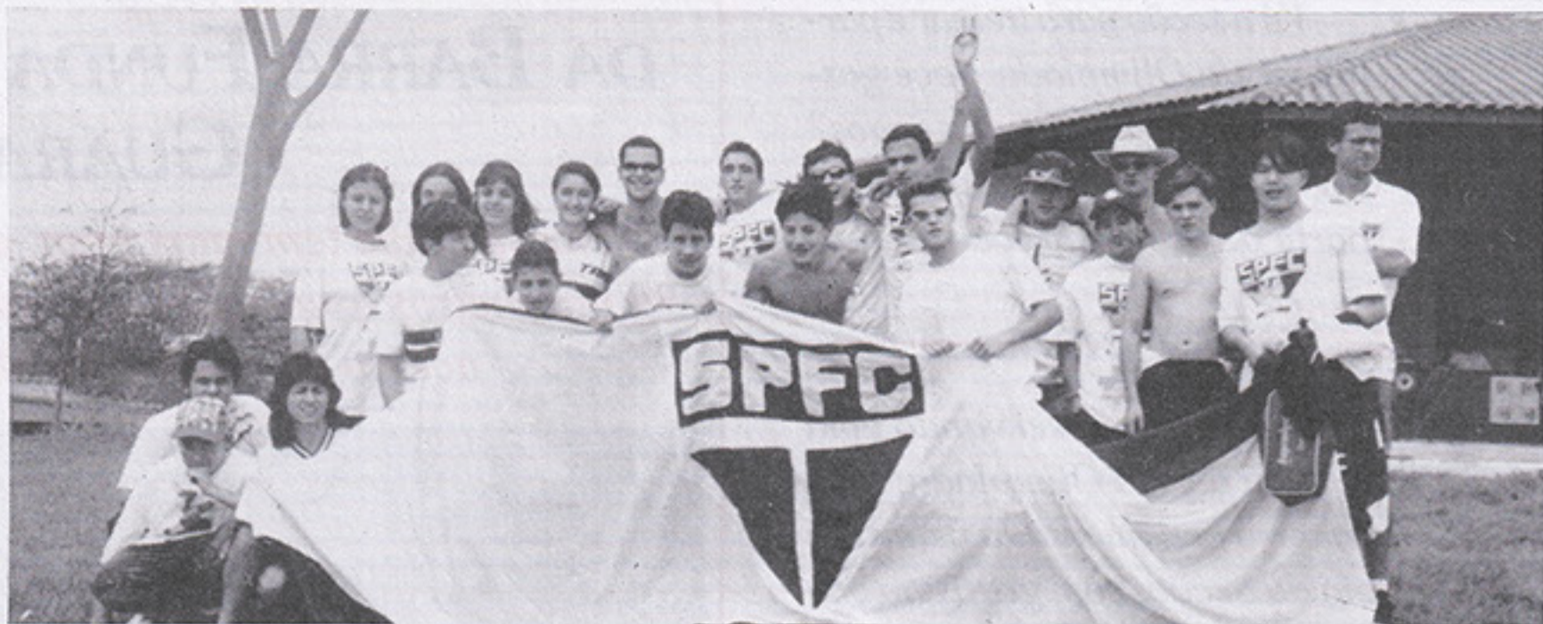
Equipe de Águas Abertas