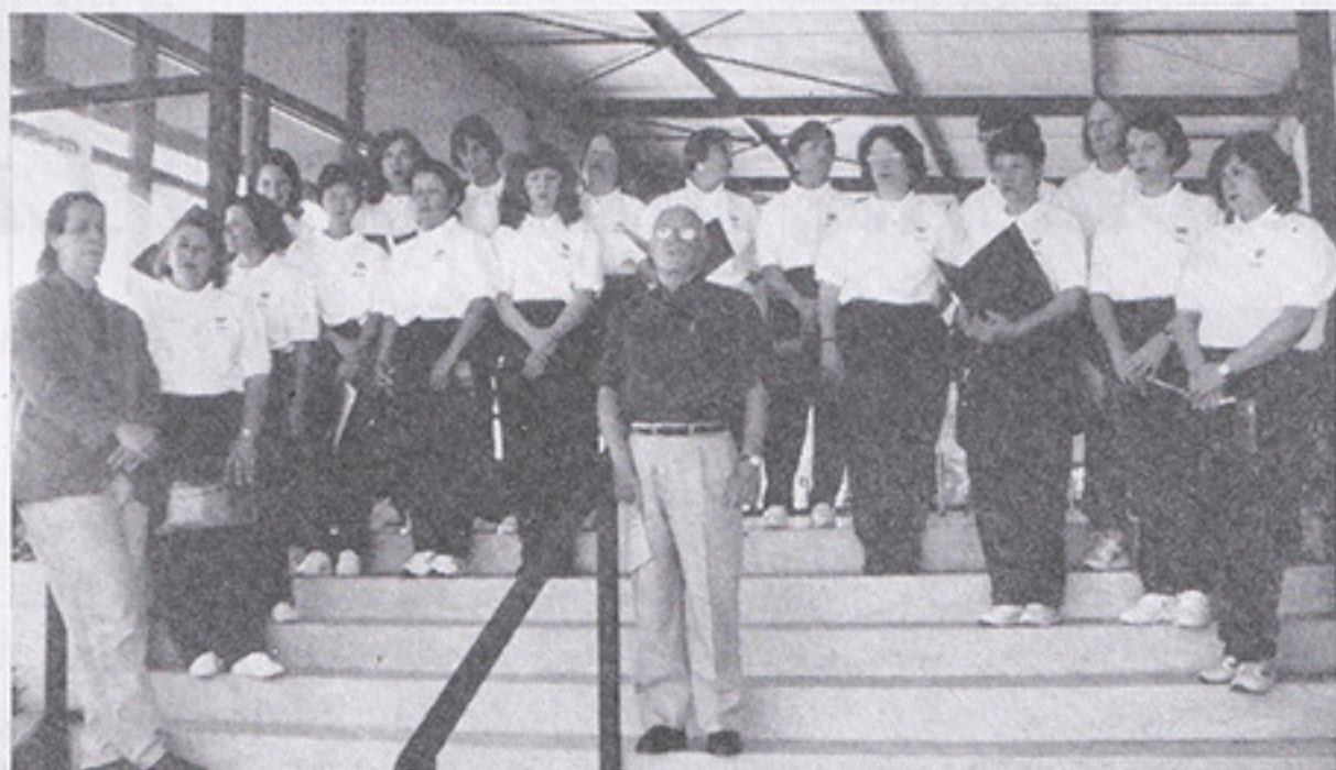
O Coral do SPFC, a cada dia melhor.

O Coral, que fez grande sucesso nas festividades da Abertura da Primavera, continua aceitando inscrições.