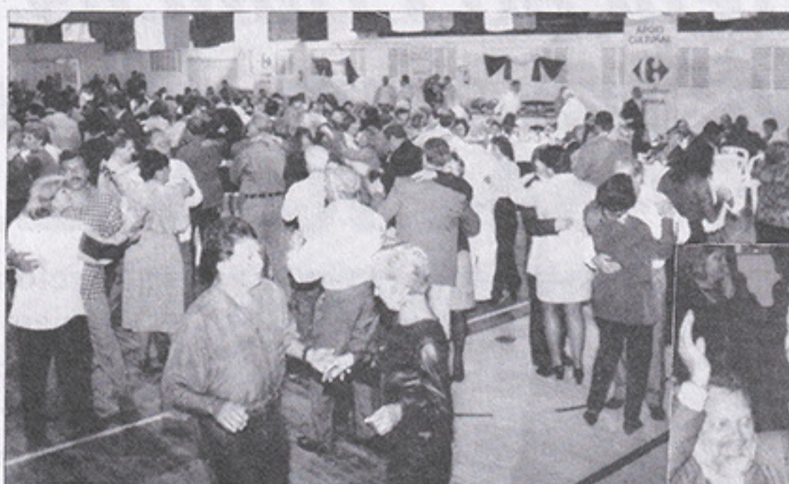
Festa Italiana: êxito total.

A decoração, idealizada e preparada pelo próprio Departamento Social, foi muito elogiada - assim como o preço do ingresso (R$25,00), barato porque o clube passou parte do custo da festa para os patrocinadores, Payot e Carrefour.