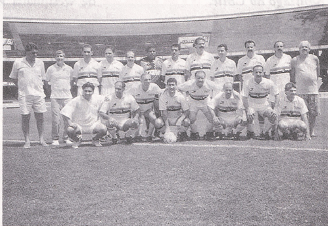
Categoria Master: um inédito hexacampeonato.