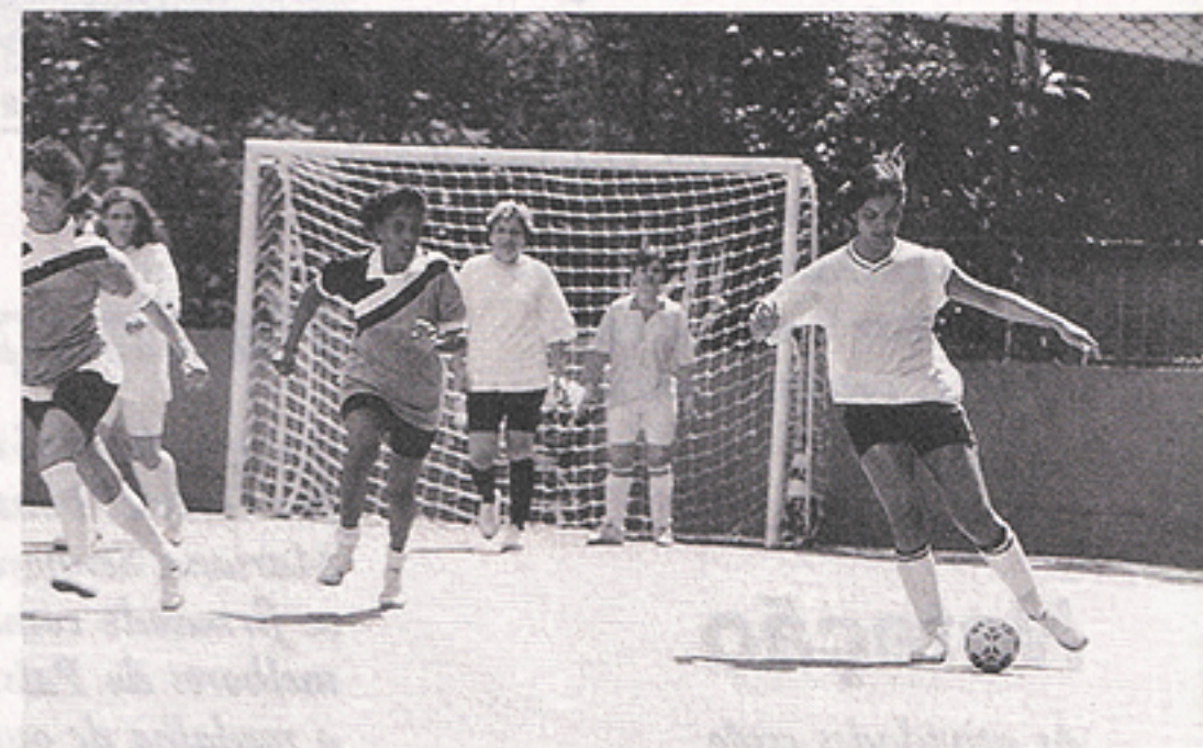
Futebol de salão: além da arte, a beleza.