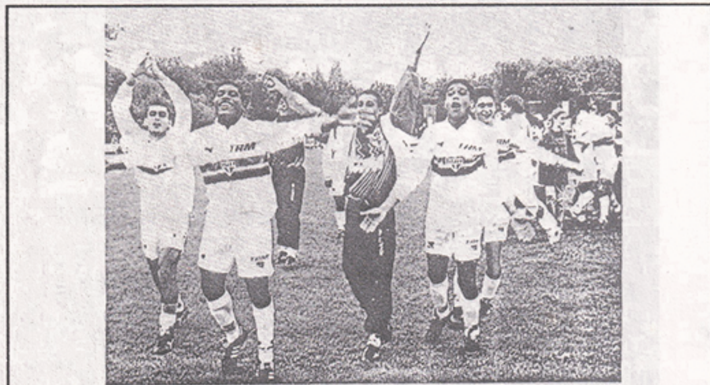
Der Nachwuchs des FC São Paulo triumphte beim B-Jugendturnier in Wiedenbruck auf.

O nosso time de juniores, dirigido por Dario Pereyra, também está ótimo. Em abril, venceu a Dallas Cup nos Estados Unidos; depois, em maio, a Copa Rider Sweet, em Santiago do Chile, superando os chilenos Colo-Colo e O'Higgins e o mexicano Los Tigres; mais recentemente, em agosto, nosso time Sub-20 ganhou a Copa Niigata, no Japão, dando verdadeiro show de futebol. Os japoneses, deslumbrados, repetiam "São Paulo é sempre São Paulo", lembrando dos shows que demos em Tóquio, no Barcelona e no Milan.