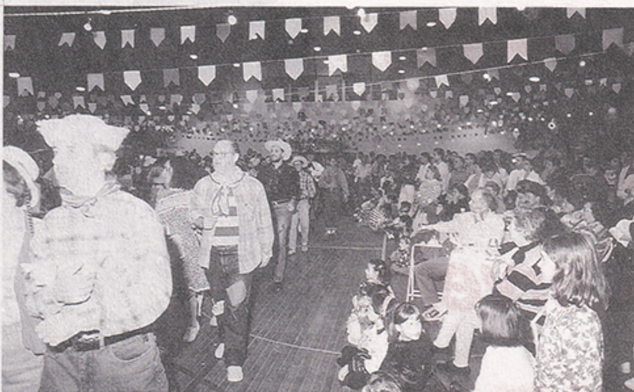
A caráter na Feste Junina: Dança da Quadrilha muito bem ensaiada.