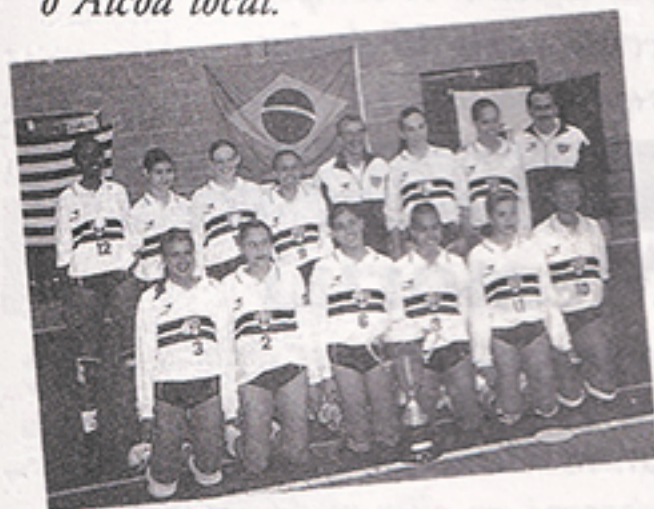
Vôlei: as campeãs do Torneio Início Infantil.

em agosto em João Pessoa. Por equipes, o São Paulo vai bem do mesmo modo: nas categorias infantil e infanto-juvenil, fomos campeões do Torneio Início da Federação Paulista — e nossa equipe principal ganhou um quadrangular interestadual em Juiz de Fora, superando Pinheiros, Minas Tênis e o Alcoa local.