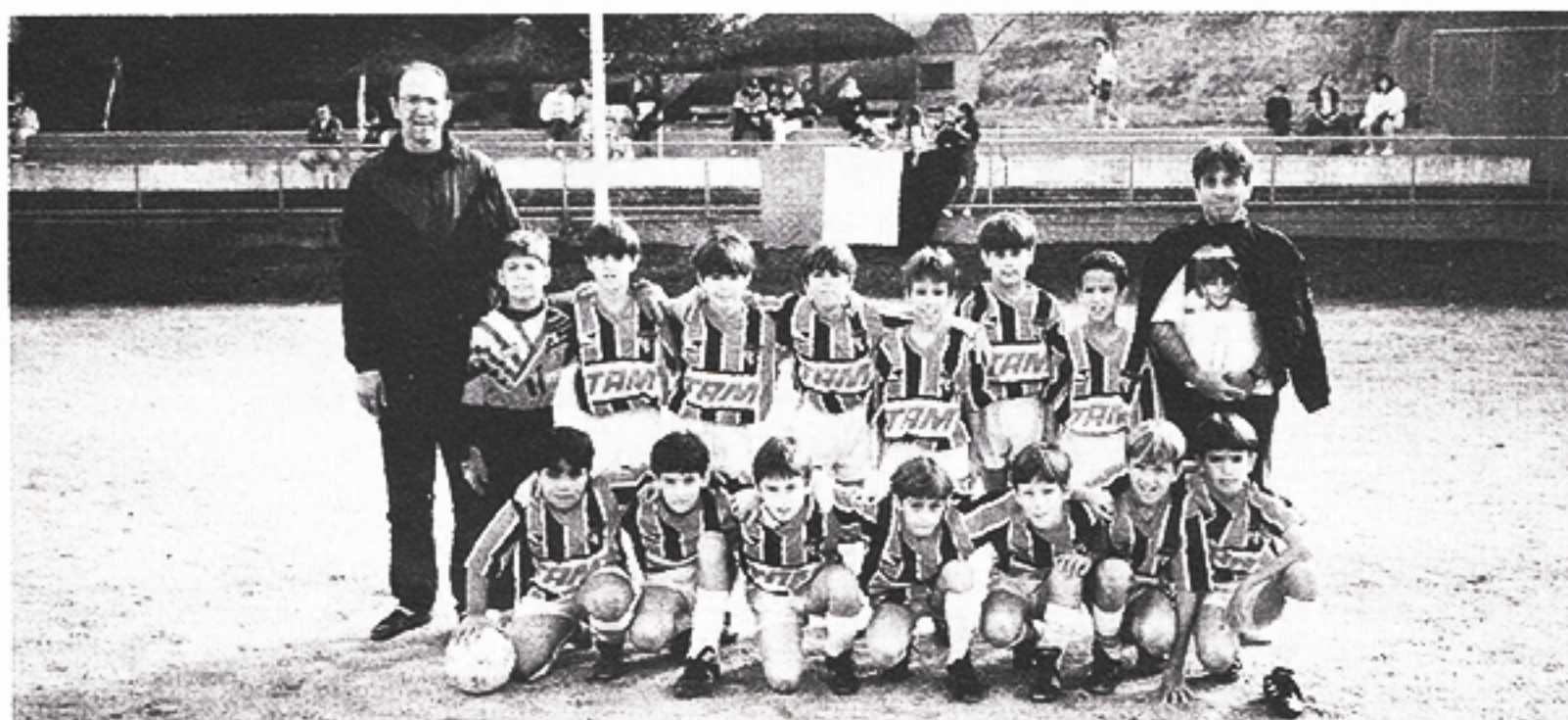
Pré-Mirim: campeão do Interclubes no primeiro semestre.

Há estudos para a construção de uma arquibancada especial em cima da laje do Bar do Joaquim. O projeto prevê uma base metálica fechada com vidros e uma varanda. O objetivo é melhorar a acomodação das mães.