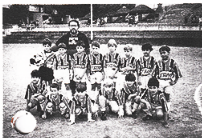
Nossos craques Faldinha no Interclubes.

PARA VOCÊ FICAR POR DENTRO / Nº 1 - AGOSTO 94