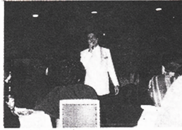
Agnaldo Rayol: um sucesso.

Festas Juninas 25 e 26/06 e 01/07 - A chuva e