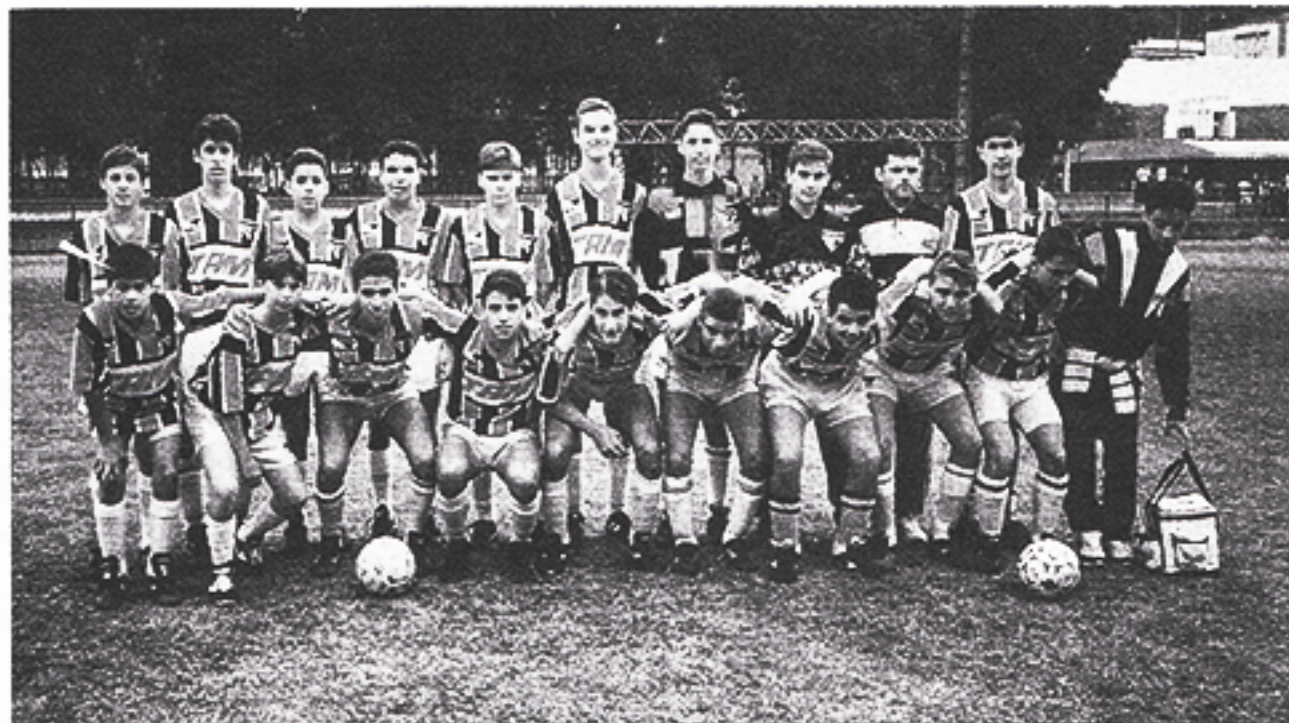
Infanto: terceiro lugar no primeiro semestre com um jogo a menos.