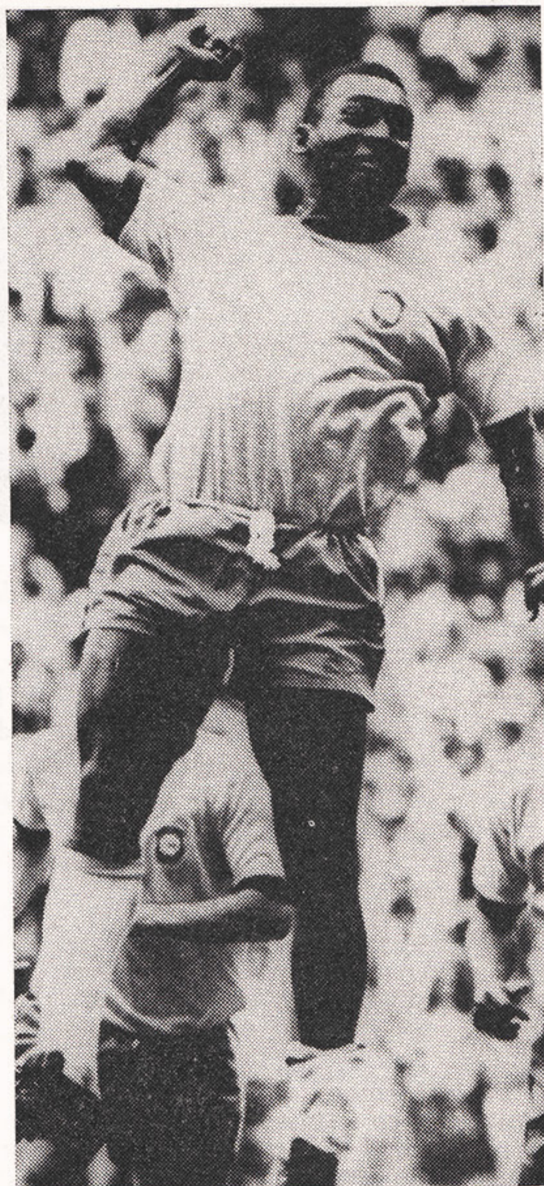
PÉLE VAI DEIXAR A SELEÇÃO

Não autorizar a participação das entidades e associações em competições internacionais, fora ou dentro do país, que não tenham feito prova da venda legal da receita líquida de divisas, obtidas em competição precedente, ou em cessão de jogadores para o exterior.”