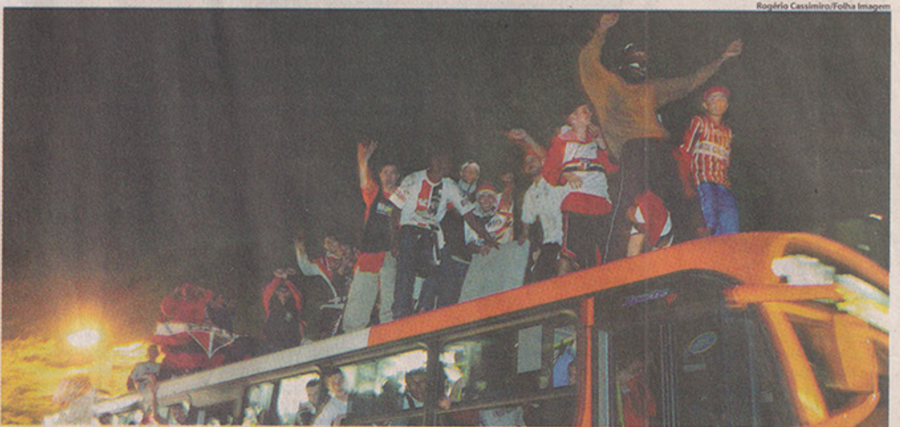
FESTA? São-paulinos se divertem em cima de ônibus na avenida Paulista, tradicional palco de festejos na capital paulista. Assim como ocorrera no Morumbi, houve confronto entre torcedores e a polícia após o término da decisão, além da depredação de estabelecimentos