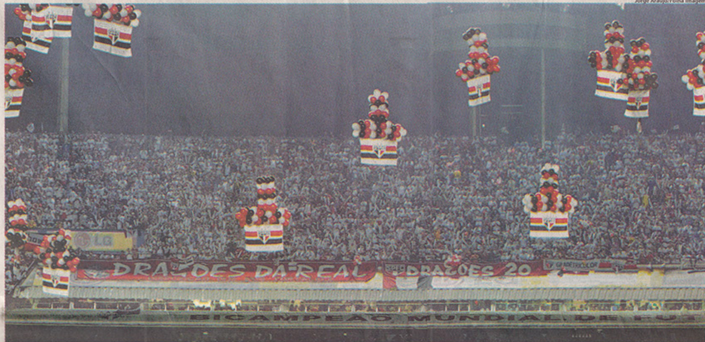
Depois de proporcionar bons públicos no Morumbi durante toda a Libertadores, torcida são-paulina festeja no estádio, tomado ontem por quase 72 mil pagantes