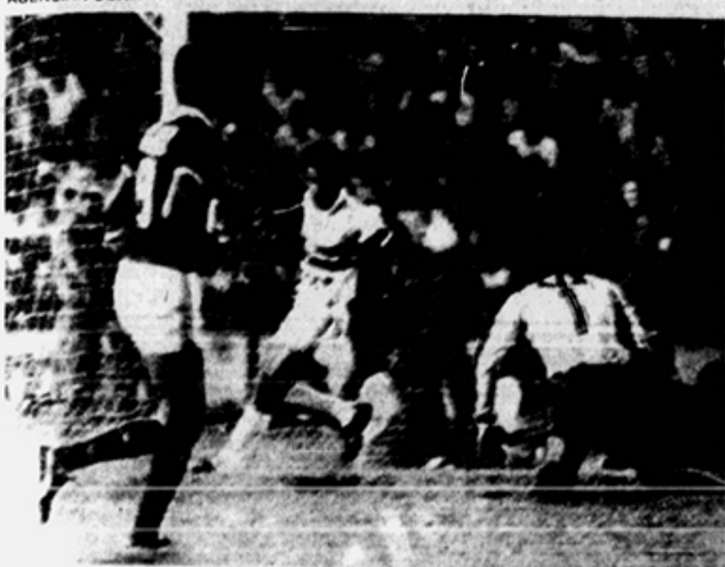
Careca, artilheiro da Copa, festeja o terceiro gol