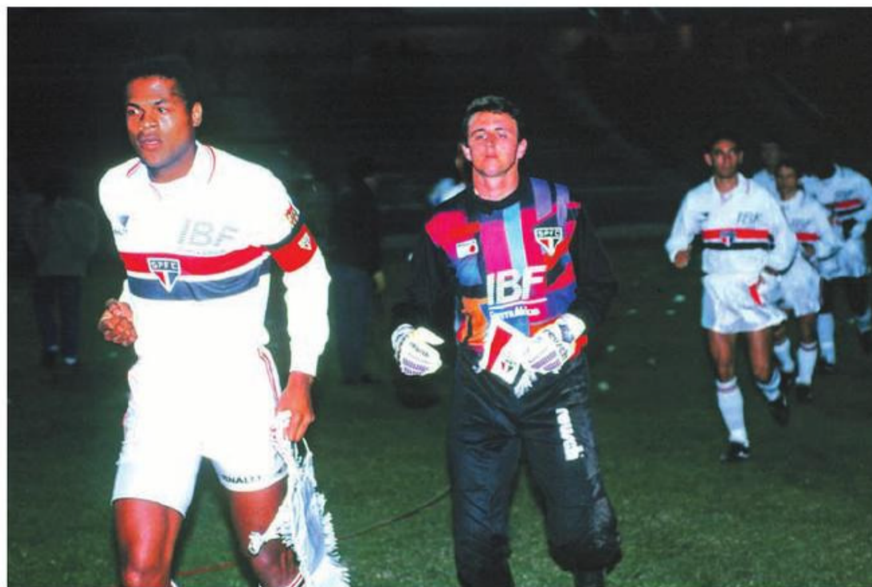
Rogério en La Bombonera, visitando a Boca Juniors por la Copa Nicolás Leoz, 19 años antes de la final con Tigre. Sigue a Ronaldão. Rogério in The Candy-Box, visiting Boca Juniors in the Nicolás Leoz Cup, 19 years after the final with Tigre. He is following Ronaldo.

The Brazilians, I think, are at present a little more on top of the other teams and I think that at