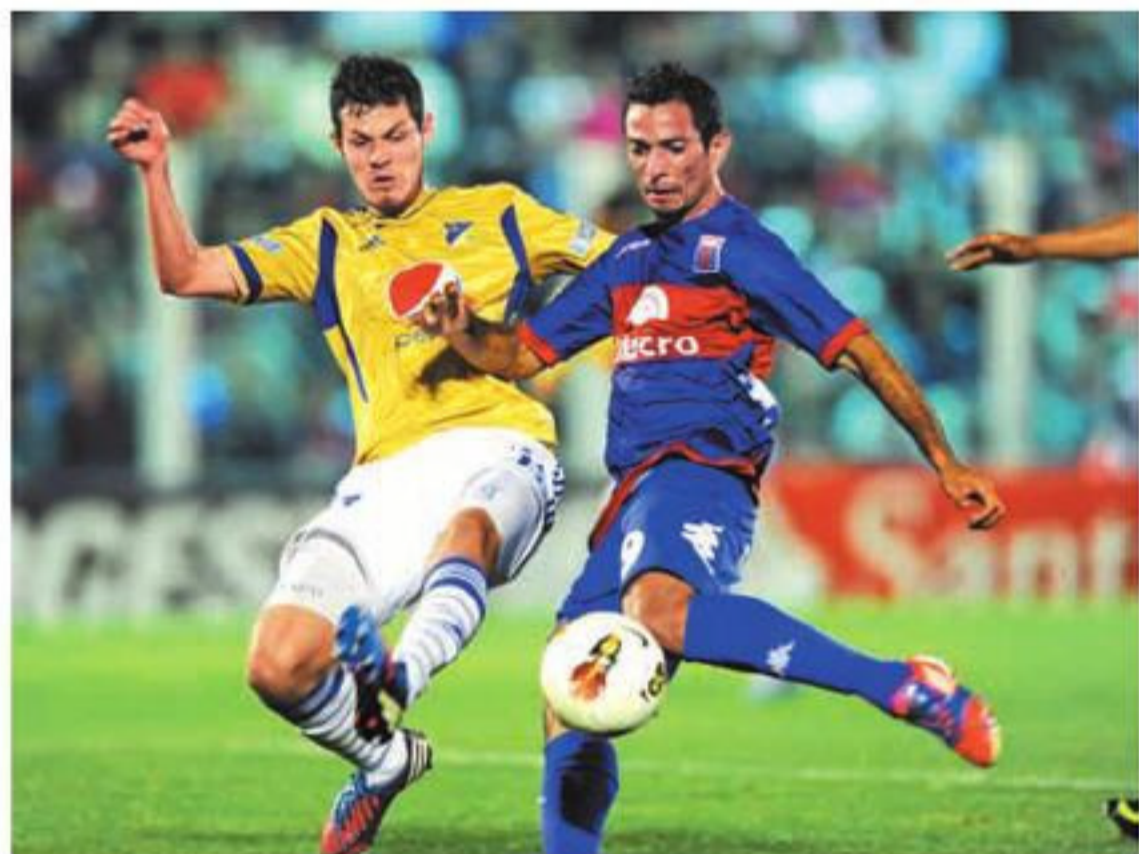
El club Tigre, de gran actuación en la Copa, llegó a la final con un fútbol de real valía. Tigre club with a great performance in the Cup, in the final with excellent football.