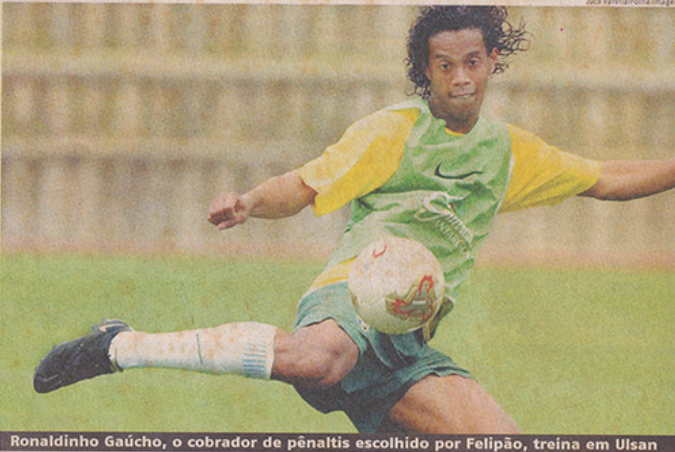
Ronaldinho Gaúcho, o cobrador de pênaltis escolhido por Felipão, treina em Ulsan