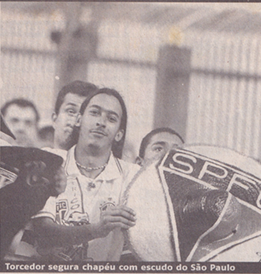
Torcedor segura chapéu com escudo do São Paulo

Foram 60 mil pessoas no estádio, mas a multidão que ficou de fora, perto de 40 mil, chegou a deixar o policiamento do Morumbi tenso, com medo de que os ânimos ficassem exaltados. Apenas 15 mil ingressos foram vendidos antecipadamente. A Polícia Militar estimava que o público da final do Superpaulistão seria de no máximo 40 mil torcedores. Felizmente, nada sério aconteceu nas imediações do Morumbi, a não ser alguns bate-bocas entre torcedores exaltados e nenhuma ocorrência grave foi registrada. (FbM)