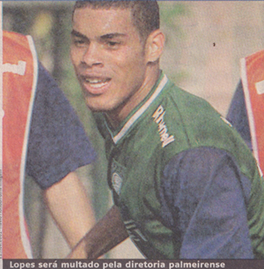
Lopes será multado pela diretoria palmeirense