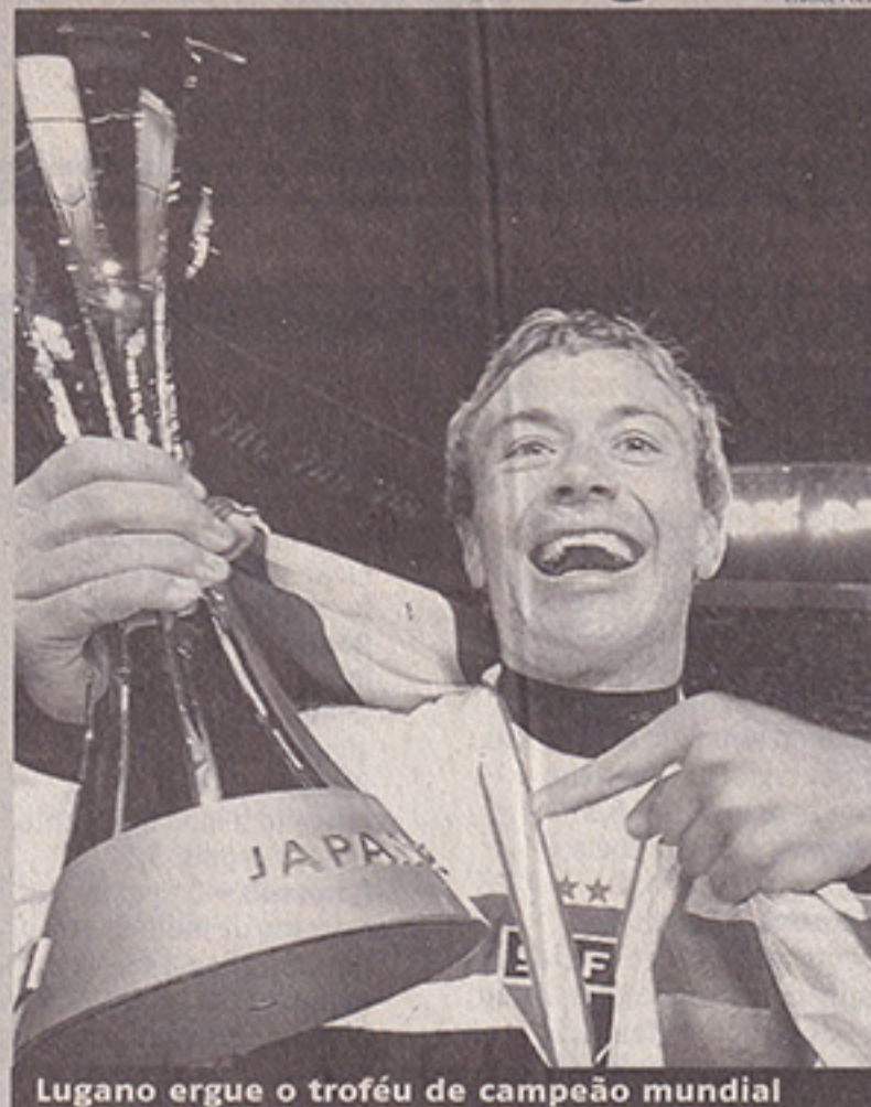
Lugano ergue o troféu de campeão mundial

O zagueiro Lugano não esqueceu de suas origens na hora de comemorar o título mundial. Com uma bandeira do Uruguai nas costas, ele recebeu a medalha de campeão e lembrou de sua cidade natal.