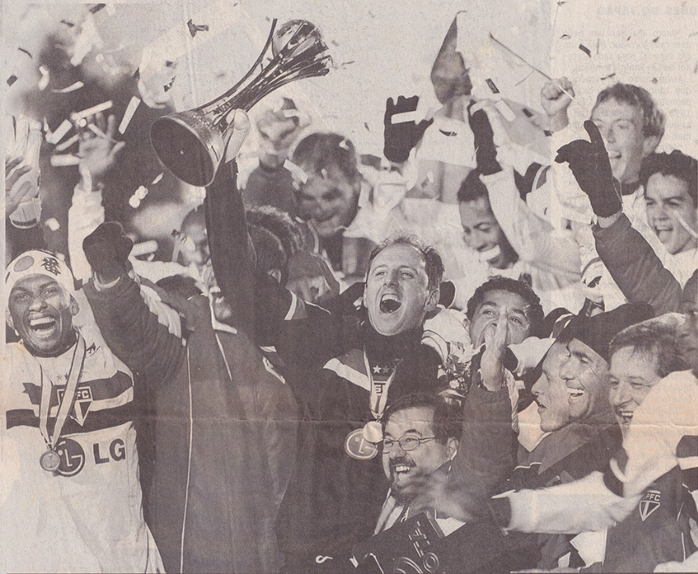
Rogério Ceni segura o troféu de campeão; jogadores e dirigentes comemoram a conquista do tri mundial após a vitória sobre o Liverpool

VOLANTE DO TRICOLOR NÃO ESCONDIA A ALEGRIA, PRINCIPALMENTE PORQUE O GOL ERA UM PEDIDO DO SEU FILHO. ELE TAMBÉM ELOGIOU O CHEFÃO AUTUORI