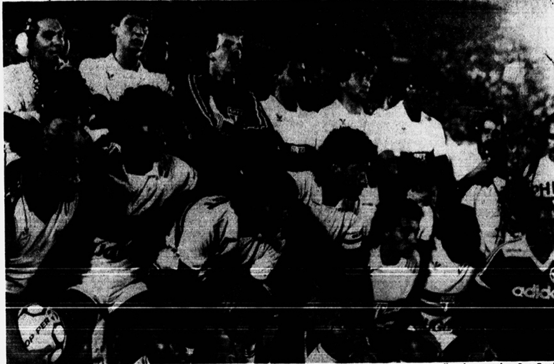
São Paulo Futebol Clube, campeão brasileiro de 1986: uma conquista que fez justiça a um time que se mostrou sempre o melhor durante toda a Copa Brasil