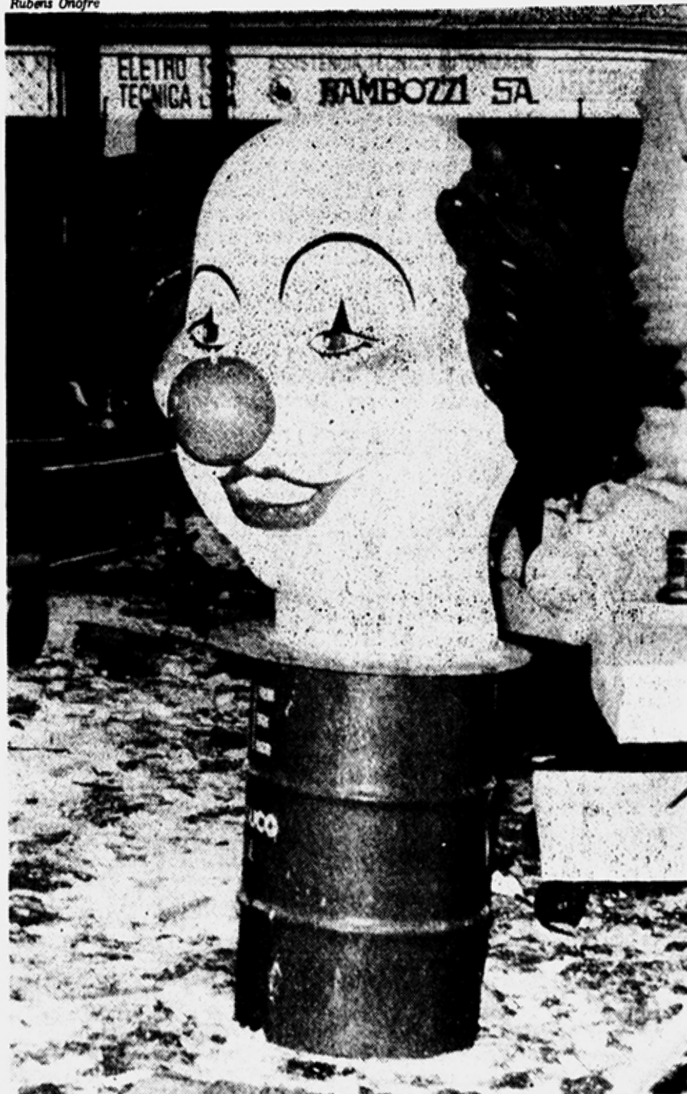
Últimos preparativos movimentam os barracões das escolas de samba

O presidente José Sarney assinou, ontem, decreto-lei autorizando o Banco Central a intervir nos bancos estaduais do Rio de Janeiro, Maranhão, Ceará, Mato Grosso e Santa Catarina. A ação objetivaria o rombo financeiro registrado nestes cinco estabelecimentos, de Cz$ 43 bilhões, segundo informação concedida pelo ministro Dílson Funaro, problema que estaria agravando ainda mais o déficit público. Esta providência pode ser interpretada, em primeiro lugar, como a primeira medida de choque do Governo dentro do plano de estabilização econômica anunciado pelo presidente Sarney na semana passada e, em segundo lugar, como uma advertência aos bancos credores, e, em particular ao FMI, de que o Governo está se esmerando em sanear a situação econômica interna. Esta intervenção (chamada oficialmente de regime especial temporário de administração) difere da tradicional por não implicar na liquidação dos bancos. Os seus dirigentes atuais serão afastados e durante o período da intervenção, os bancos estaduais sofrerão um processo de auditoria, sendo estudadas formas de cobrir os rombos. (Página 9)