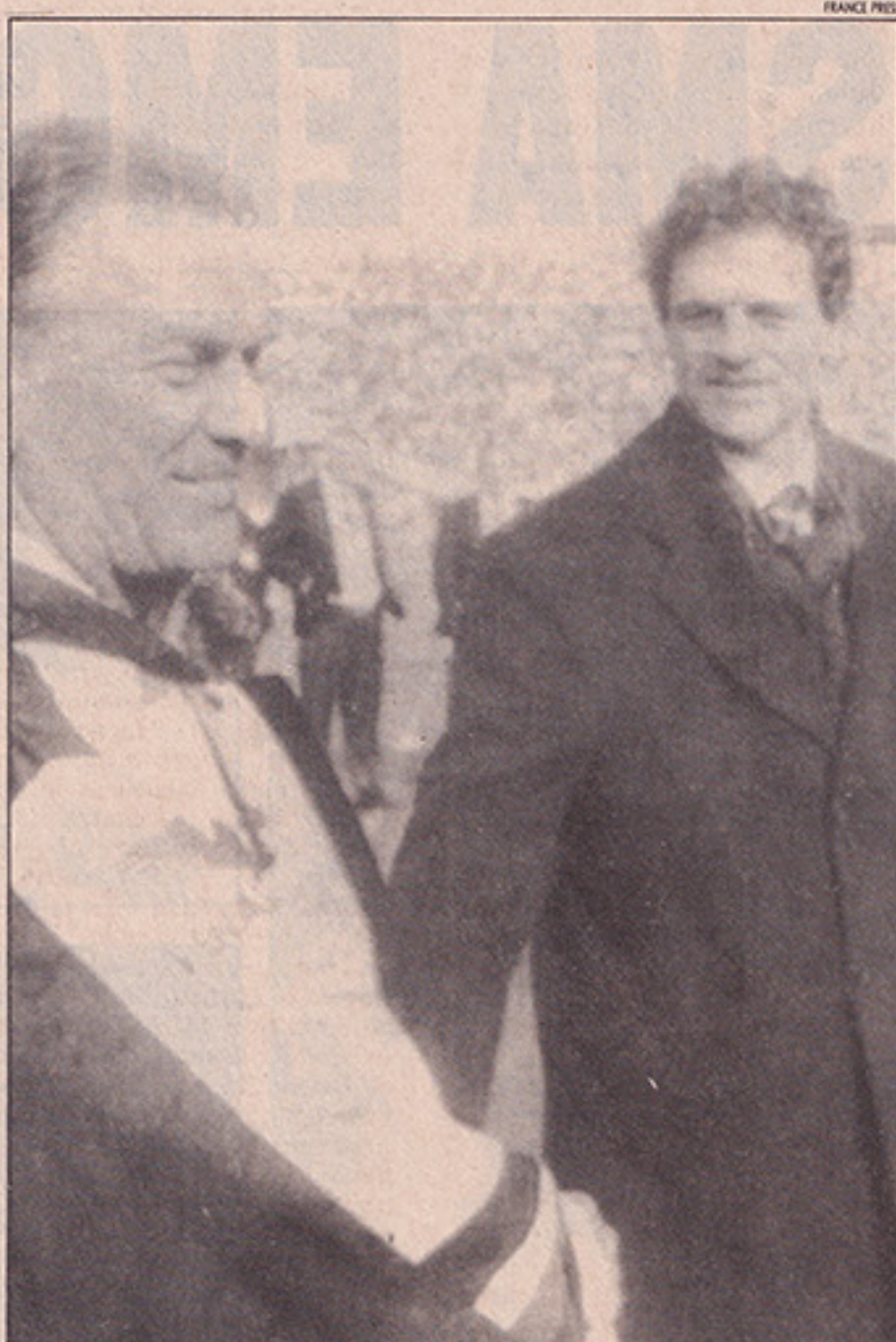
TELÊ E FÁBIO CAPELLO: DUAS VISÕES SOBRE O MESMO JOGO.

O técnico também lembrou: "Tivemos uma semana para treinar e o São Paulo cresceu em campo. É isso que eu defendo. Jogando três vez por semana não tem time no mundo que vai render bem". Se vai renovar o contrato com o São Paulo, Telê acha que sim: "Estamos conversando. Eu não quero ir embora. A não ser que eles não me queiram mais. Meu contrato vai terminar agora e quando a gente chegar ao Brasil vamos sentar e conversar".