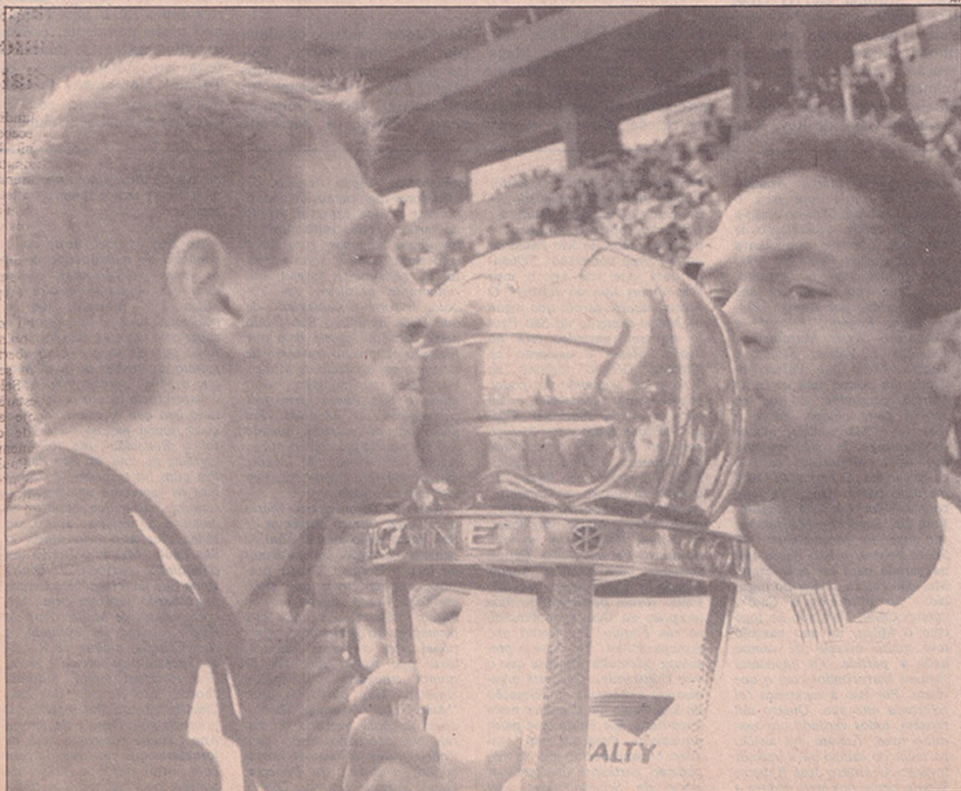
ZETTI E RONALDO BEIJAM A TAÇA DO BICAMPEONATO MUNDIAL INTERCLUBES.