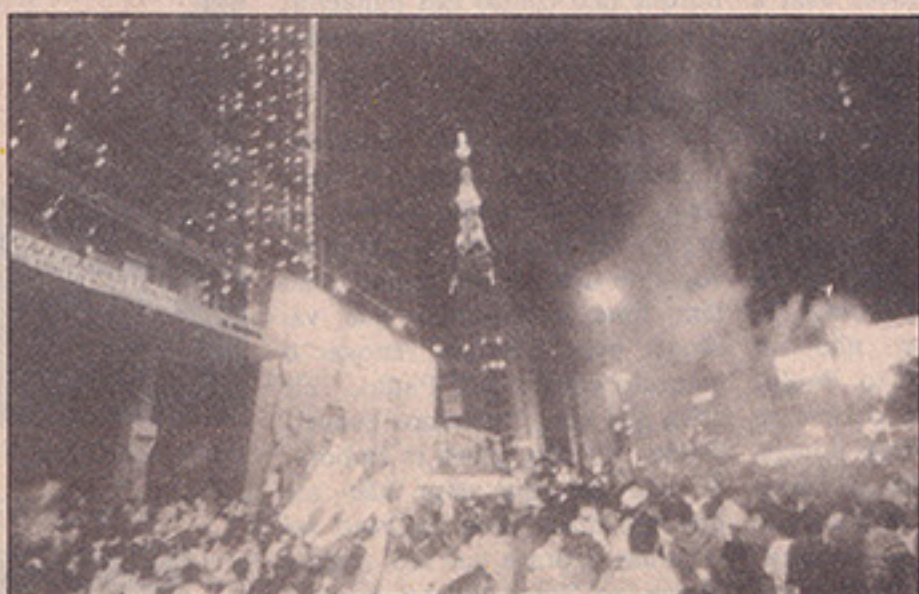
ATÉ AS ATRIZES REGINA DUARTE E EVA VILMA ENTRARAM NA FESTA QUE COMEÇOU NA AVENIDA PAULISTA, ONDE FOI INSTALADO O TELÃO, TERMINANDO NOS RESTAURANTES.

CARTÃO PALMEIRAS BRADESCO VISA. PARA QUEM TEM AMOR À CAMISA.