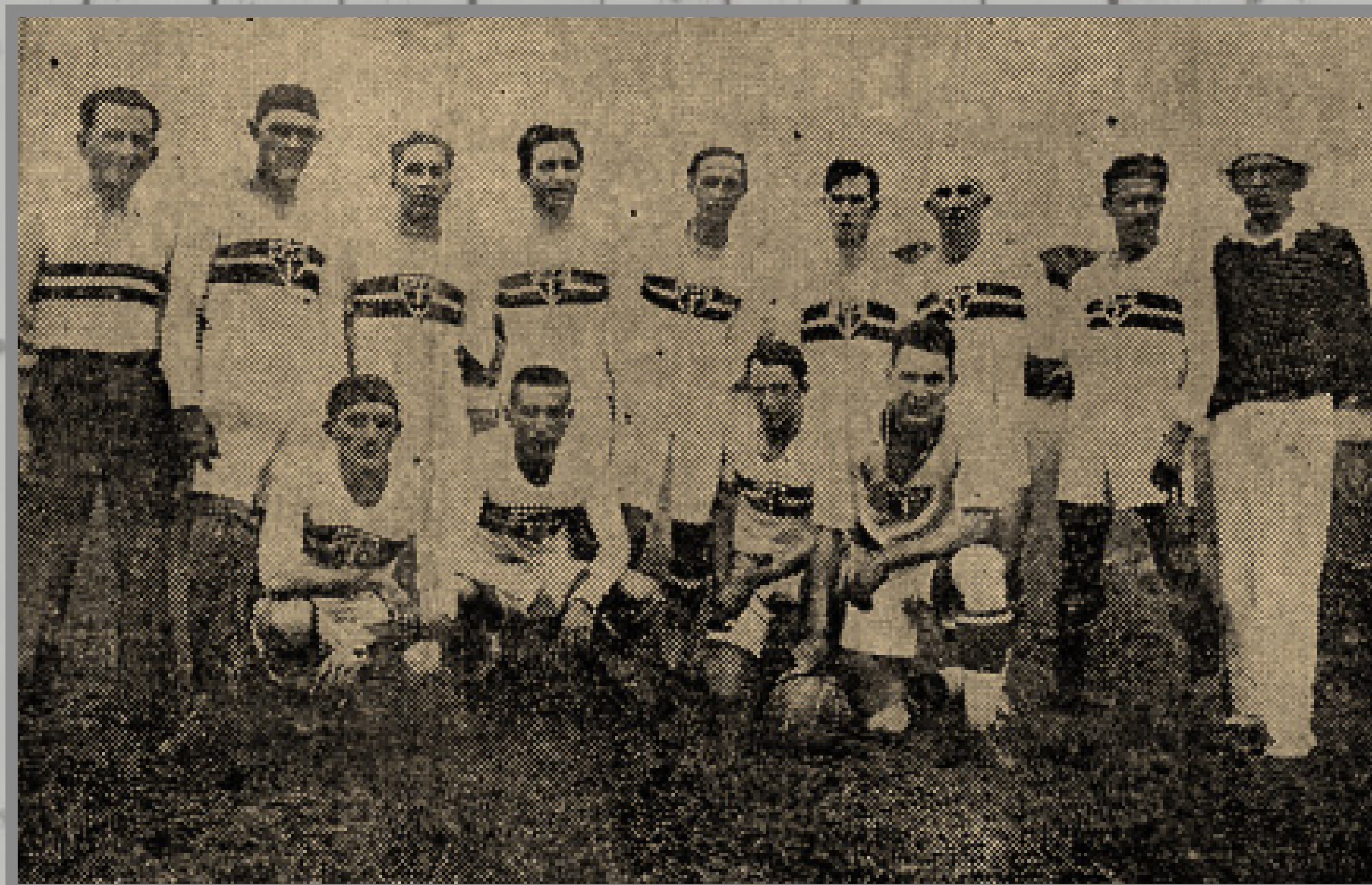
IMAGEM DE ARQUIVO HISTÓRICO

CAMPEONATO PAULISTA ESTÁDIO DA AV. CONSELHEIRO NÉBIAS 1/JUN