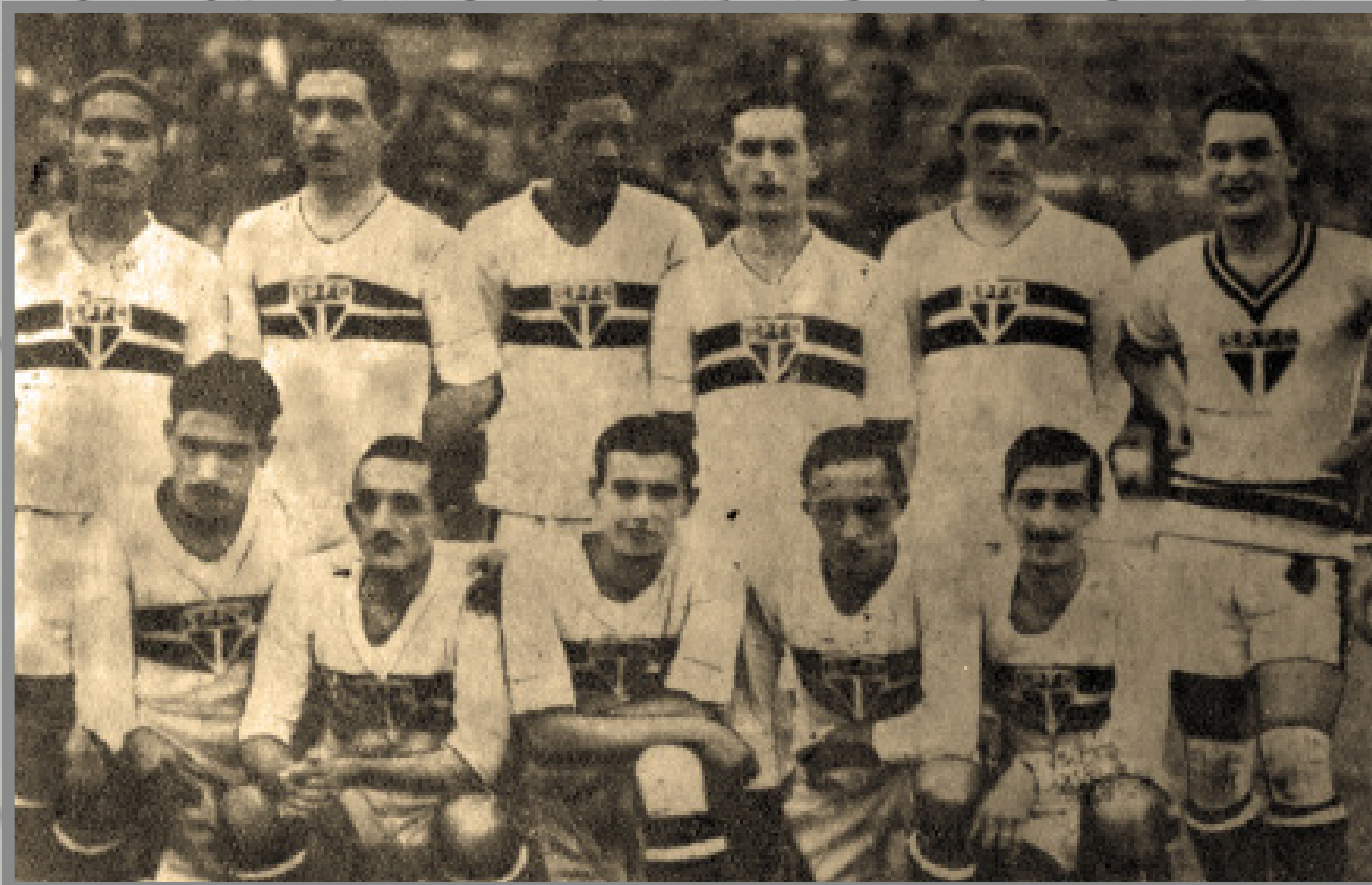
IMAGEM DE ARQUIVO HISTÓRICO