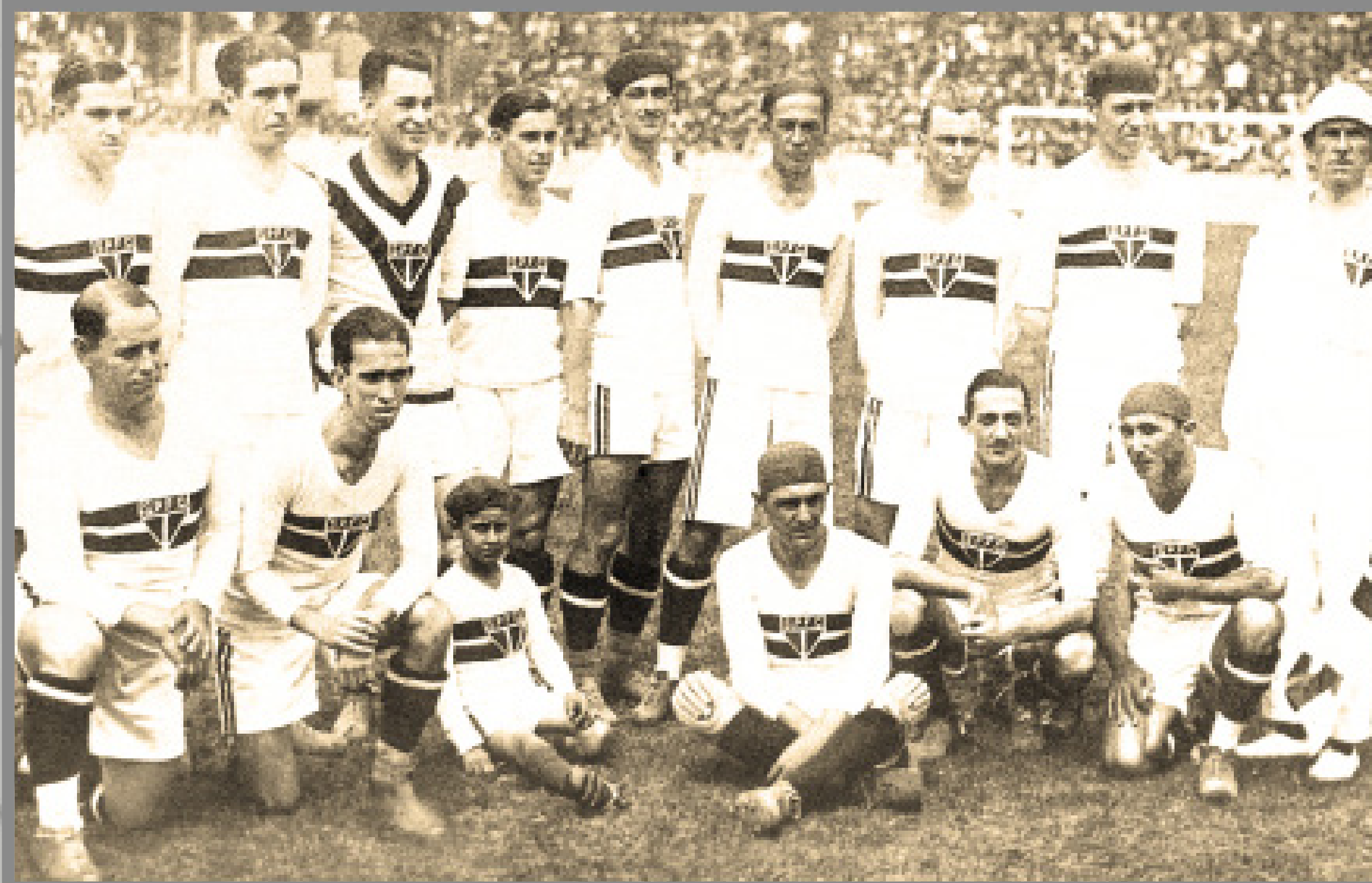
IMAGEM DE ARQUIVO HISTÓRICO