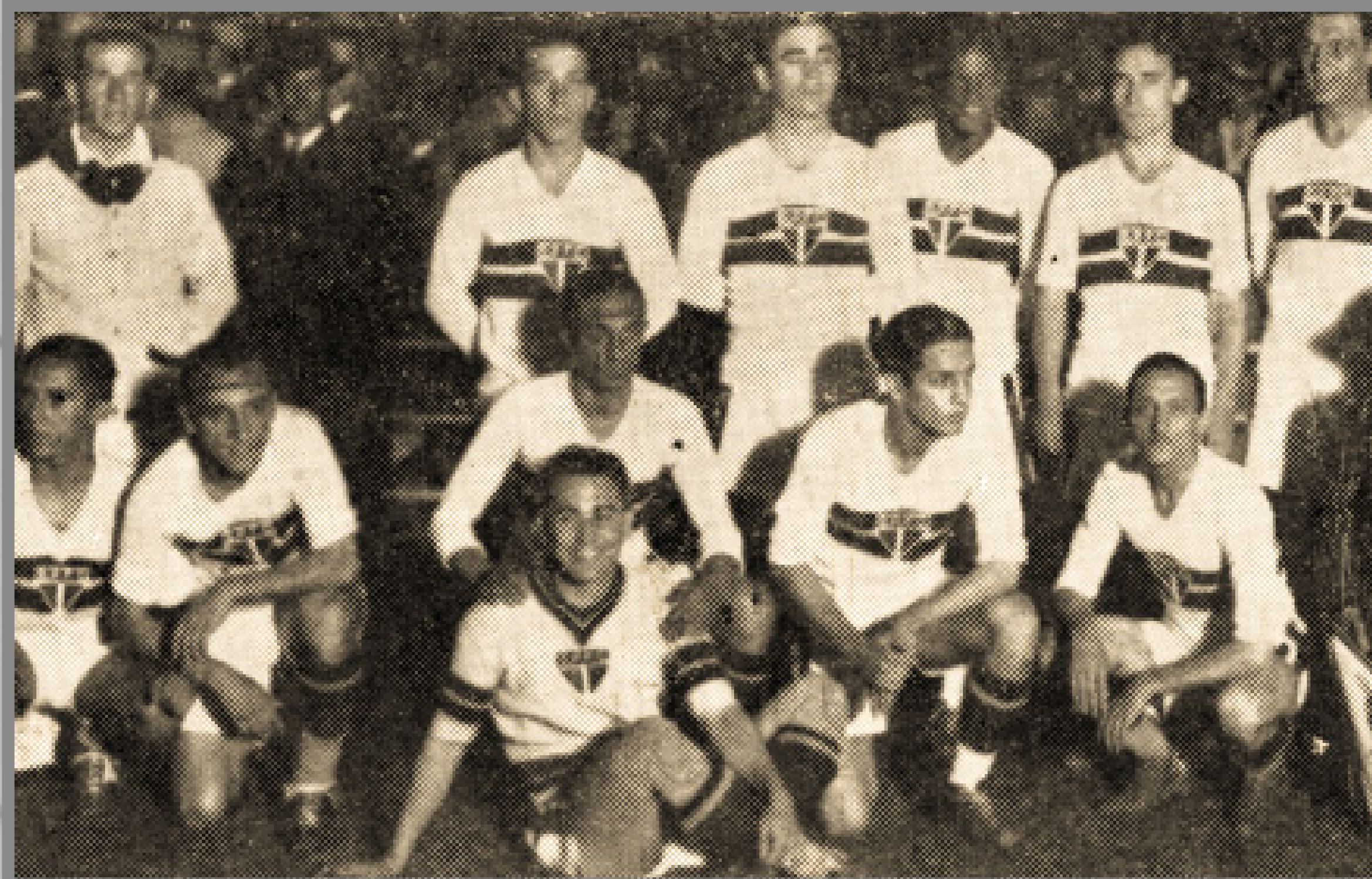
IMAGEM DE ARQUIVO HISTÓRICO

CAMPEONATO PAULISTA ESTÁDIO DA CHÁCARA DA FLORESTA 21/DEZ