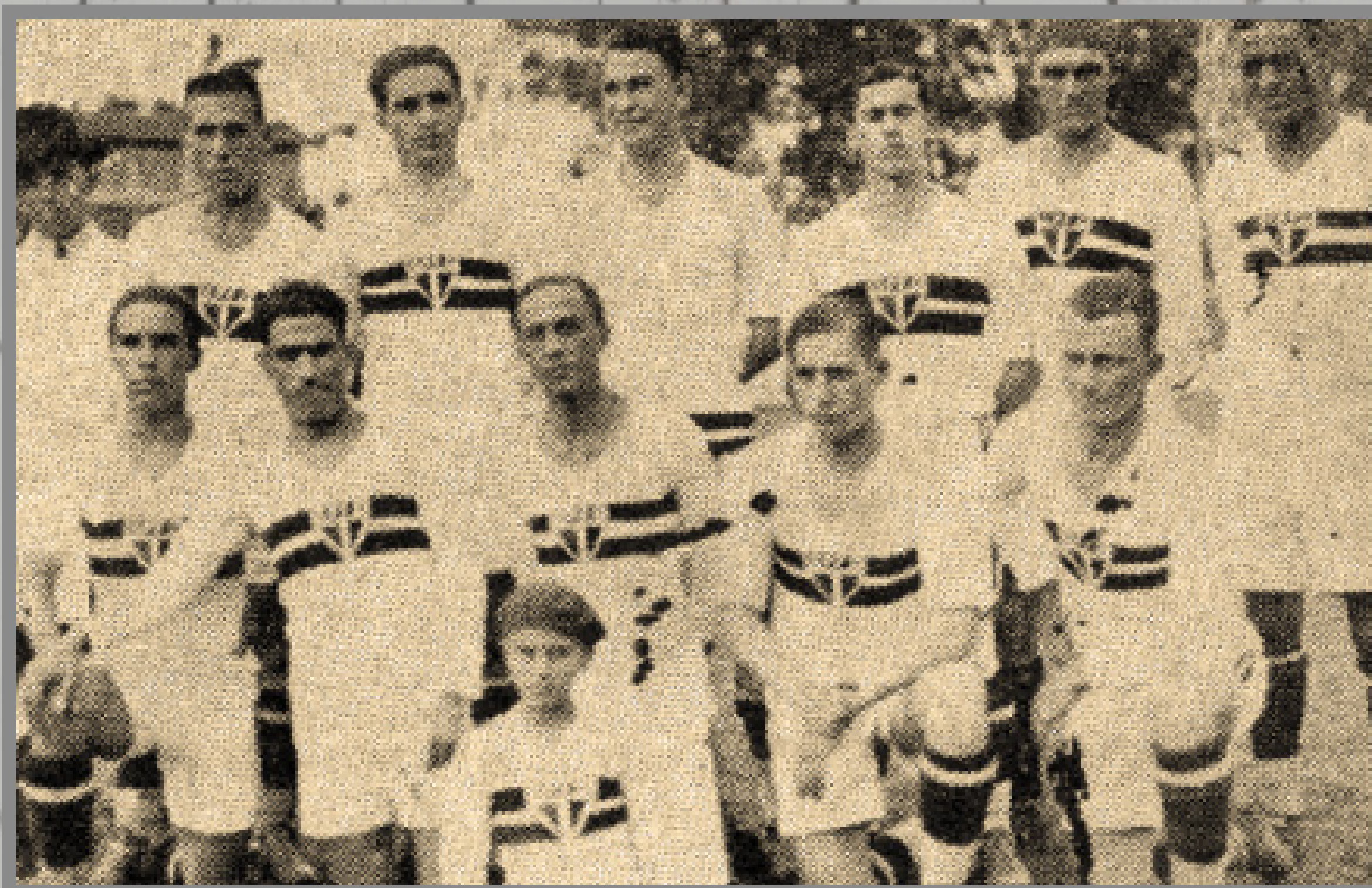
IMAGEM DE A GAZETA

CAMPEONATO PAULISTA ESTÁDIO DA CHÁCARA DA FLORESTA 30/MAR