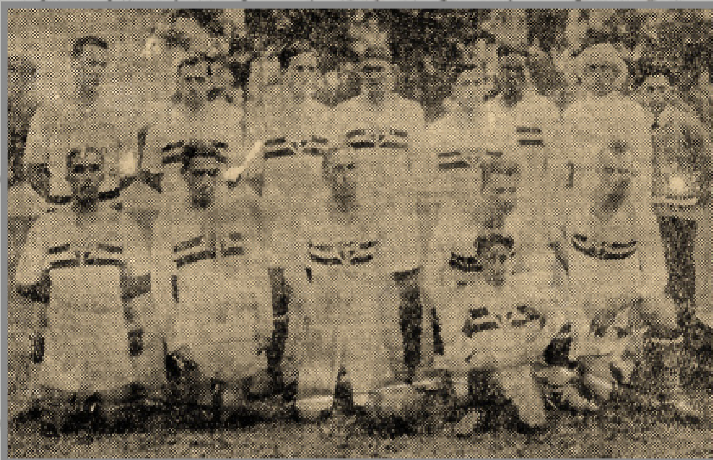
IMAGEM DE CORREIO PAULISTANO

CAMPEONATO PAULISTA ESTÁDIO DA CHÁCARA DA FLORESTA 6/ABR